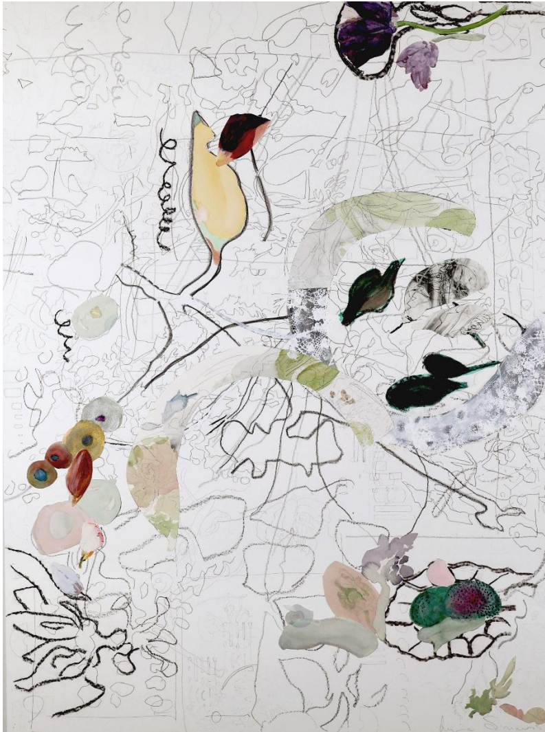
Landings – technique mixte sur aludibond - 120 x 90 cm