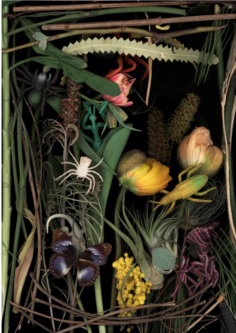
Lustgarten 2 - Scanogramme imprimé directement sur aluminium - 45 x 32 cm