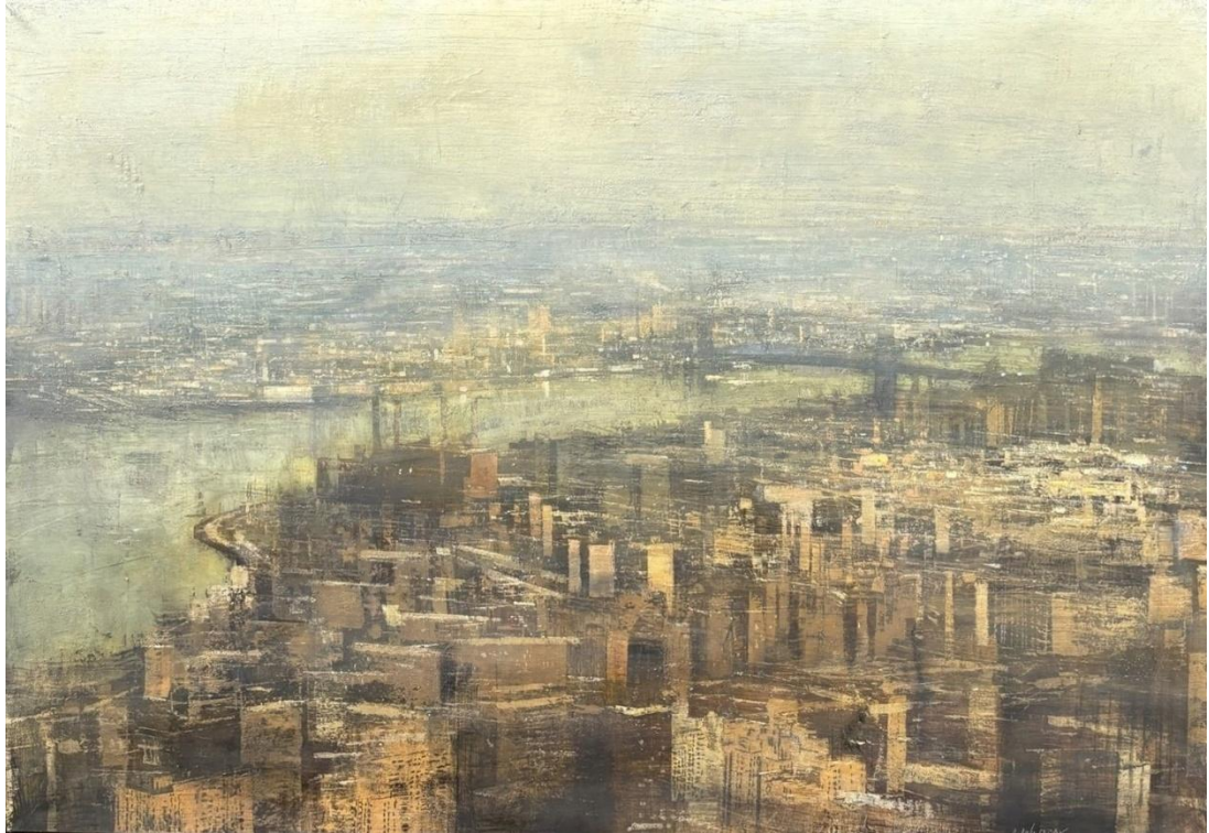
Después de la lluvia Oil on wood – 205 x 146 cm