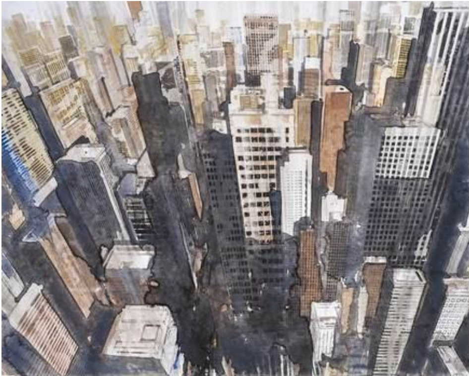
Upper East side Watercolor on paper - 48 x 60 cm