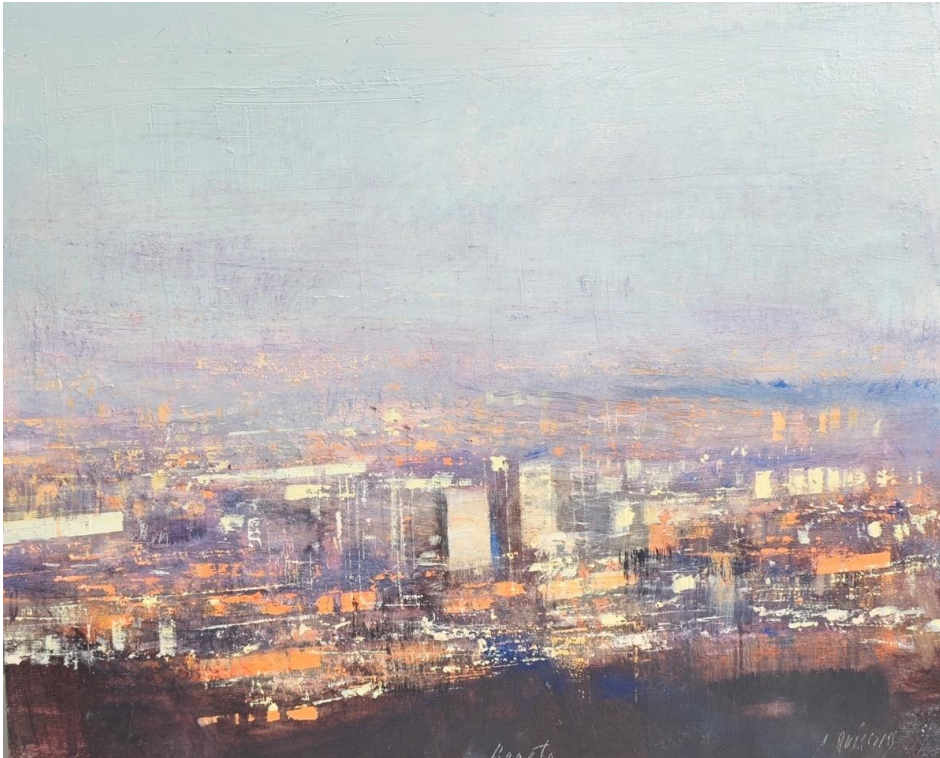
Bogotá Oil on wood - 50 x 61 cm