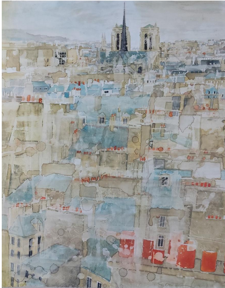
Les toits et Notre Dame Oil on wood - 60 x 47,8 cm