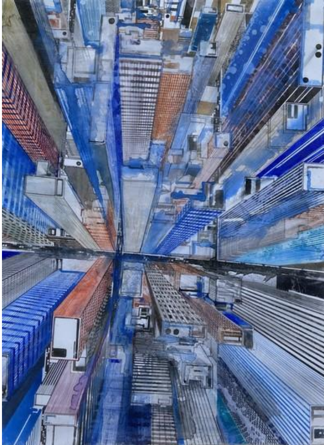
New York Watercolor on paper - 73 x 54 cm