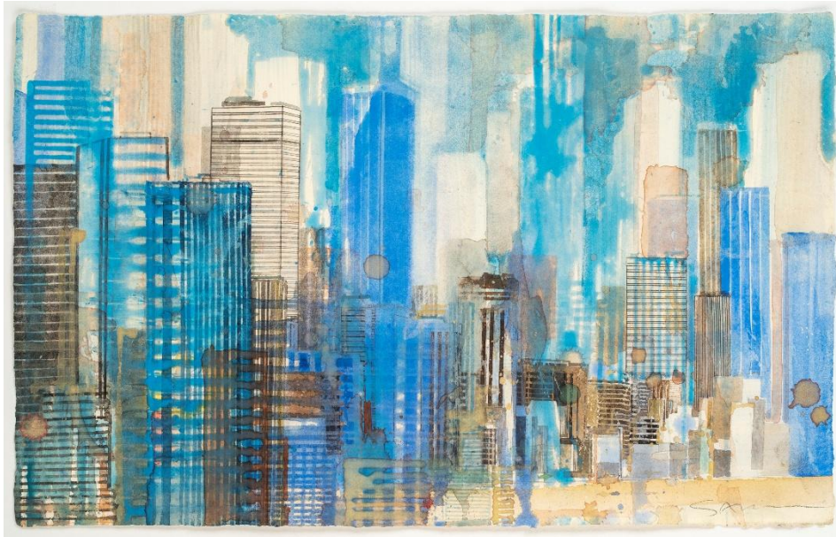
Gottfried SALZMANN - « New York bleu » - aquarelle sur papier - 29,8 x 47,3 cm