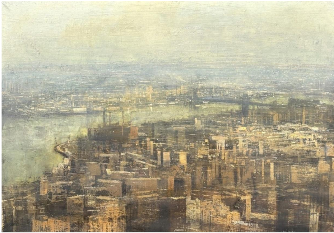
Alejandro QUINCOCES - « Despues de la lluvia » - huile sur bois - 205 x 146 cm - ©Alejandro QUINCOCES