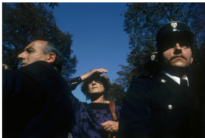
« Paris, 1980 »

Dans les années 60, la presse se modifie, publie des photos en couleurs, cela me permet d'obtenir des commandes et de gagner ma vie uniquement grâce à la photographie. Je travaille pour Réalités et pour EDF qui commencent à publier des photos en couleurs. En 1965 je voyage aux USA, c'est le choc de la modernité. En 1966, je réalise des reportages en couleurs pour Réalités.