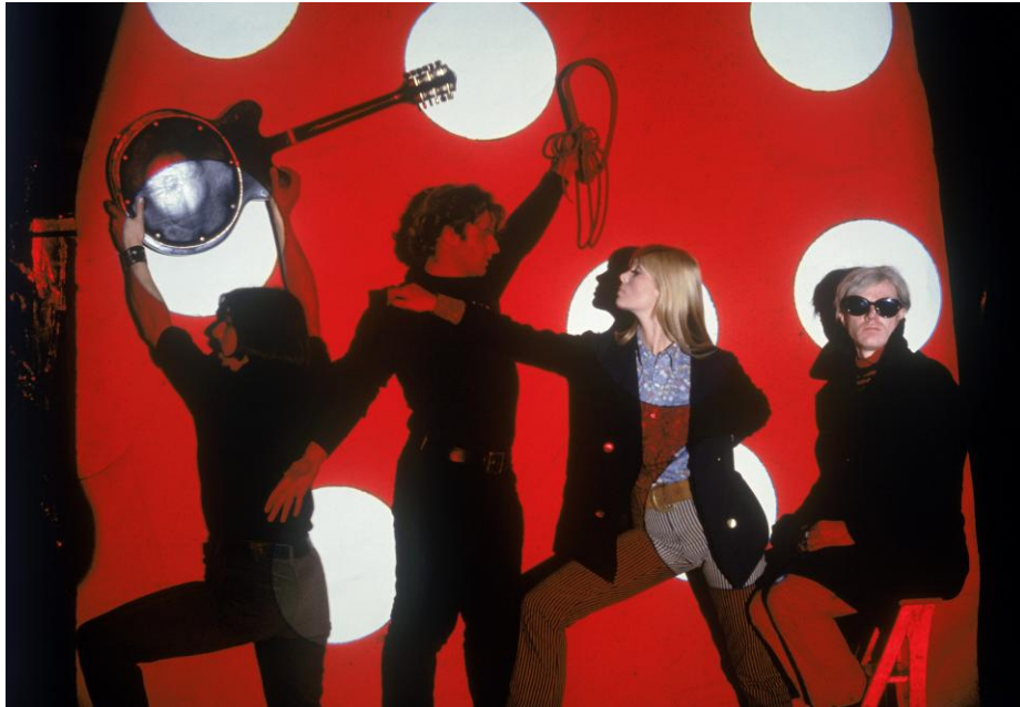
« Andy Warhol et le Velvet underground 1966 »