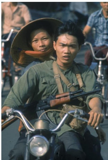
« Ho Chi Minh Ville, 1975 »

Je ne crois pas aux miracles, mais les miracles existent en photographie ! Comme, par exemple, cette photographie :