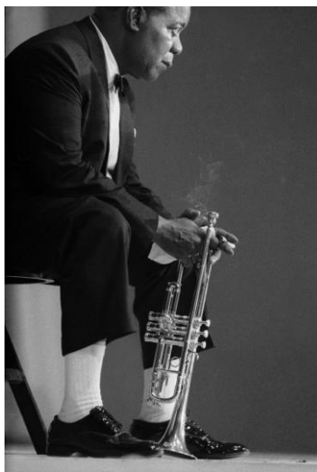
« Louis Armstrong, Paris, 1965 »

A vingt ans, sans savoir une note de musique, j'ai joué dans un orchestre de Jazz pour la saison d'été au Casino de la Conchée à Paramé près de Saint Malo. Cet orchestre a représenté ensuite les étudiants Bretons au festival international de Strasbourg en 1958.