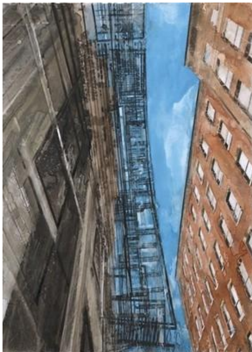
Gottfried Salzmann – Escalier de secours II – Aquarelle sur papier - 73,5 x 53,5 cm