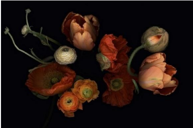
Luzia Simons - Stockage 191 - Diasec on aludibond - 140 x 200 cm