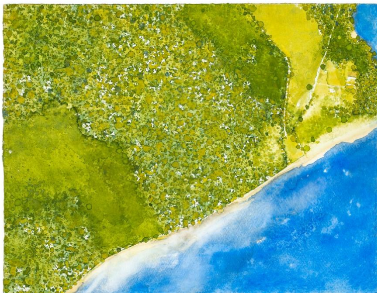
Gottfried Salzmann - bords de lac - Aquarelle sur papier - 68,3 x 52,8 cm

Cette étape a confirmé que l'aquarelle, loin d'être confinée à une tradition, occupe une place centrale dans la création contemporaine. Salzmann en fait un langage universel, capable d'exprimer la densité du monde et l'éphémère de la lumière.