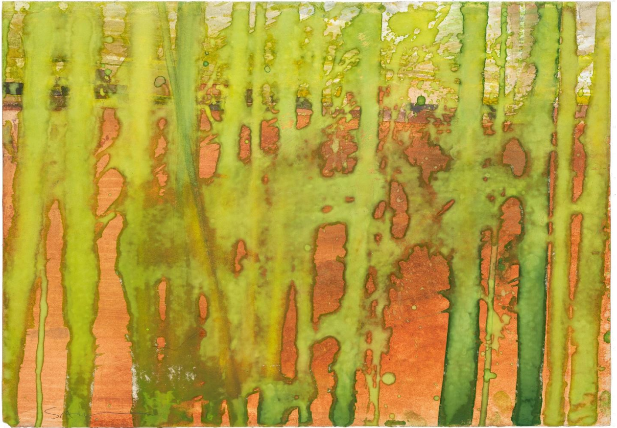
A travers - aquarelle sur papier - 32,5 x 50 cm