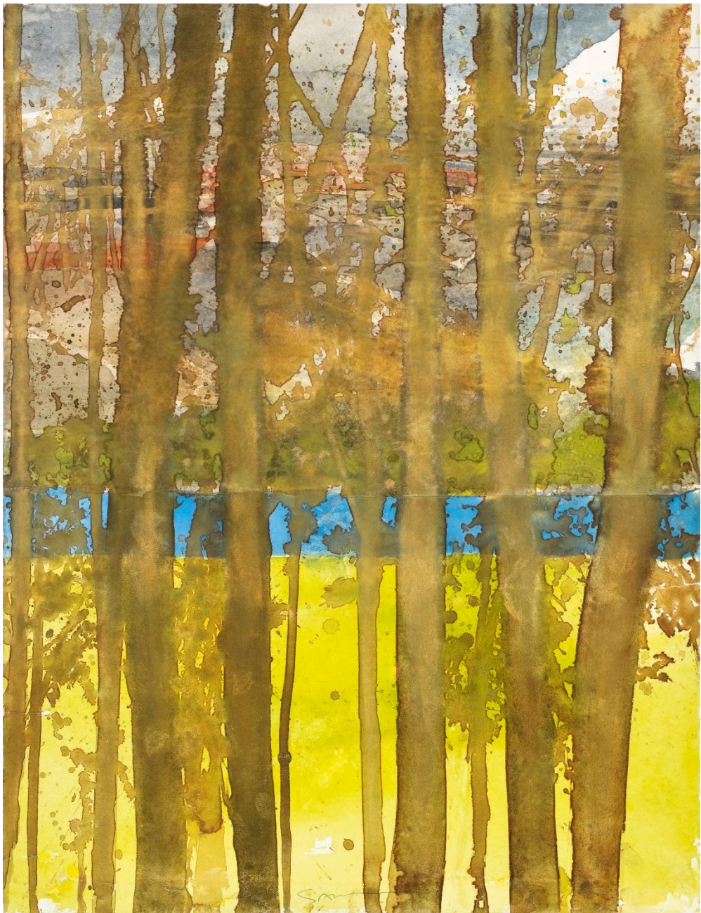
La rivière - aquarelle sur papier - 65,2 x 49,9 cm