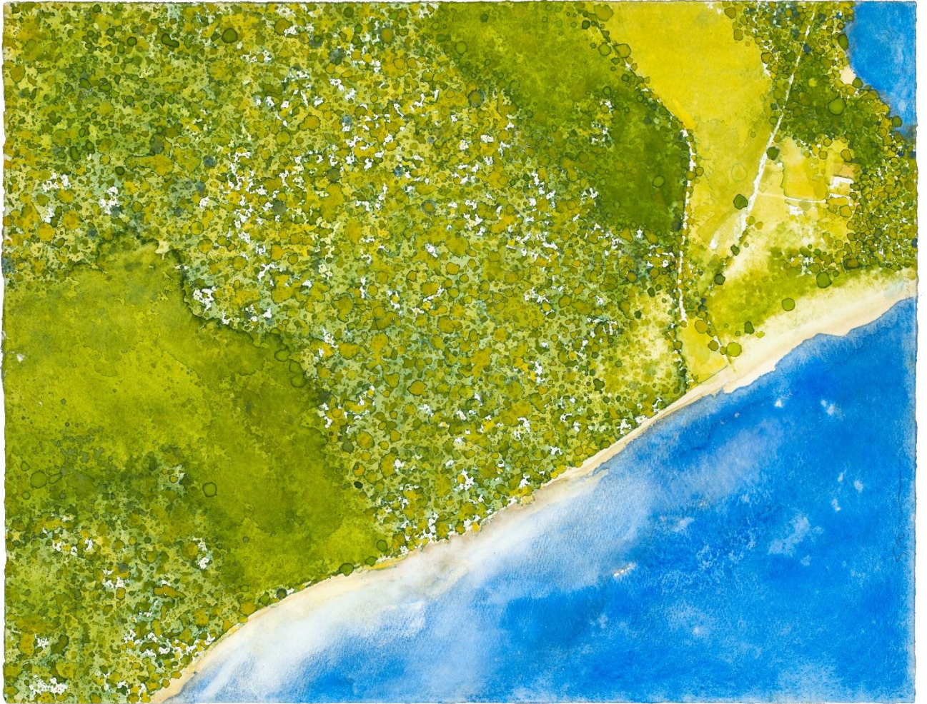
Bords de lac - aquarelle sur papier - 68,3 x 52,8 cm