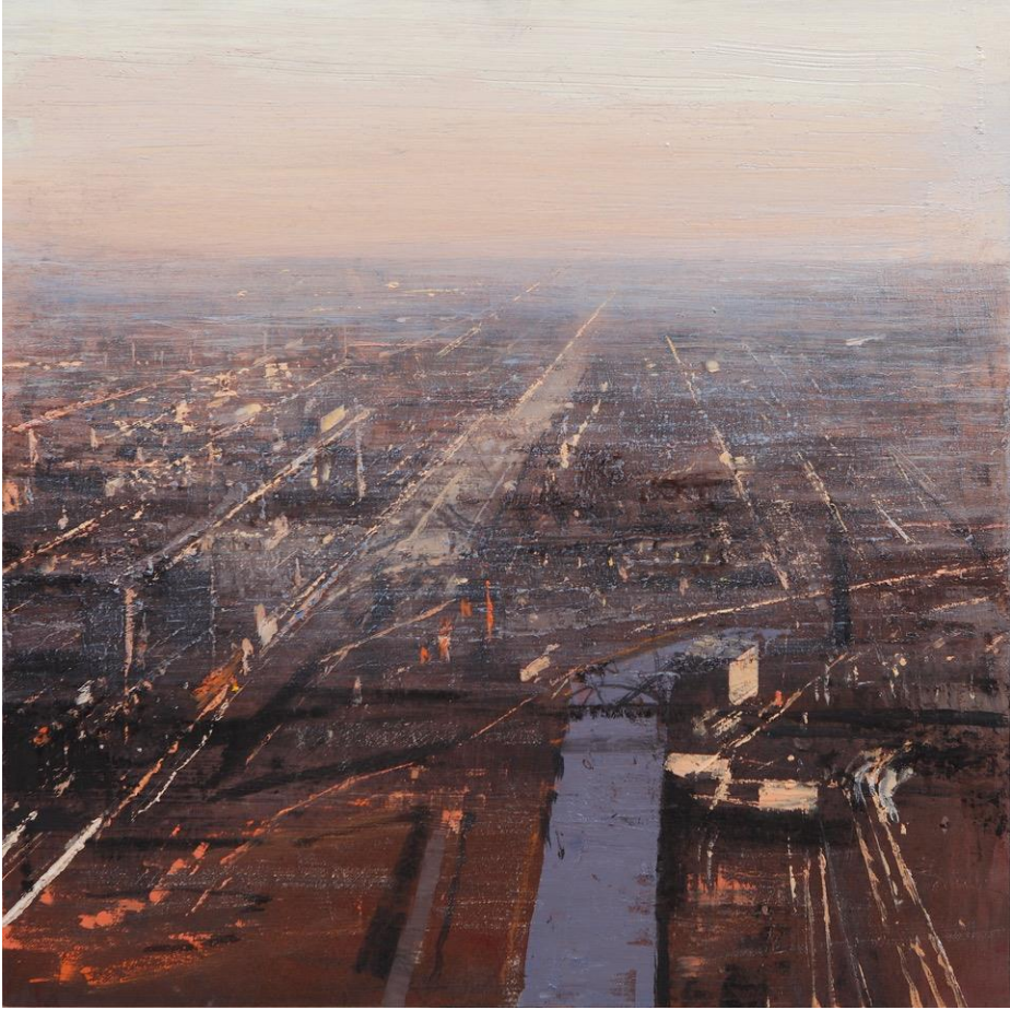
Aterdecer en Chicago - 2023 Oil on wood - 40 x 40 cm