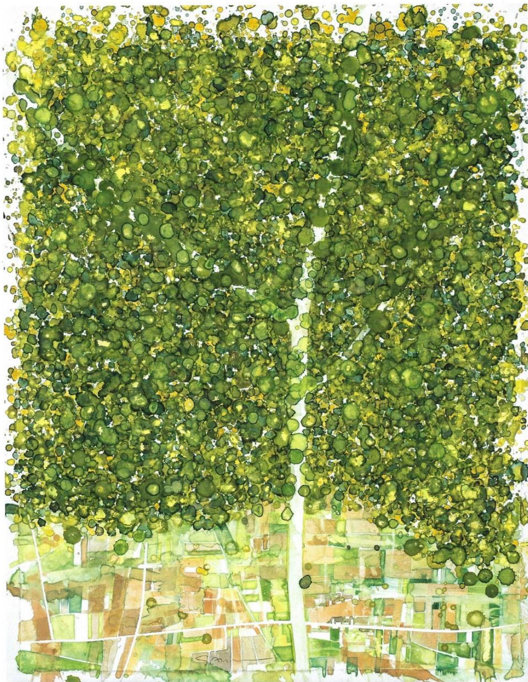
La route, aquarelle sur papier, 64,7 cm x 50,2 cm, 2023