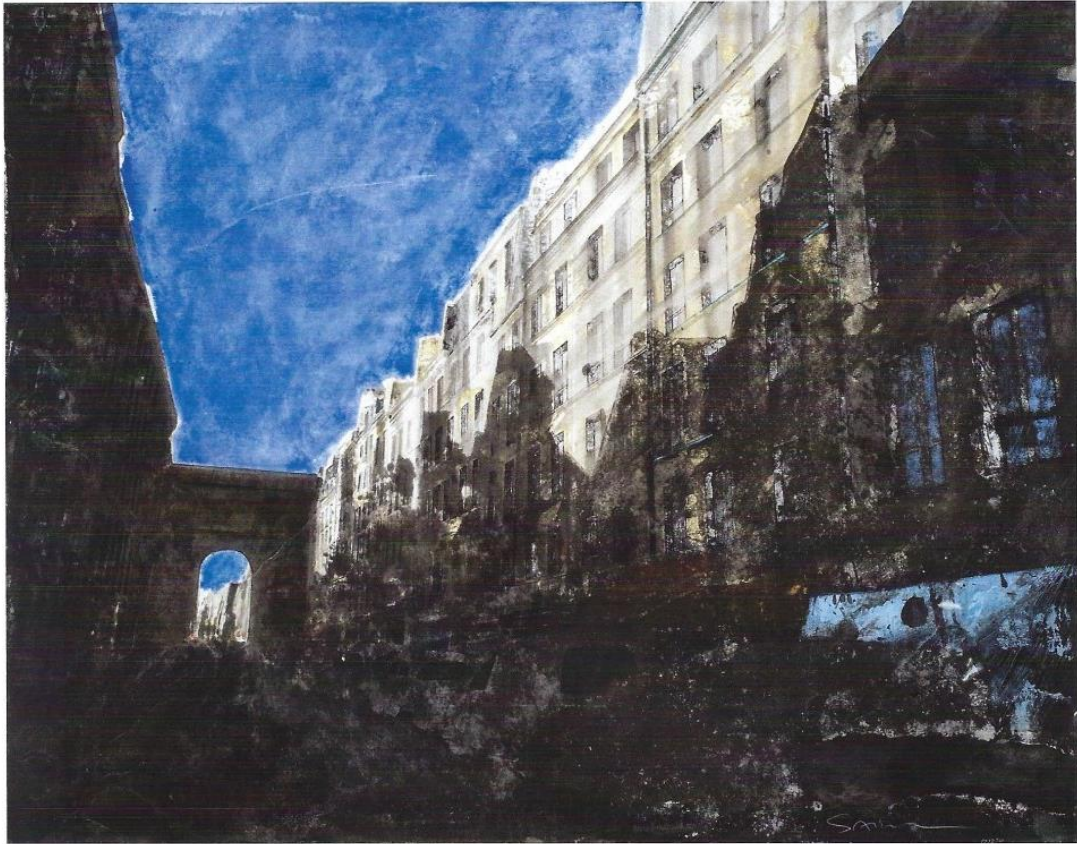
Porte Saint-Denis - Ombre, aquarelle sur papier, 2010, , 51.9 x 64.9 cm Page de gauche : L'ombre, aquarelle sur papier, 2004, 50.3 x 64.9 cm