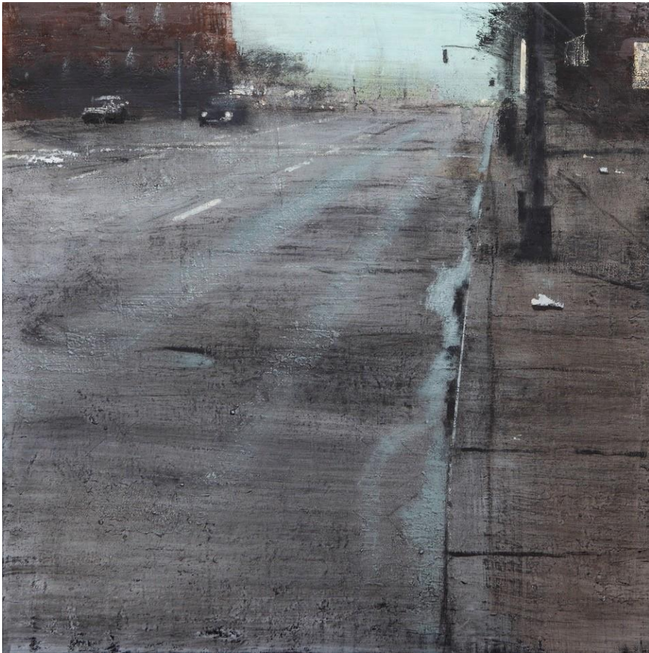
Calle mollada ,2023 Huile sur bois 60 x 60 cm