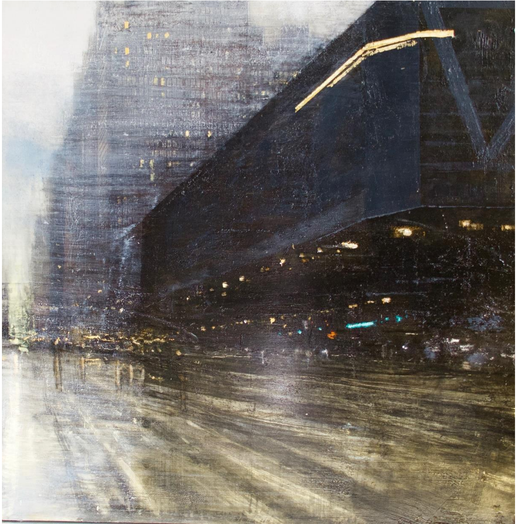
The bus station, 2023 Huile sur bois – 85 x 85 cm