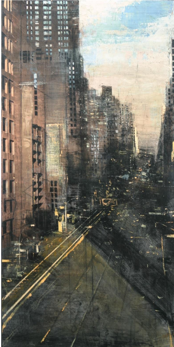
Luces y sombras, Huile sur bois - 140 x 70 cm