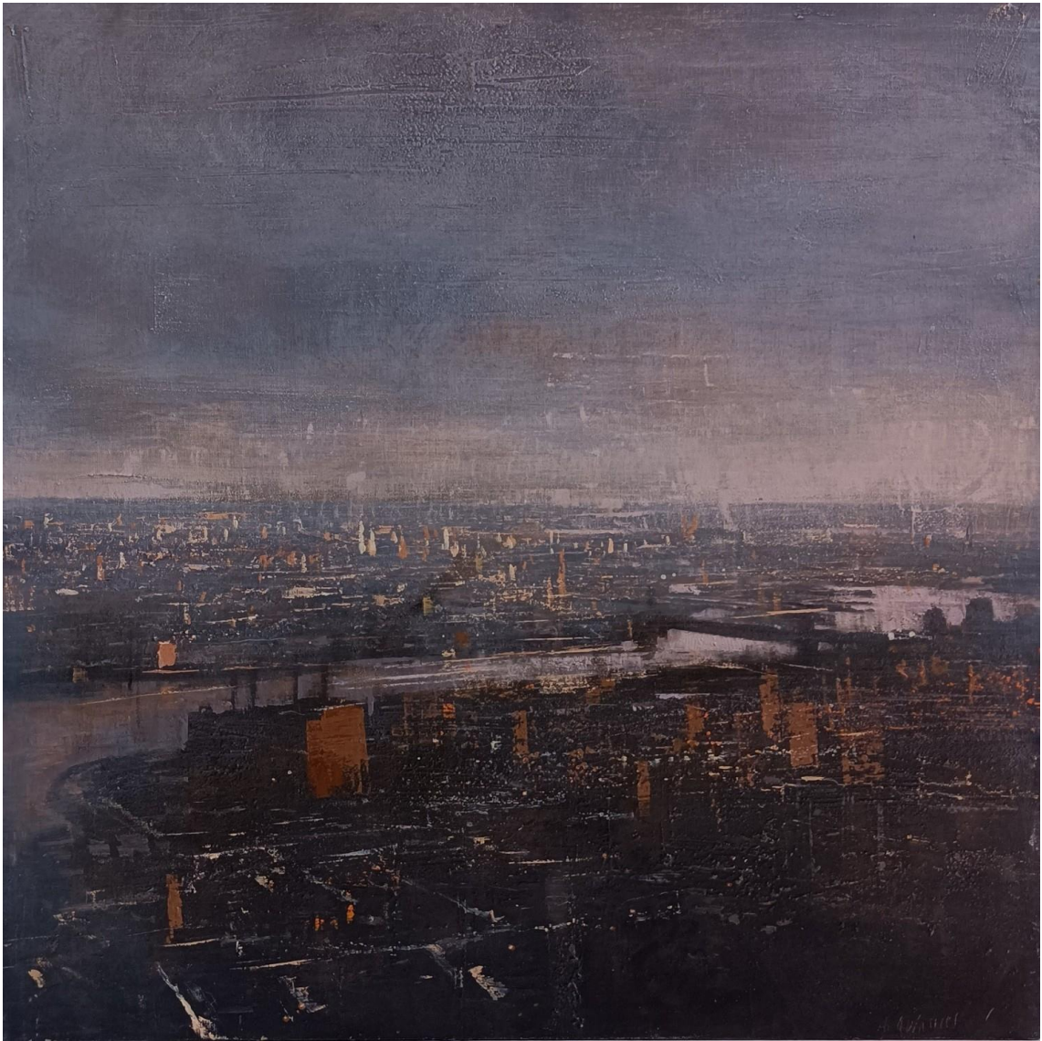
La fabrica en el East River, Huile sur bois – 85 x 85 cm