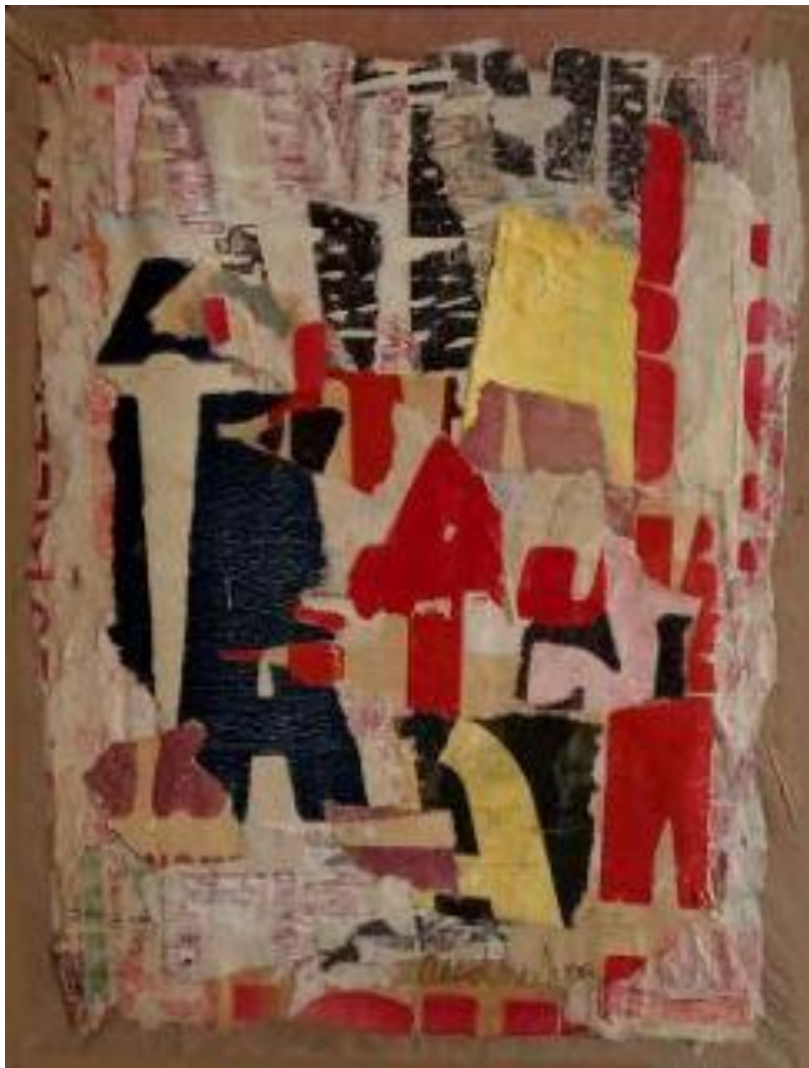
Arthur Aeschbacher - « Bec de Corbin » - collage affichiste 35 x 27 cm - 1963