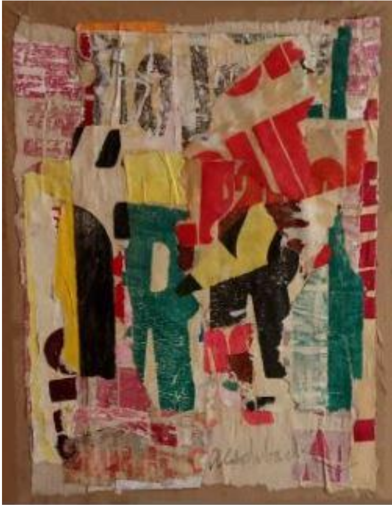
Arthur Aeschbacher – « Castagné » - collage affichiste 35 x 27 cm - 1960