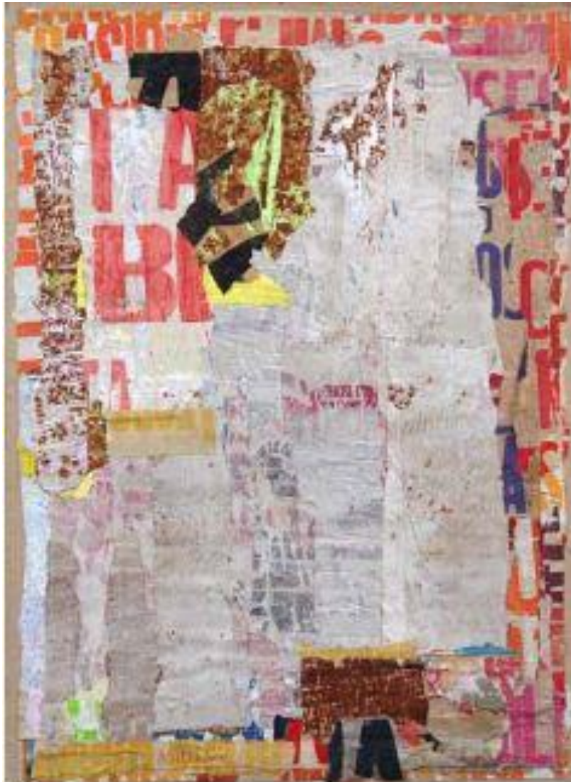
Arthur Aeschbacher – « Lettre pince d'Aplomb » collage affichiste - 99 x 72 cm - 1960