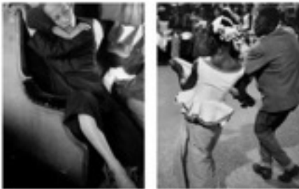
Marc RIBOUD, « De la mélancolie à la joie »

Du vendredi 4 novembre 2022 au samedi 17 décembre 2022