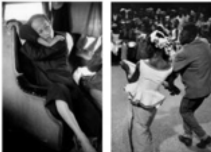
Marc RIBOUD, « De la mélancolie à la joie » Exposition pour le centenaire de sa naissance