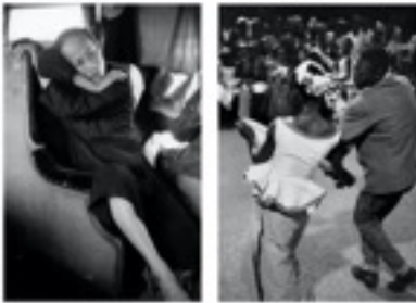
Marc RIBOUD, « De la mélancolie à la joie » Exposition pour le centenaire de sa naissance