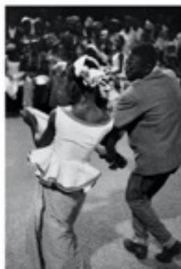
Marc RIBOUD, « De la mélancolie à la joie » Exposition pour le centenaire de sa naissance