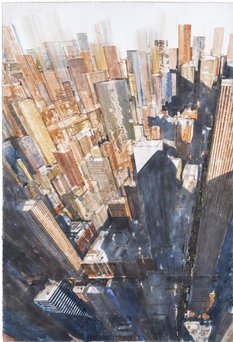
« West side II » - 2021 - Aquarelle sur papier - 107,2 x 73,5 cm