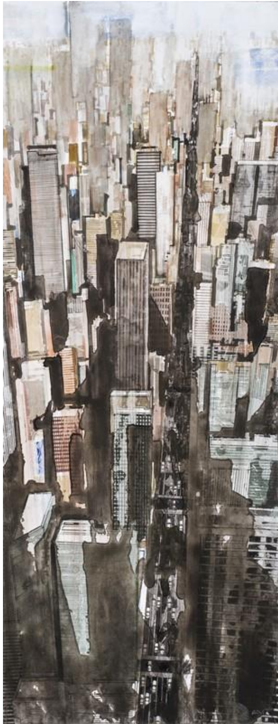
« Green corner » - 2021 - Aquarelle sur papier - 60,3 x 19,3 cm