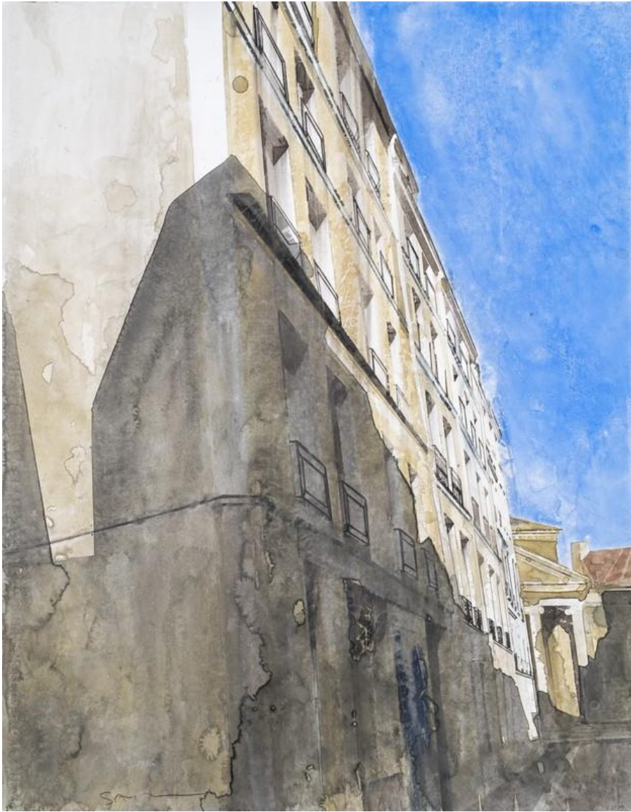
« Rue du Roi Doré » - 2019 - Aquarelle sur papier - 62,1 x 50,6 cm