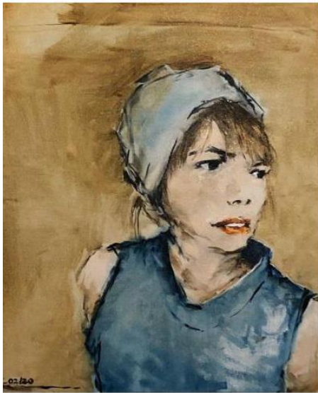
Gabriel Schmitz & Galerie Arcturus