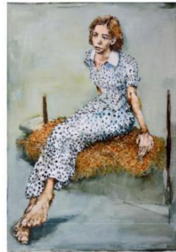
Gabriel Schmitz Femmes au lait , 2019 Galerie Arcurus €5,000 - 7,500 Contact Gallery