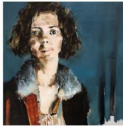
Gabriel Schmitz Carlotta , 2018 Galerie Arcurus €2,500 - 5,000 Contact Gallery