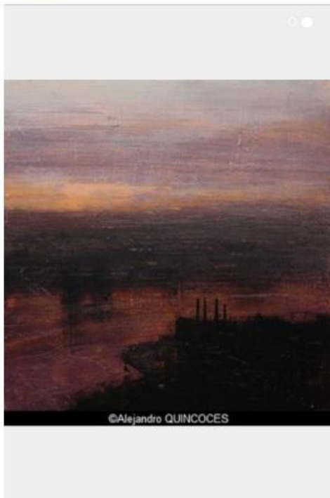
instant fugace en un moment éternel.

Dans la lignée de sa prédilection pour la peinture contemporaine espagnole développée depuis 20 ans, la Galerie ARCTURUS est heureuse de présenter la quatrième exposition personnelle à Paris du peintre Alejandro QUINCOCES.