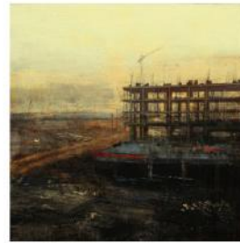
ALEJANDRO QUINCOES Edificios abandonados, 2016 Galerie Arcturus €7,500 - 10,000 Contact Gallery