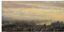
ALEJANDRO QUINCOES London, 2010 Galerie Arcturus €1,000 - 2,500 Contact Gallery