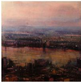
ALEJANDRO QUINCOES Amsterdam, 2015 Galerie Arcturus €7,500 - 10,000 Contact Gallery

Sep 17th - Oct 12th Paris, 65 Rue de Seine Map