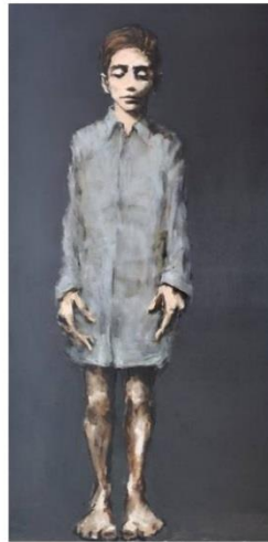
Gabriel Schmitz Nocturne , 2017 Galerie Arcturus