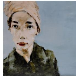
Gabriel Schmitz Mademoiselle S , 2016 Galerie Arcturus