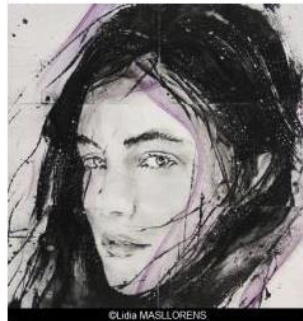
© Lidia MASLLORENS & Galerie ARCTURUS