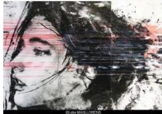
© Lidia MASLLORENS & Galerie ARCTURUS

Date Du 02/10/2018 à 14h00 au 03/11/2018 Vernissage le 02/10/2018 à 19h00