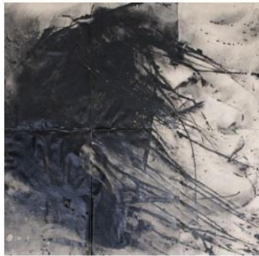
Lidia Masllorens Untitled, 2018, 2018 Galerie Arcturus