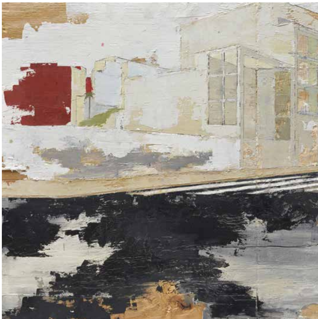
« Casa » - Huile sur bois - 60 x 60 cm