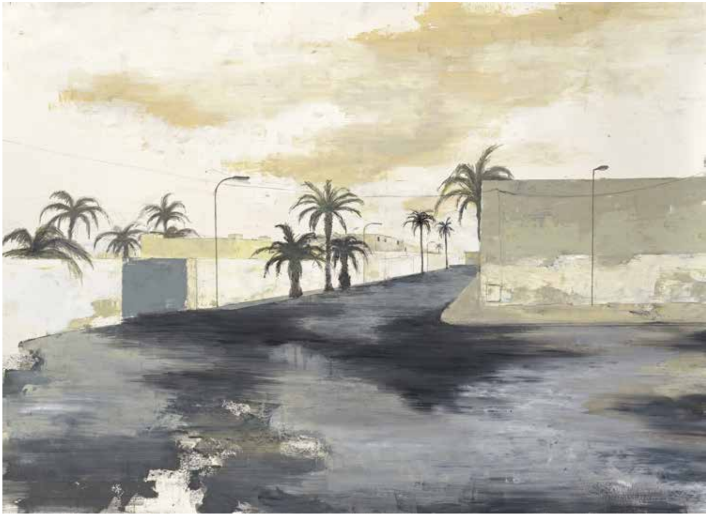
« Casa - le port » - Huile sur papier - 68 x 98 cm