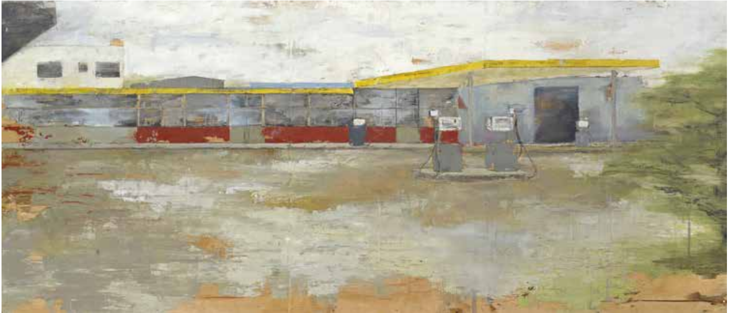
« Pompe à essence » - Huile sur bois - 60 x 147 cm