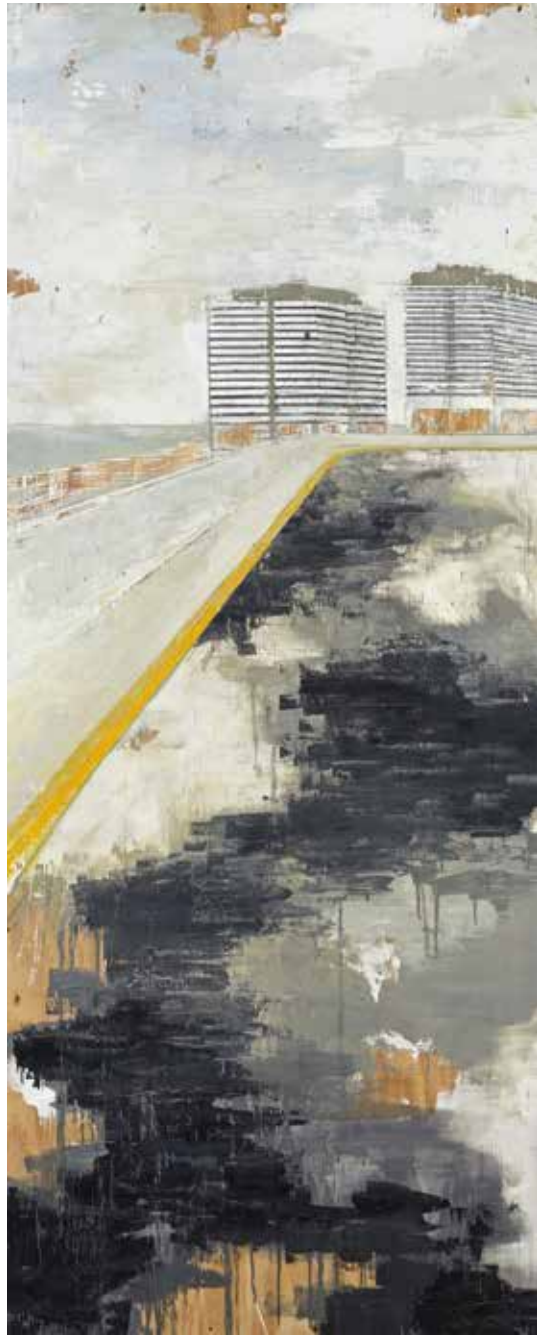
« Bord de mer Casa » - Huile sur bois - 146 x 60 cm