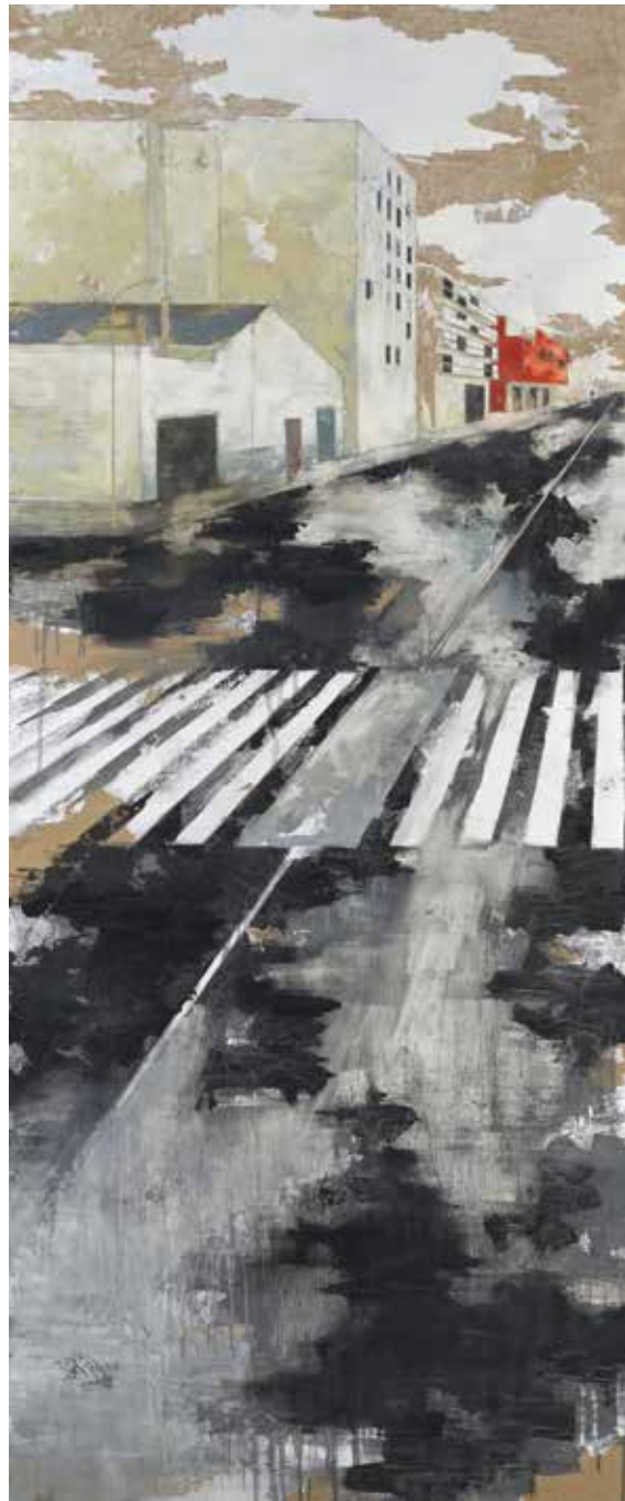
« Casa Quartiers Nord » - Huile sur bois - 180 x 77 cm