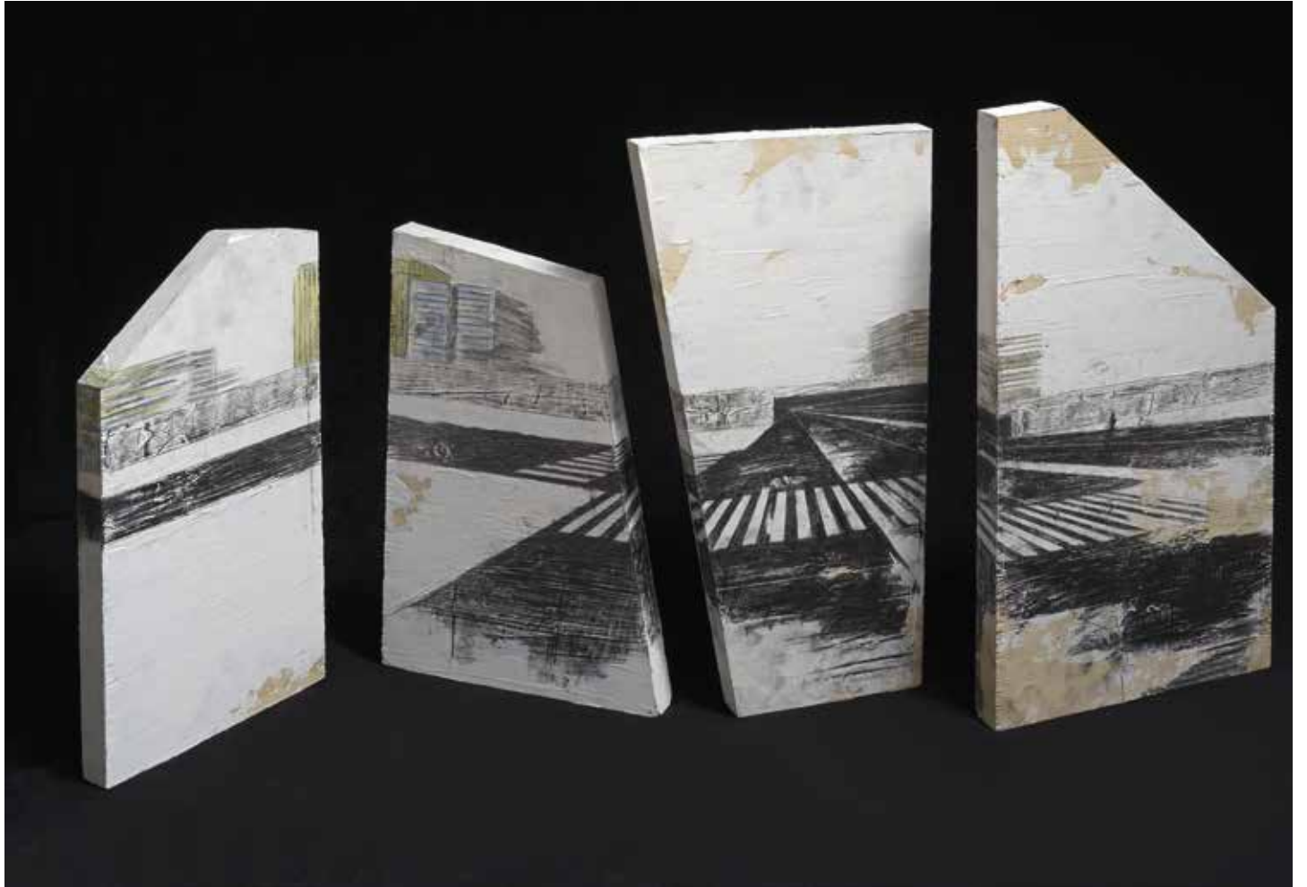
« Décomposition » - Technique mixte sur bois - 50 x 60 cm