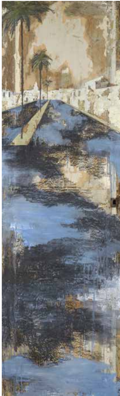
« Porte de Casa » - Bois recto verso - 200 x 60 cm