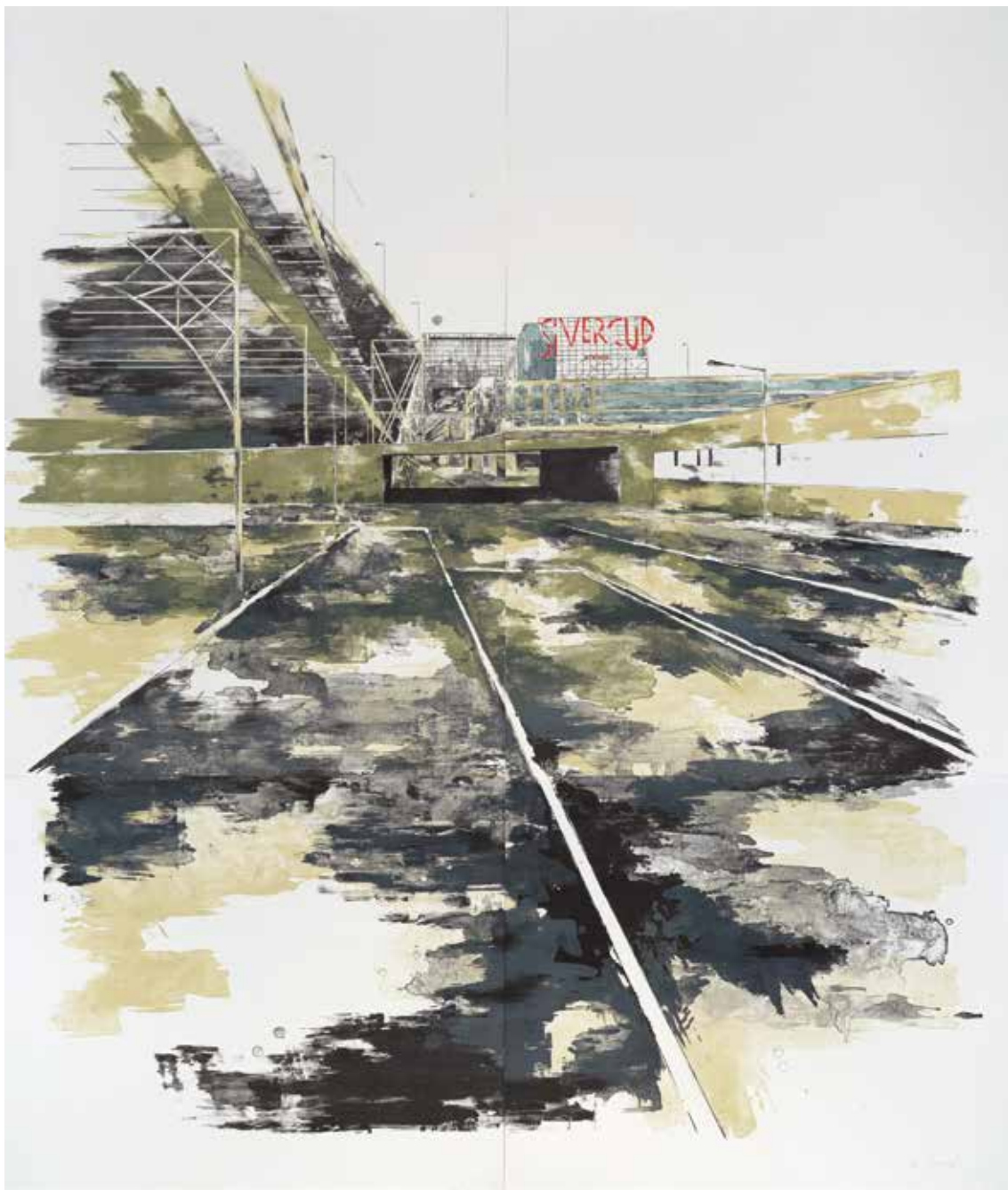
« Silvercup » - Lithographie - 200 x 180 cm