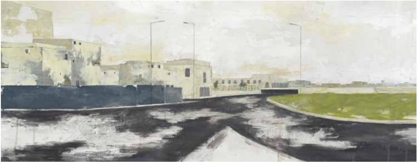
« Casa mosquée » - Huile et mine de plomb sur toile - 52 x 135 cm