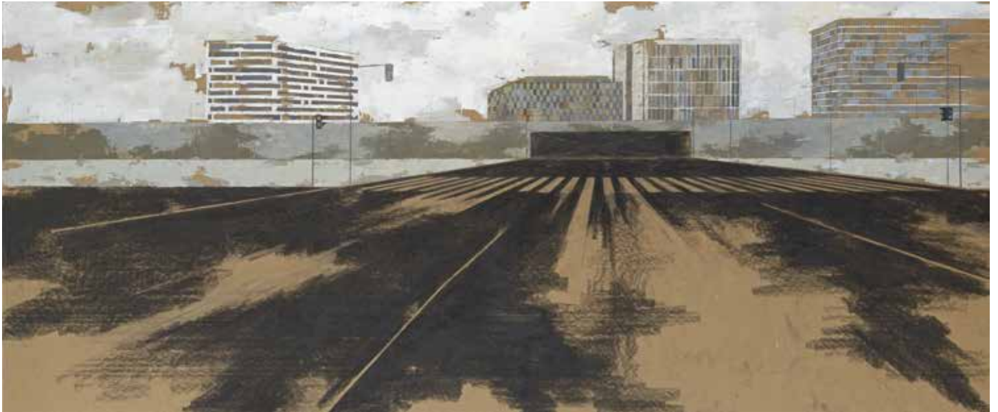
« Wien Belvedere Quartier » - Technique mixte sur bois - 75 x 180 cm