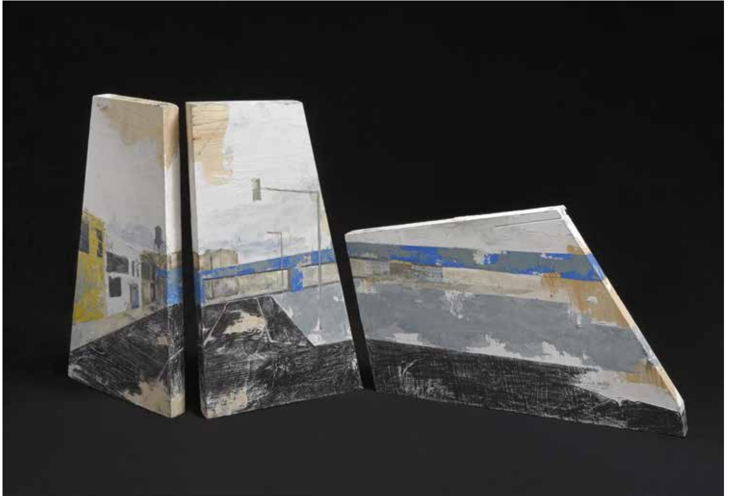
« Montréal » - Huile sur bois, triptyque - 45 x 73 cm