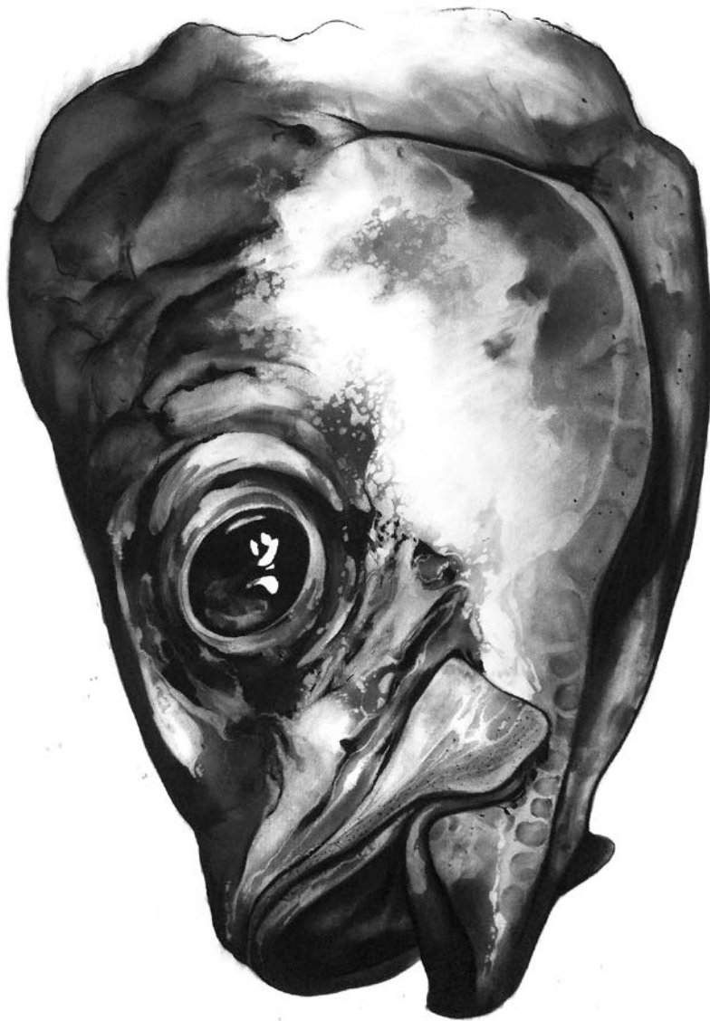
Jules RIVEMALE, Fusain, craie et pierre noire sur papier, 100 x 70 cm