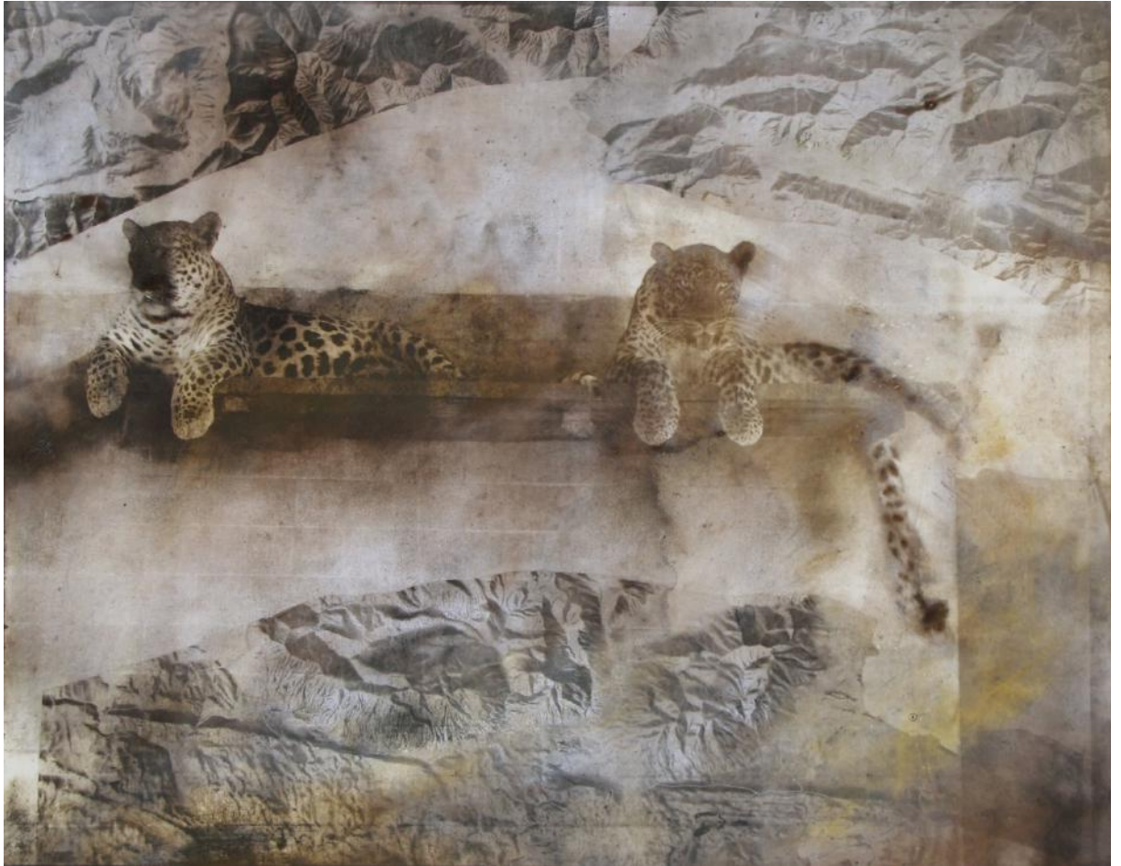
Alfons ALT, Léopardi, Altotype, 81 x 100 cm