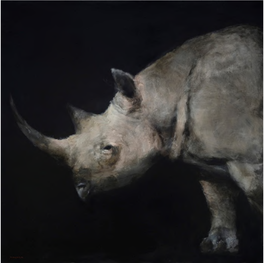
Miguel MACAYA, huile sur bois, 122 x 122 cm