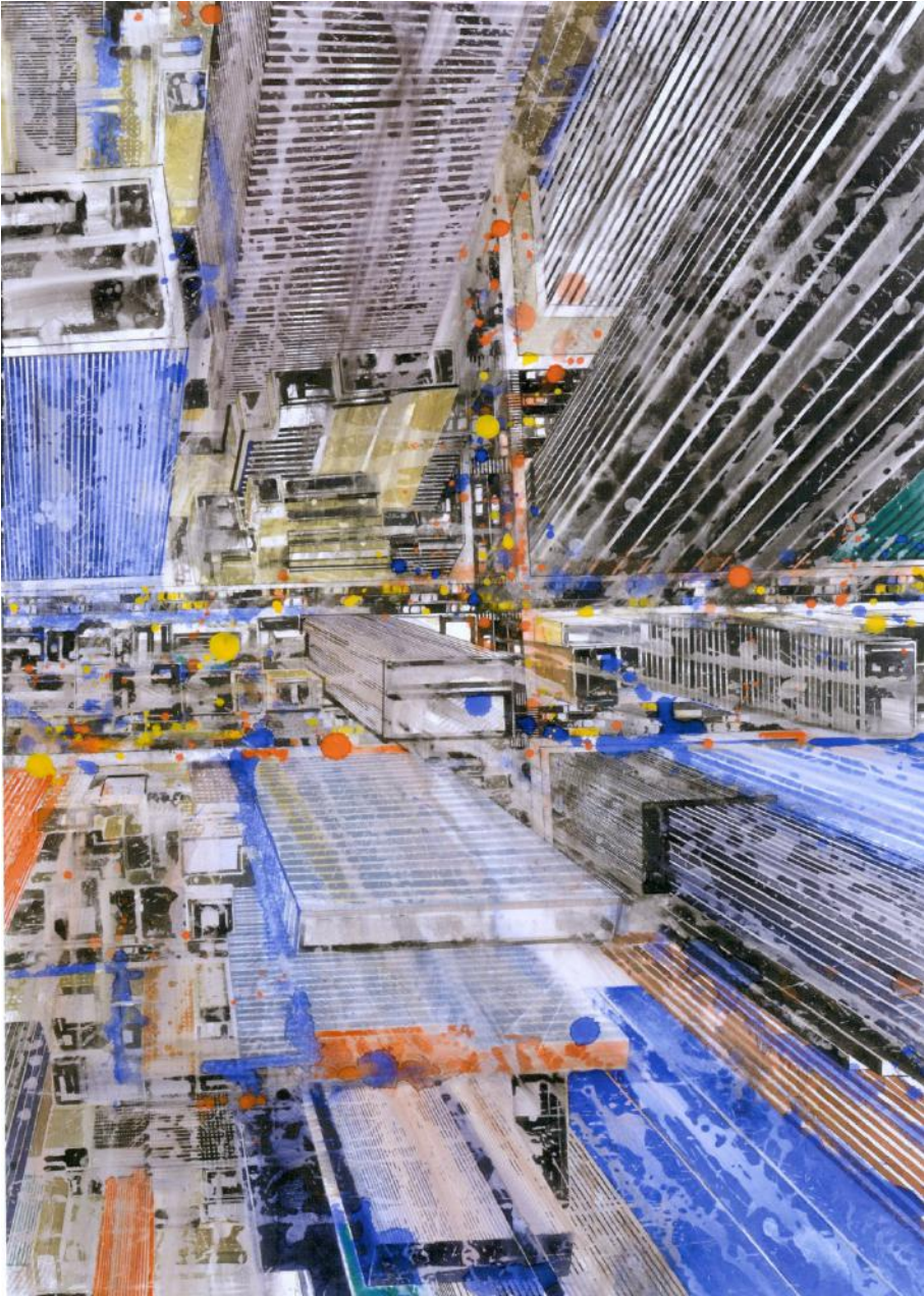
« Crossroads », Watercolor on paper , 76 x 51 cm