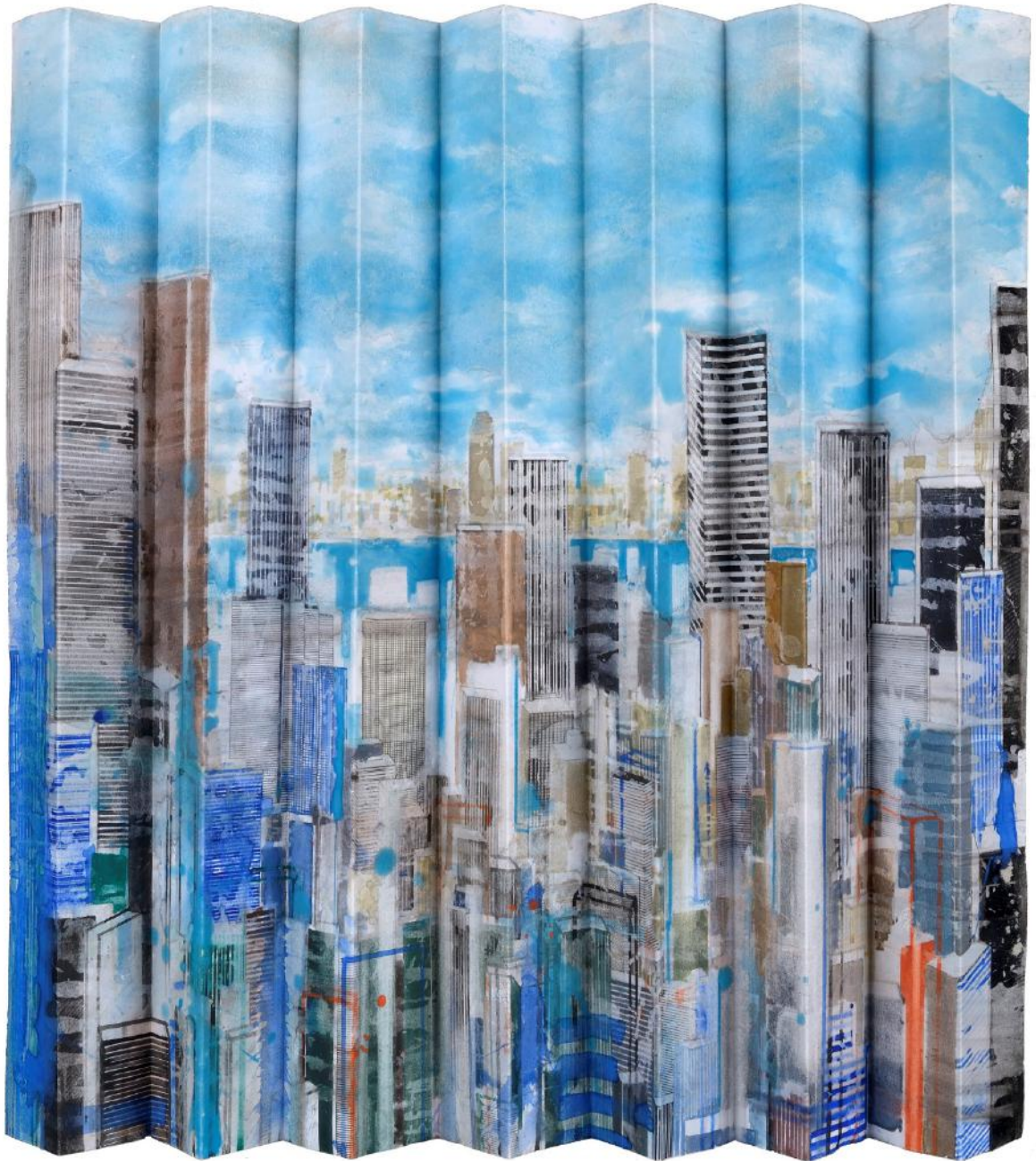
NY Folded II, Watercolor on paper 75, 8 x 110 cm