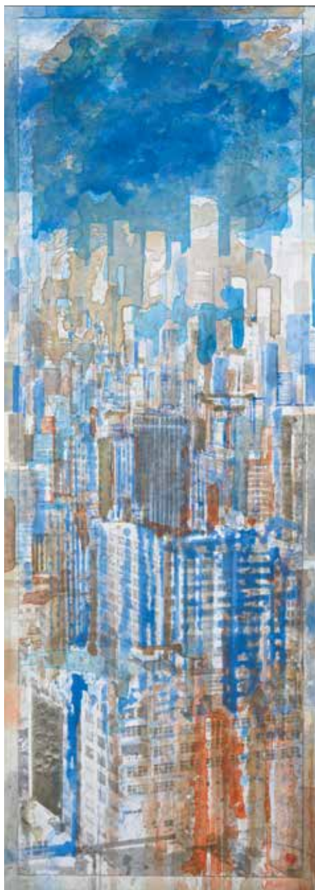
« NY Blue sky I » - Technique mixte sur photo, marouflé sur toile - 130 x 46,5 cm