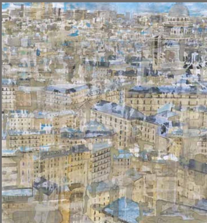
« Le Panthéon » - Aquarelle sur papier, marouflé sur bois - 33,7 x 31,7 cm

EXPOSITION DU 10 SEPTEMBRE AU 10 OCTOBRE 2015