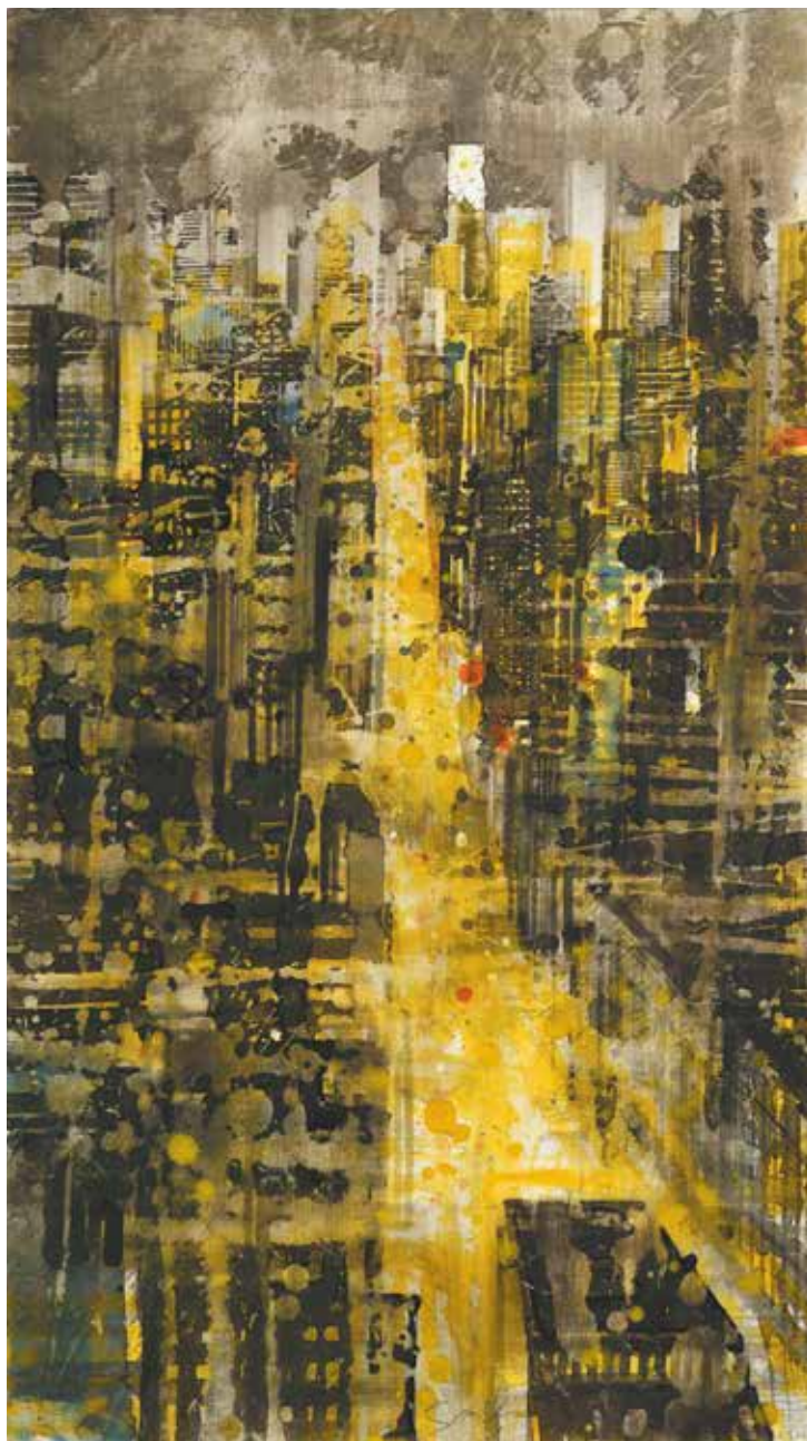
« NY at night II » - Aquarelle sur papier - 53,5 x 30,5 cm