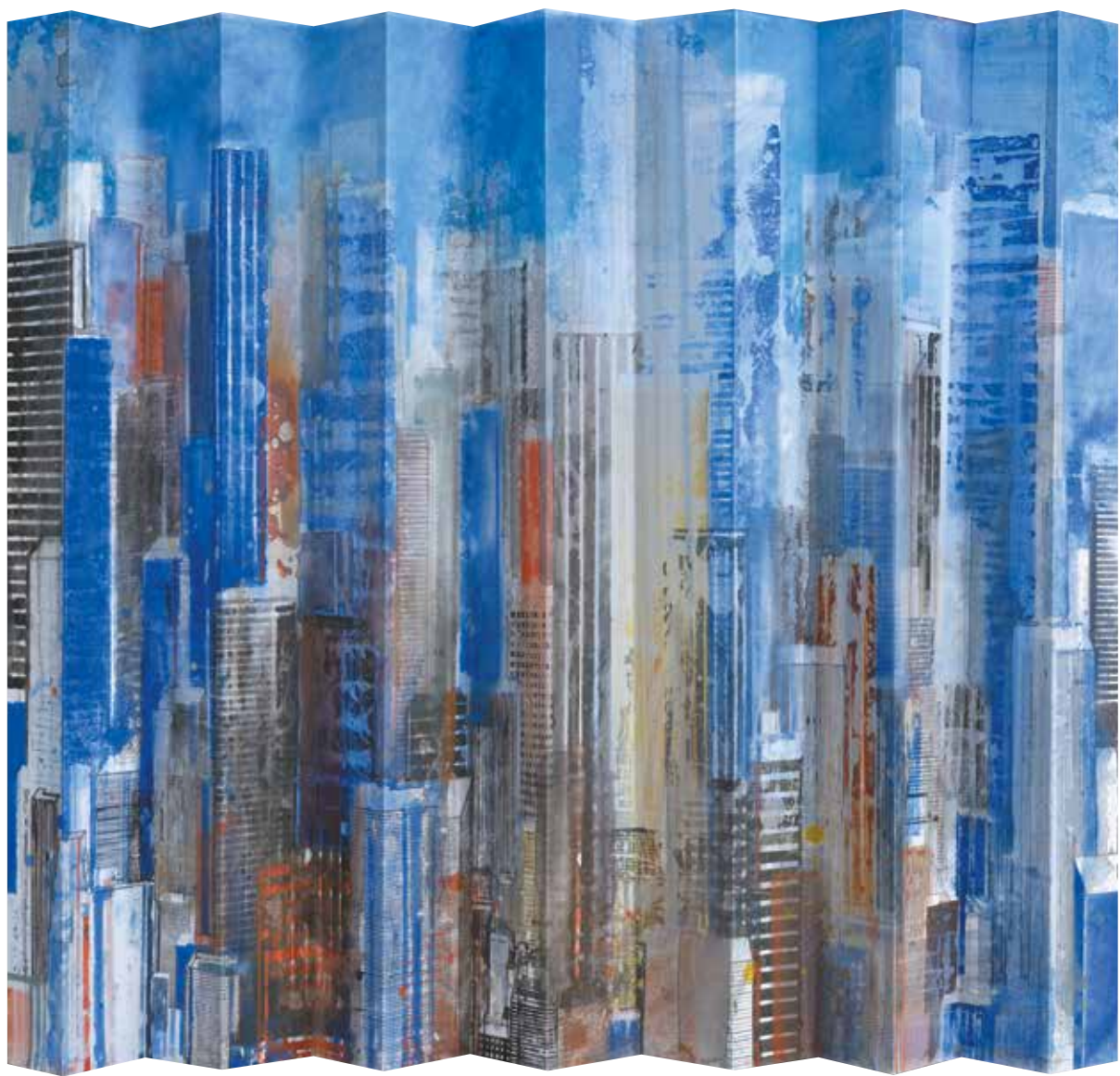
« NY folded I » - Aquarelle sur papier - 75,8 x 110 cm