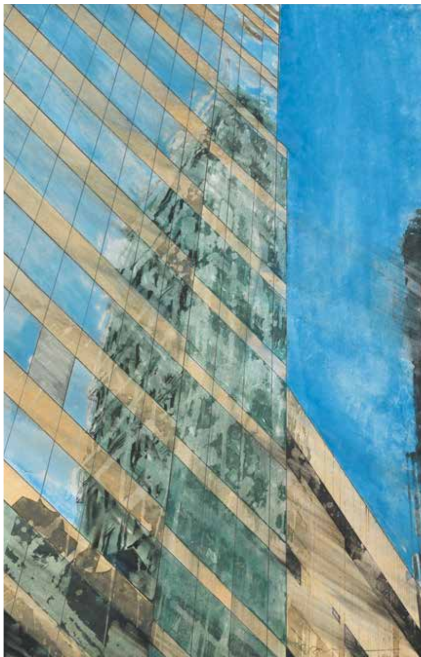
« NY Reflection I » - Aquarelle sur papier - 47 x 30 cm