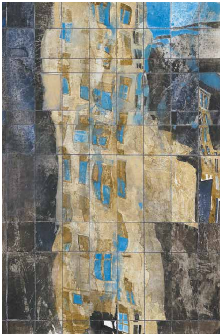
« NY Reflection II » - Aquarelle sur papier - 47 x 30 cm