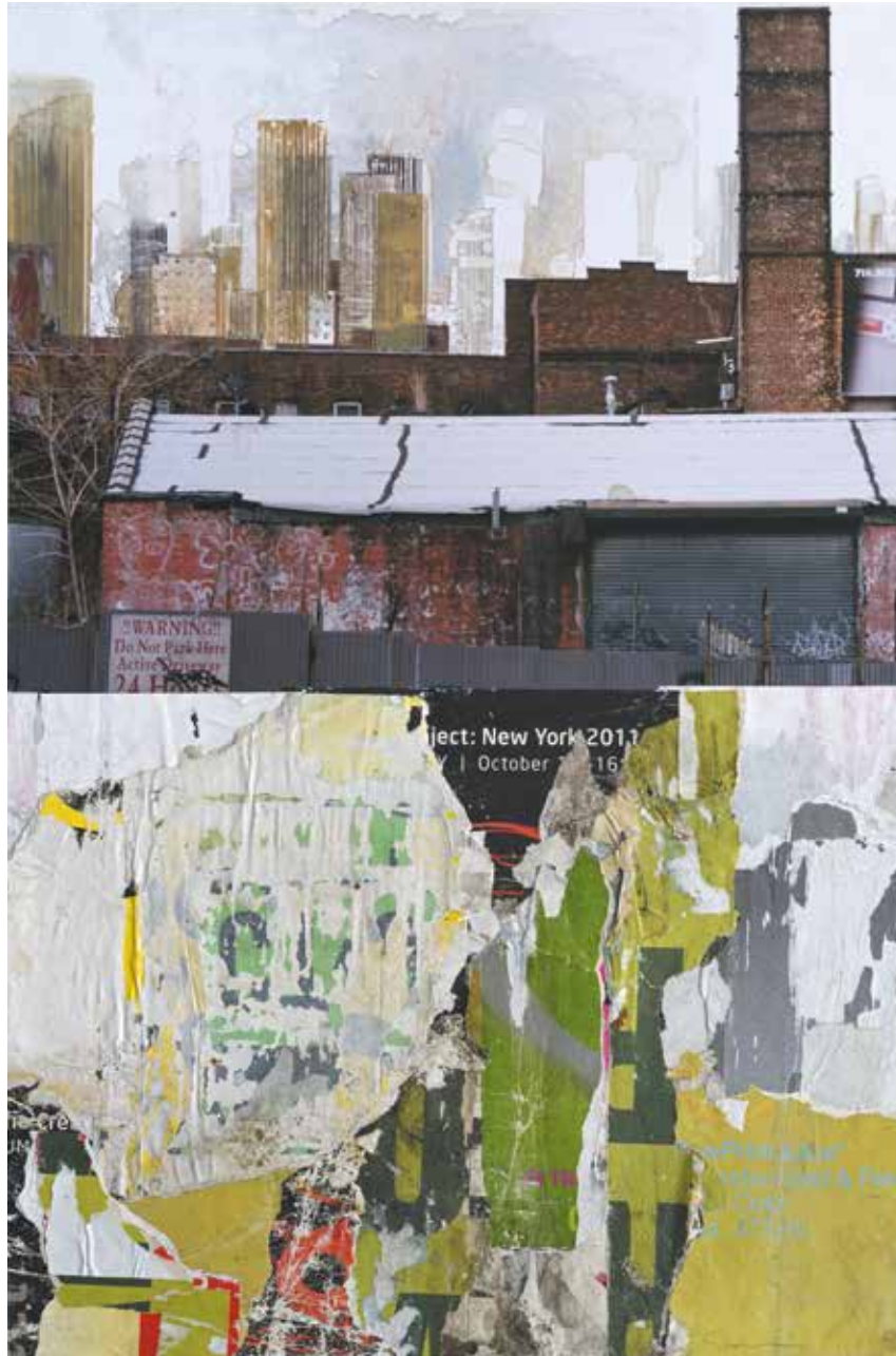
« Ject NY 2011 » - Technique mixte (photo, collages) marouflé sur bois - 81 x 54 cm