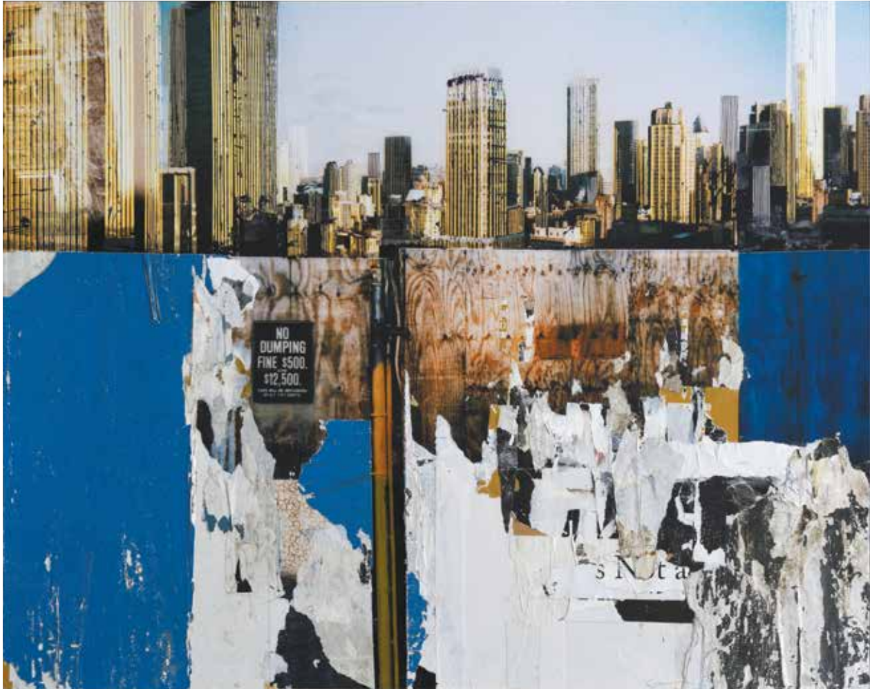
« No dumping » - Technique mixte (photo, collages) marouflé sur bois - 73 x 92 cm