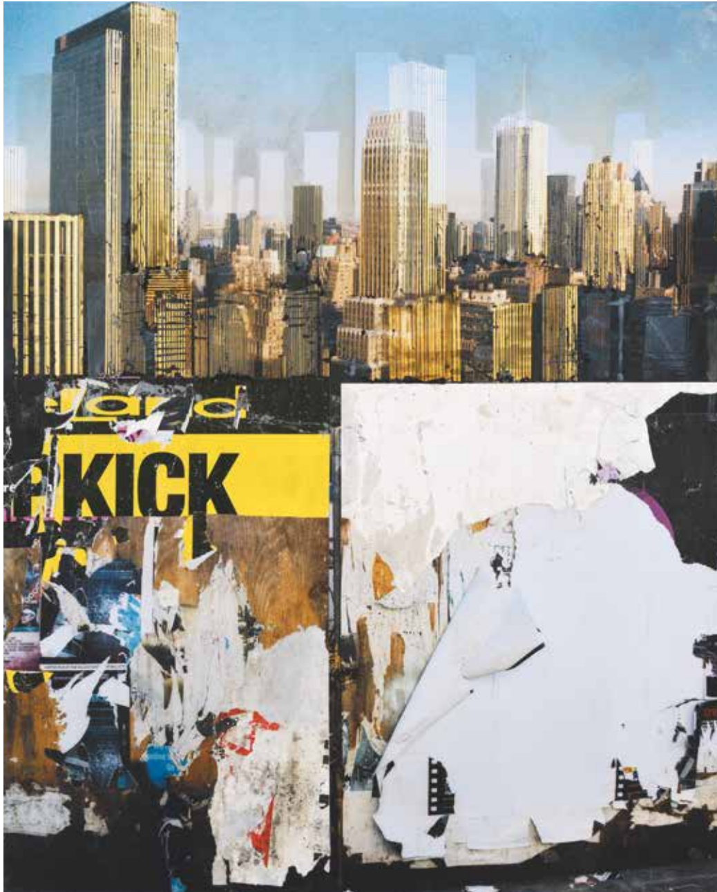
« Kick » - Technique mixte (photo, collages) marouflé sur bois - 95 x 77 cm