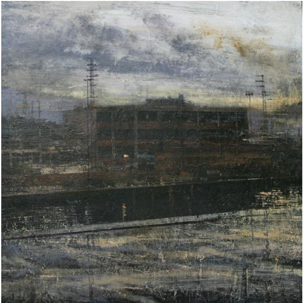
© Alejandro Quincoces, La fabrica abandonada , Huile sur bois, 85 x 85 cm

« Dans ses paysages, on perçoit la conscience stupéfiante et douloureuse de l'insignifiance de l'homme face à la grandeur tragique du scénario. A regarder la périphérie de Bilbao avec les yeux d'un Turner ou d'un Friedrich, QUINCOCES célèbre la Nature reine, maîtresse absolue, dans laquelle l'Homme est invisible mais pas absent ».