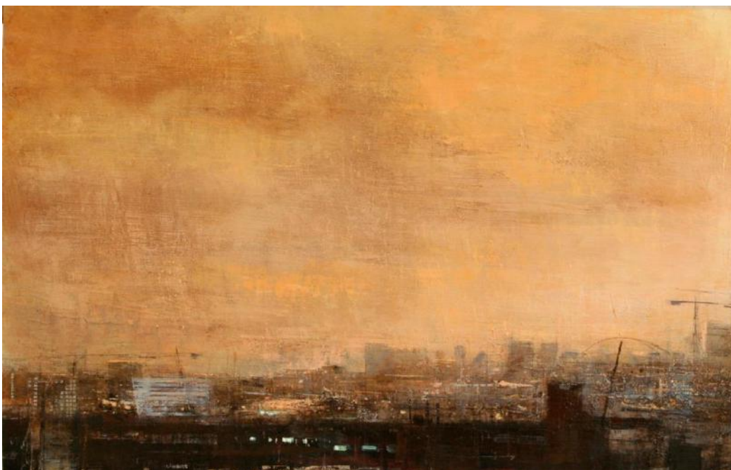
©Alejandro Quinquoces, Nubes de lluvia de oxide , Huile sur bois, 96 x 150 cm