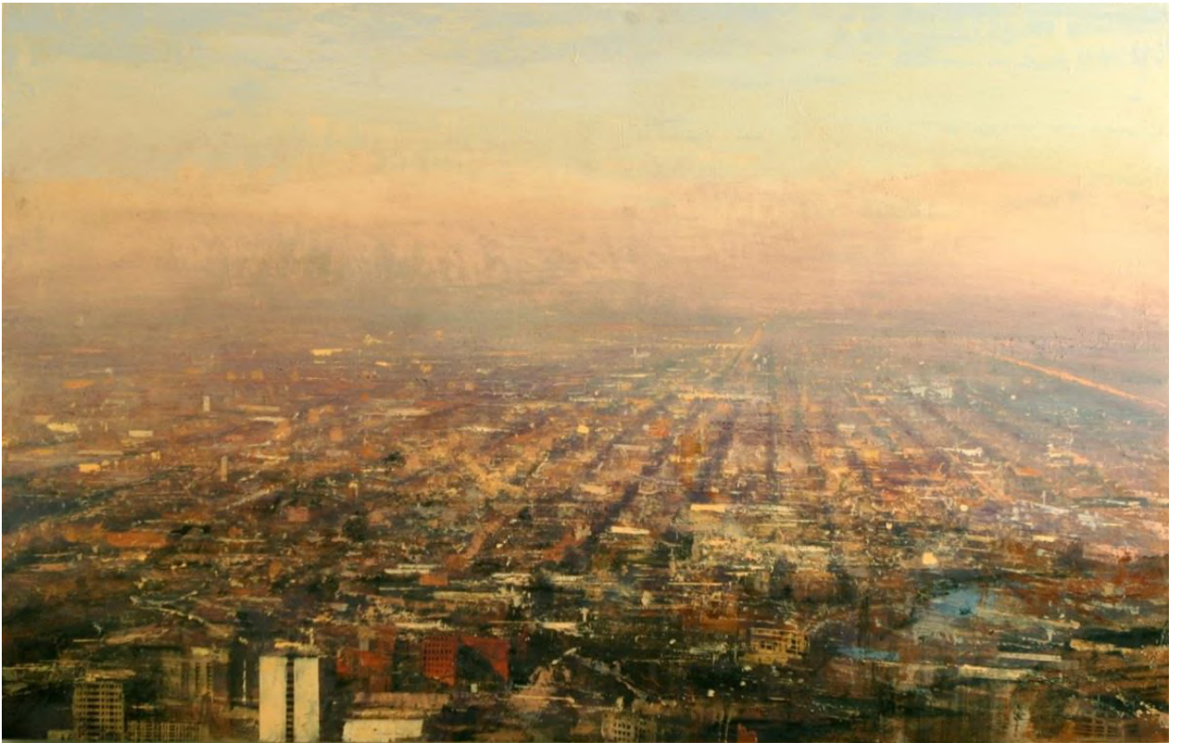
© Alejandro Quincoces, Panorámica con luz de tarde en Chicago , Huile sur bois, 96 x 150 cm