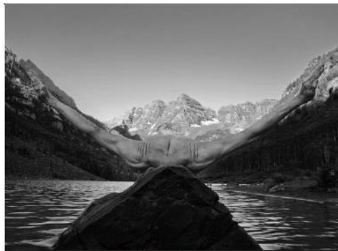
Arno Minkkinen, Maroon Beils Sunrise, 2012

À l'occasion du troisième Festival Photo Saint-Germain des Prés autour de la thématique « Visages et corps », la Galerie invite un très grand photographe Finno-Américain, Rafael Arno Minkkinen, qui depuis les années 70 réalise des autoportraits en noir et blanc où son corps s'intègre dans la nature, souvent dans des situations improbables.