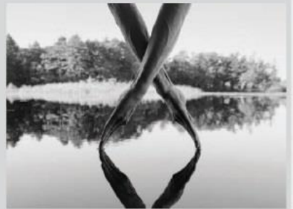
Arno Minkkinen, Autoportrait , 10.10.10, Fosters Pond, 2010, tirage argentique

Accrochage des artistes de la galerie, 3 > 21 décembre