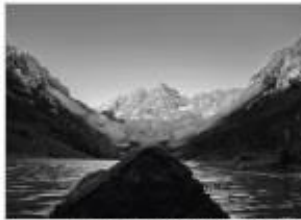
Rafael Arno MINKKINEN ©

La Galerie Arcturus exposera les œuvres de Rafael Arno MINKKINEN du 6 novembre au 30 novembre 2013. Le vernissage aura lieu le mercredi 6 novembre entre 18h et 22h.