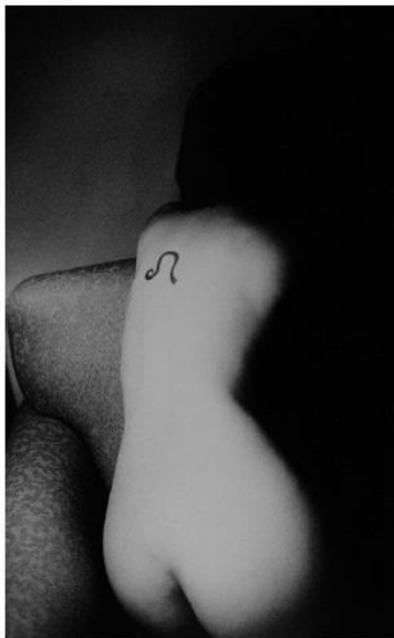
Photo St-Germain-des-Prés

This third edition of the Festival photo will run from november-6 th to the 23 rd and the theme is « Visages et corps » (« Faces and bodies »).