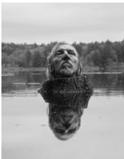
Fosters Pond, 2013

The third edition of the photo festival in Saint-Germain-des-Près ( http://www.photo-saintgermaindespres.com/ ) will take place from November 6 to November 23, 2013. It will present a unique photographic journey around roughly forty places in the sixth arrondissement of Paris, based on the theme ' Visages et Corps ' ( http://www.photo-saintgermaindespres.com/ ) (Faces and Bodies).