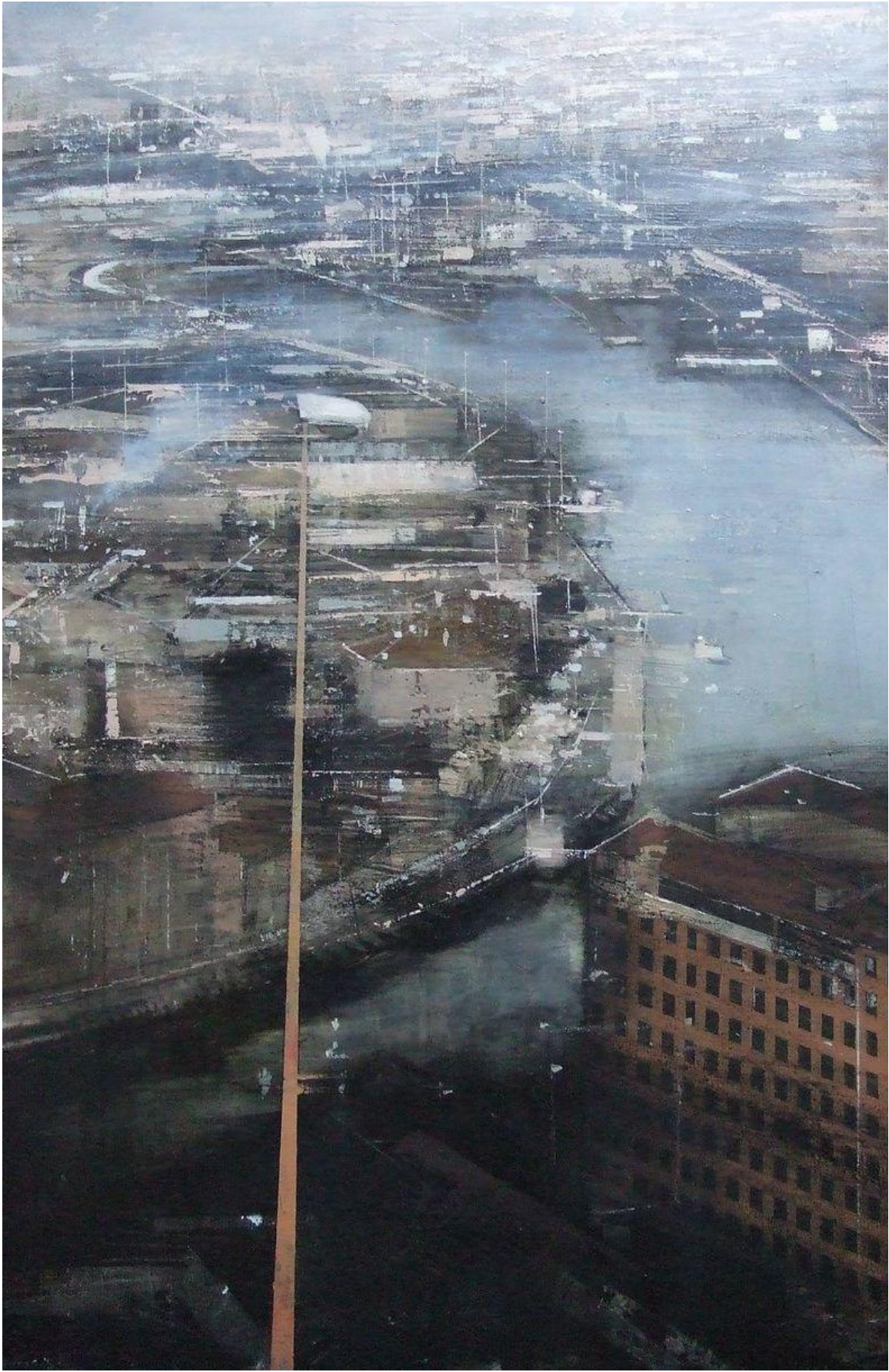
Huile sur bois, 80 x 40 cm, 2010