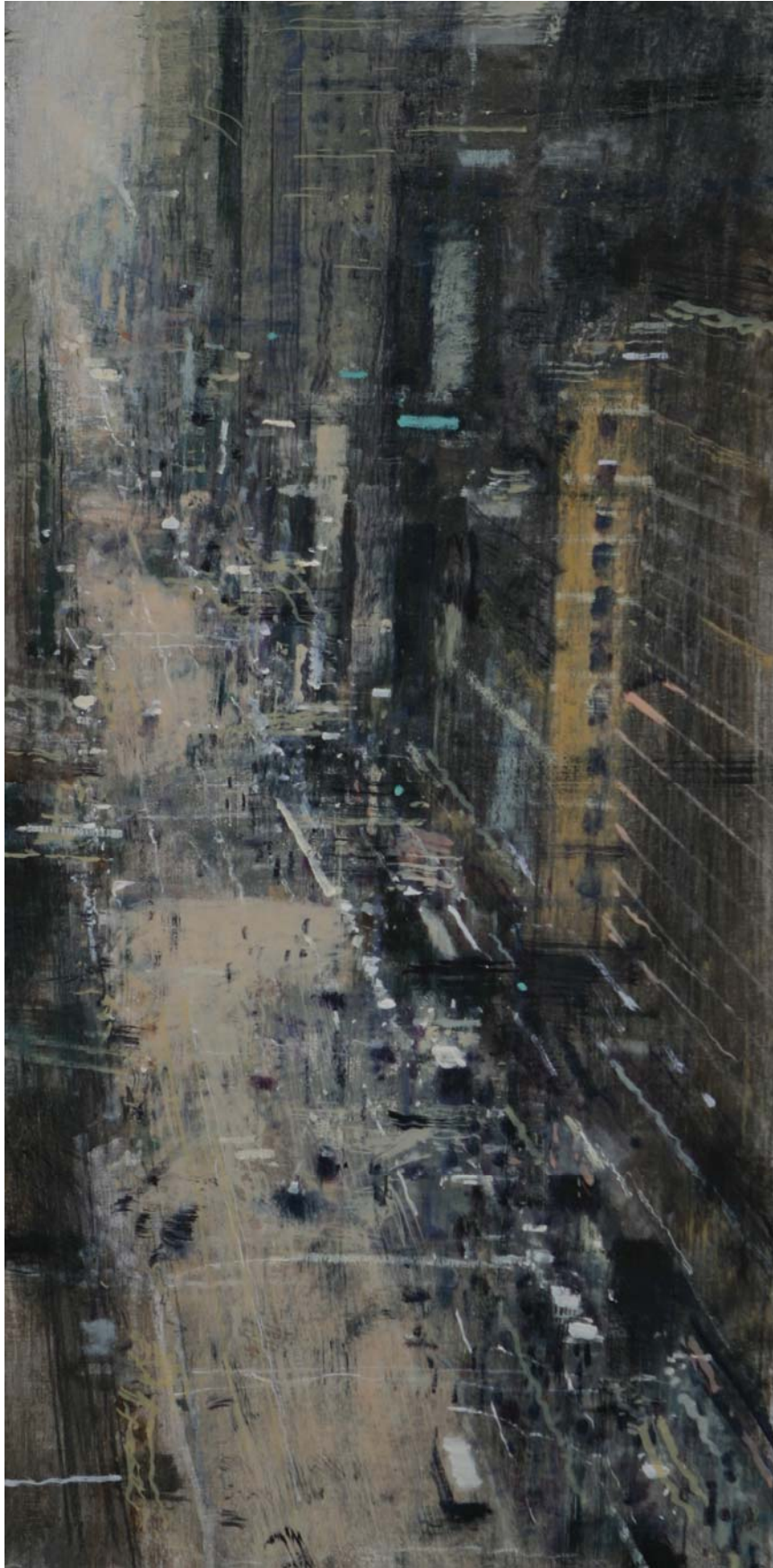
Huile sur bois, 60 x 30 cm, 2011