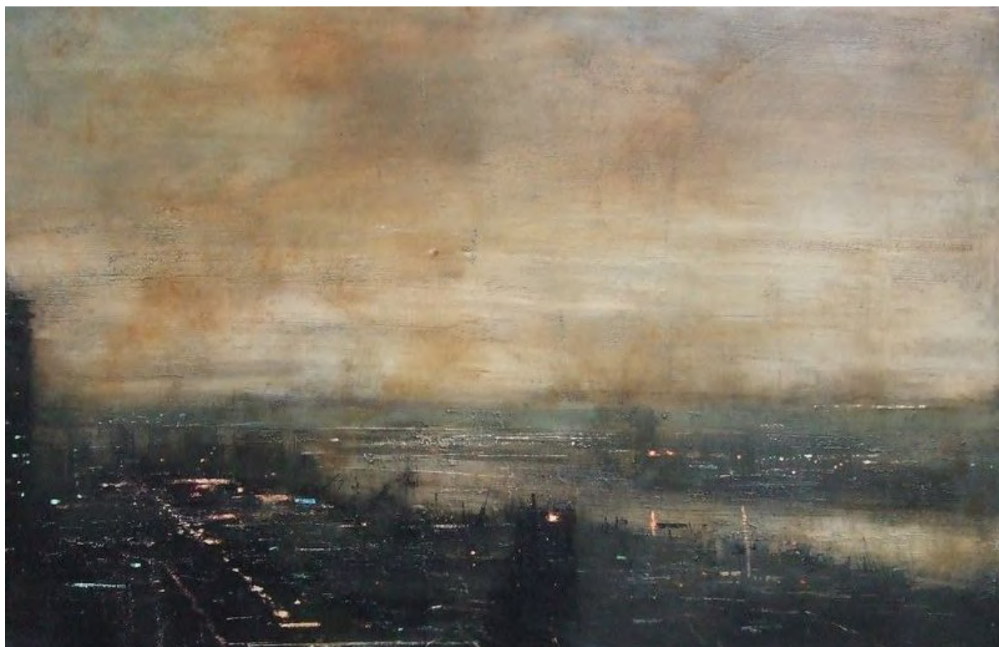
Huile sur bois, 100 x 150 cm, 2010