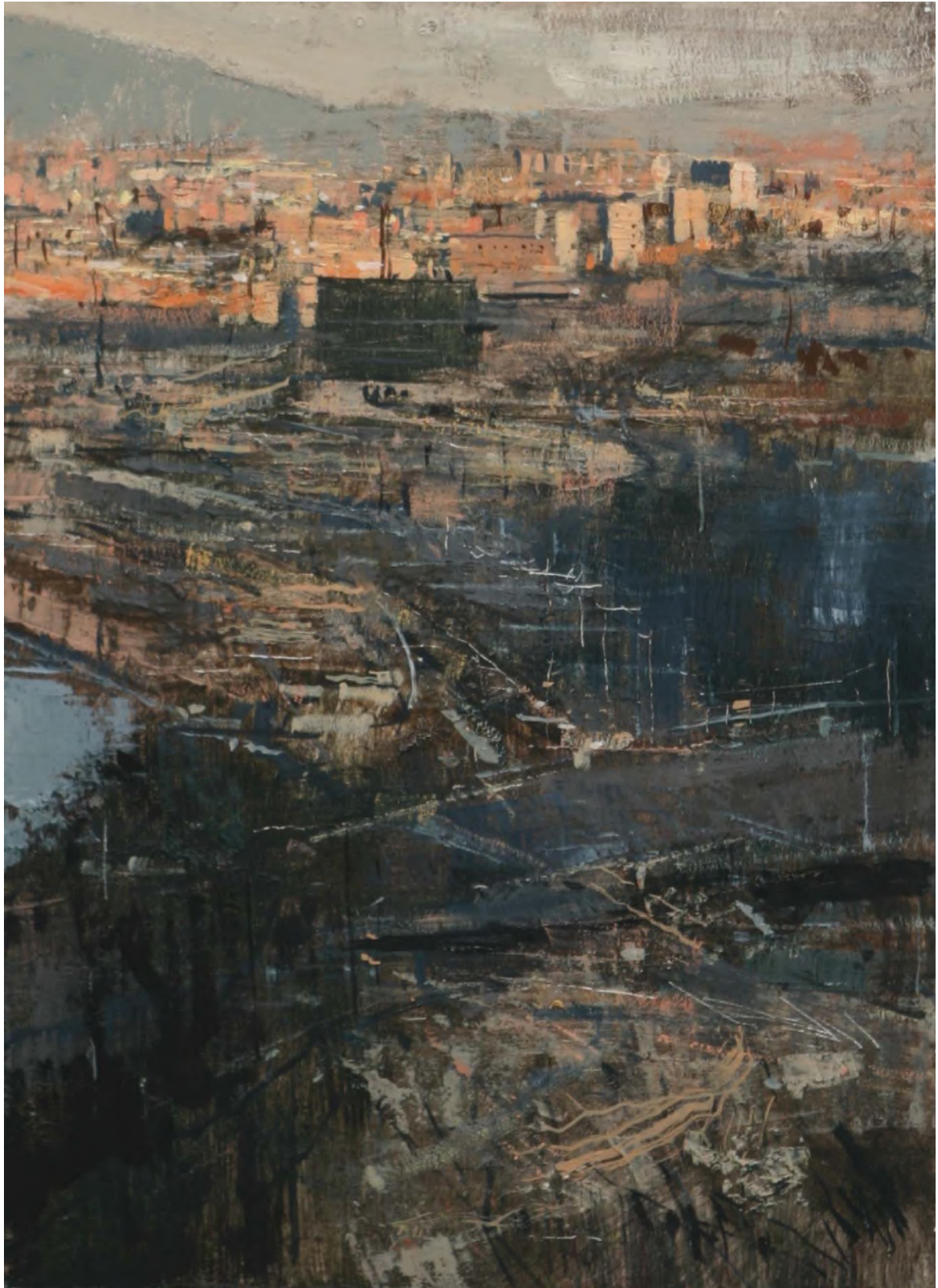
Huile sur bois, 40 x 29 cm, 2010