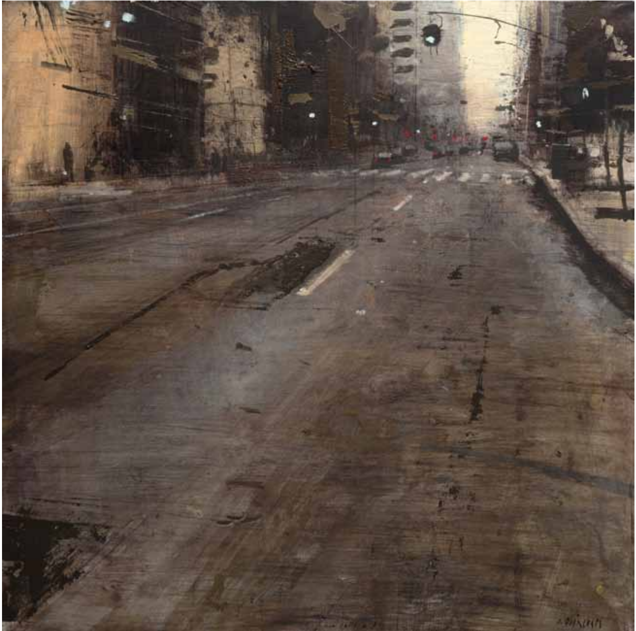
«Perspectiva», Huile sur bois, 60 x 60 cm, 2011