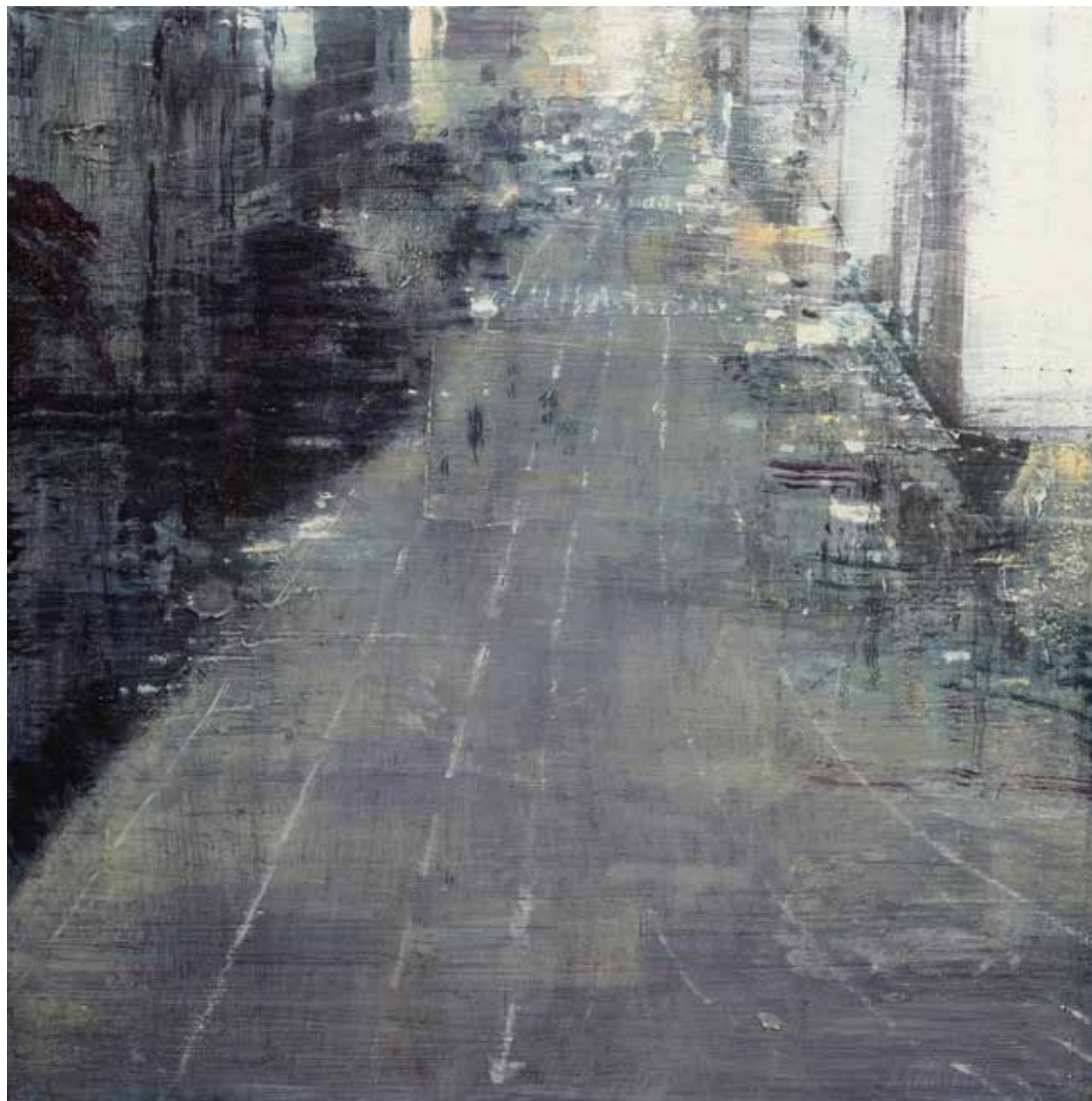
«Calle de Valencia», Huile sur bois, 60 x 60 cm, 2010