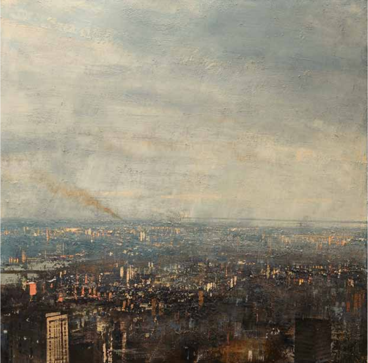
«Nubes grises y humo», huile sur bois, 150 x 150 cm, 2008-2011