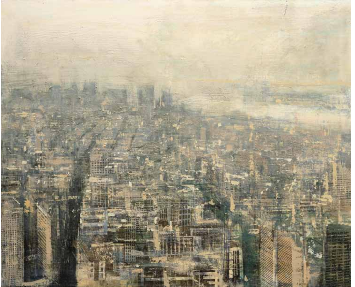
"Nueva York ocre", Huile sur bois, 81 x 100 cm, 2009-2010