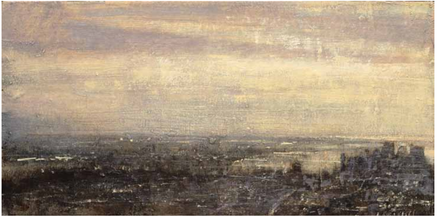
«Atardecer», Huile sur bois, 22 x 44 cm, 2010