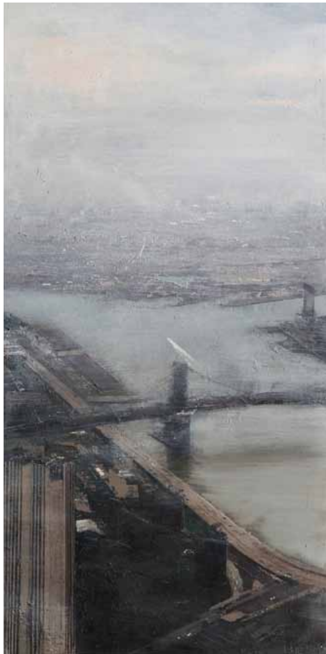
«NY gris», huile sur bois, 160 x 80 cm, 2008-2011