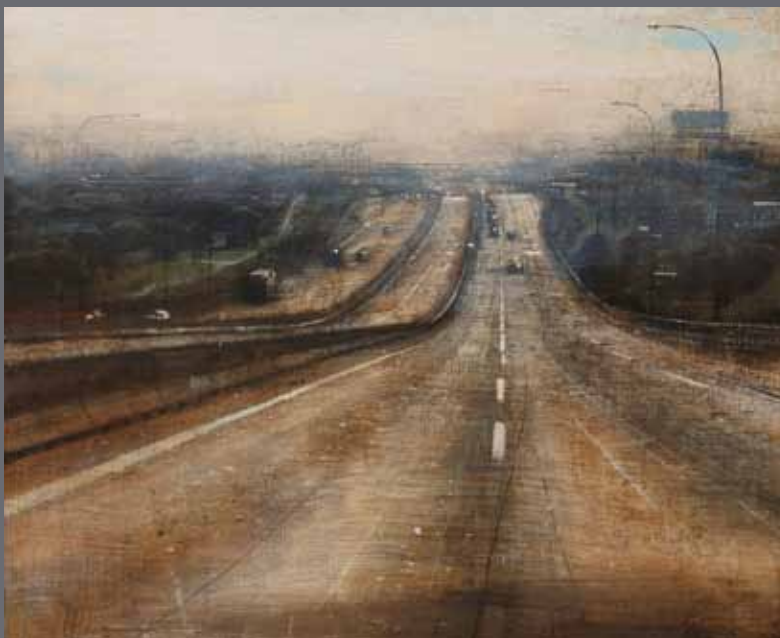
«N-1», huile sur bois, 81 x 100 cm, 2011

EXPOSITION DU 17 JANVIER AU 18 FÉVRIER 2012