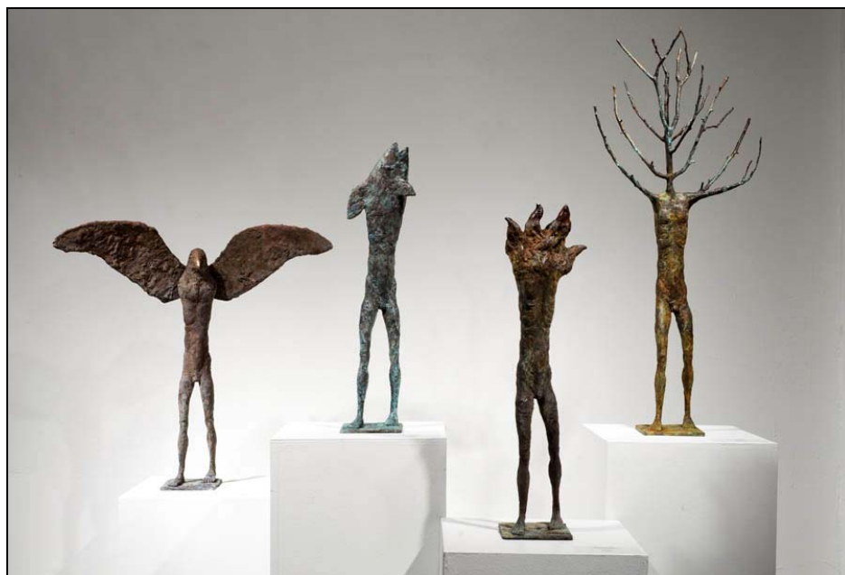
« Les 4 éléments » - Bronze