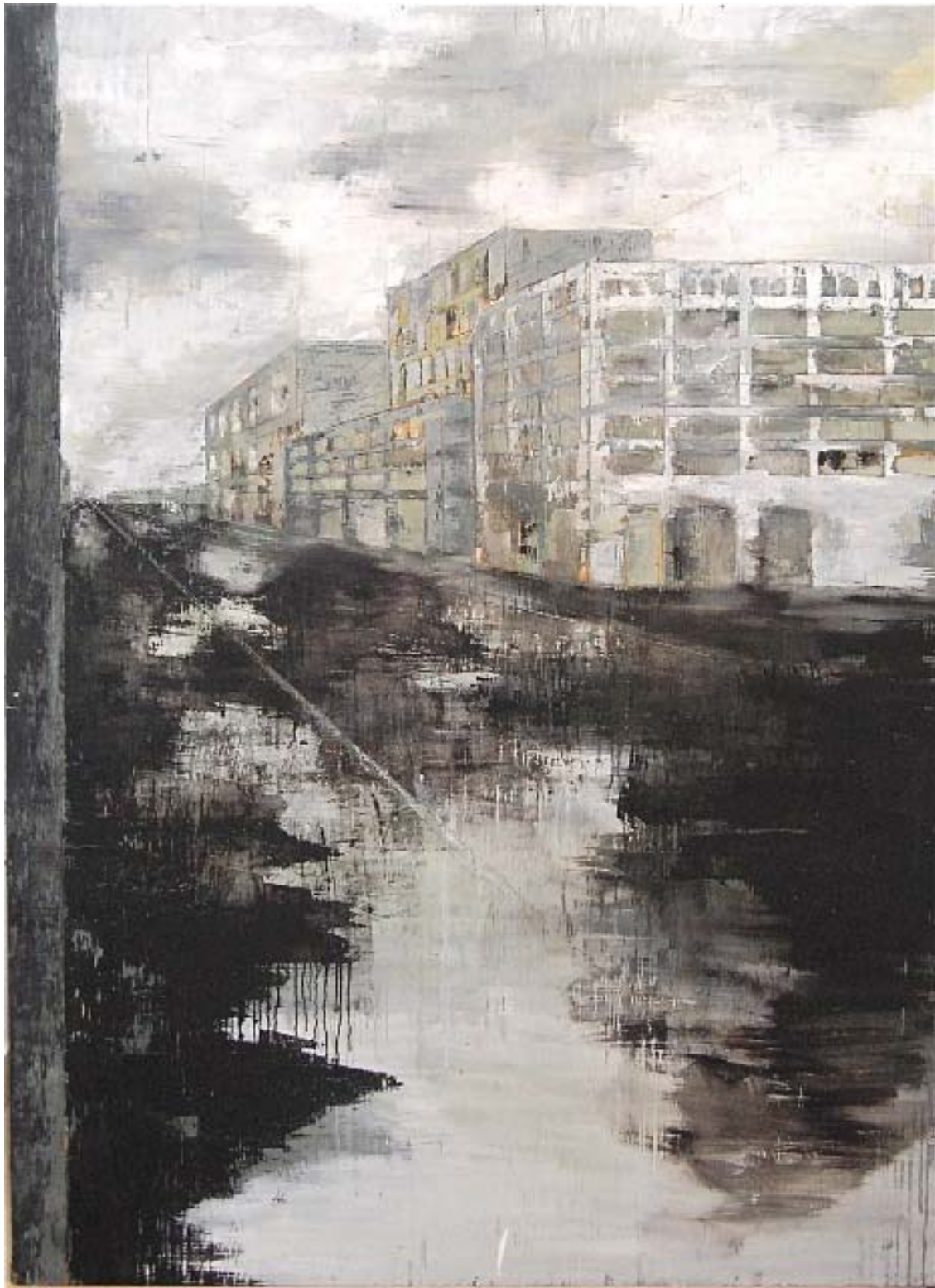
« Caisson », huile sur toile, 150 x 110 cm