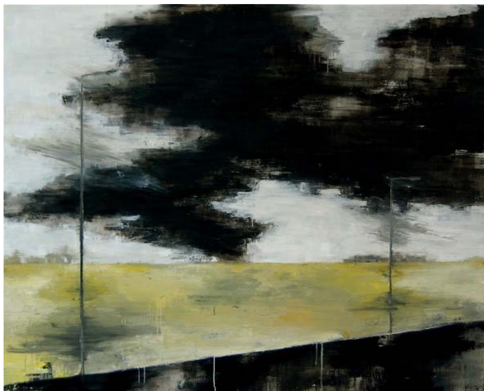
« Champs jaune », huile sur toile, 160 x 200 cm

Galerie ARCTURUS - 65 rue de Seine - 75006 PARIS Tél : 01 43 25 39 02 - fax : 01 43 25 33 89 e-mail : arcturus@art11.com - web : www.art11.com/arcturus