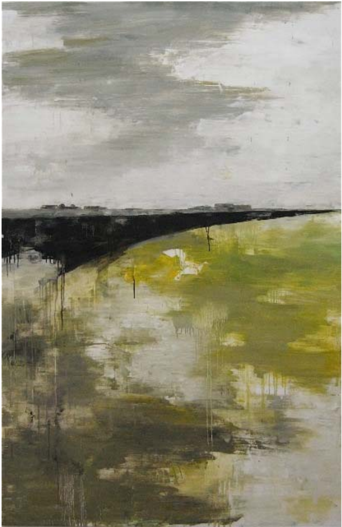
« Wave », huile sur toile, 200 x 130 cm