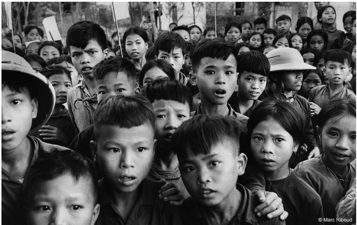
Nord Vietnam, 1969