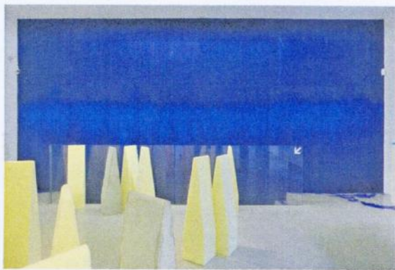
Latifa Echakhch, Chambre , 2009, installation, mousse et béton, 100 x 25 x 25 cm chaque élément, détail (galerie Kamel Mennour, Paris).

Avec brio, la galerie Didier Aaron propose même d'y revisiter le XVIII e siècle, élan originel du design... V. DE M.