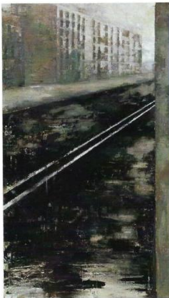
Nieves Salzmann Bitume 2007 Huile sur bois 230 x 120 cm