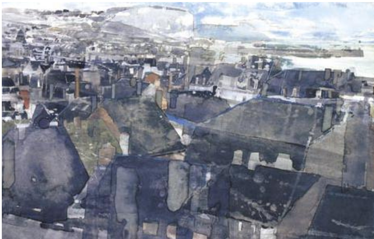
«Le Tréport» - Aquarelle - 30 x 47 cm - 1993