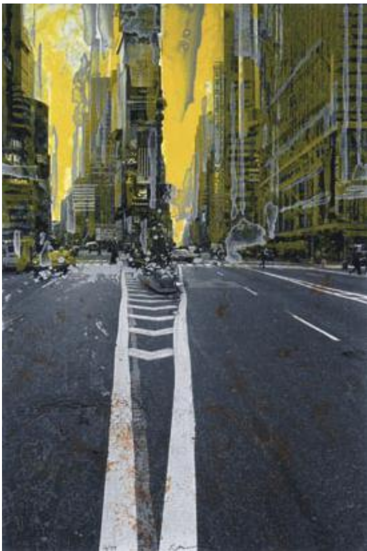
«Yellow Times Square» - Photeauforte - 73,5 x 49,3 cm - 2005