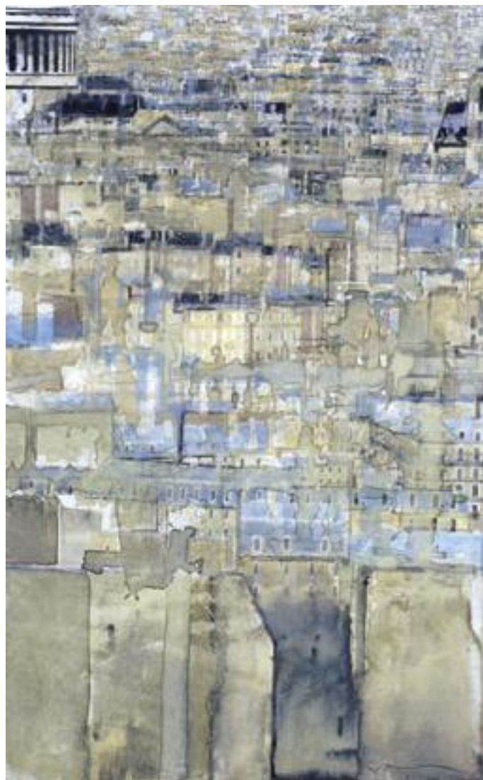
«Paris le Panthéon» - Aquarelle - 47,6 x 30,1 cm - 2006