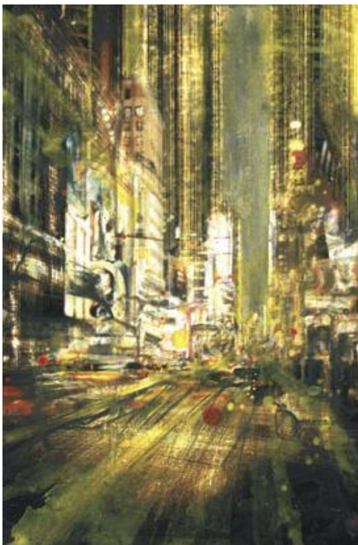
«NY la nuit» - Technique mixte sur photo - 44,8 x 30 cm - 2006