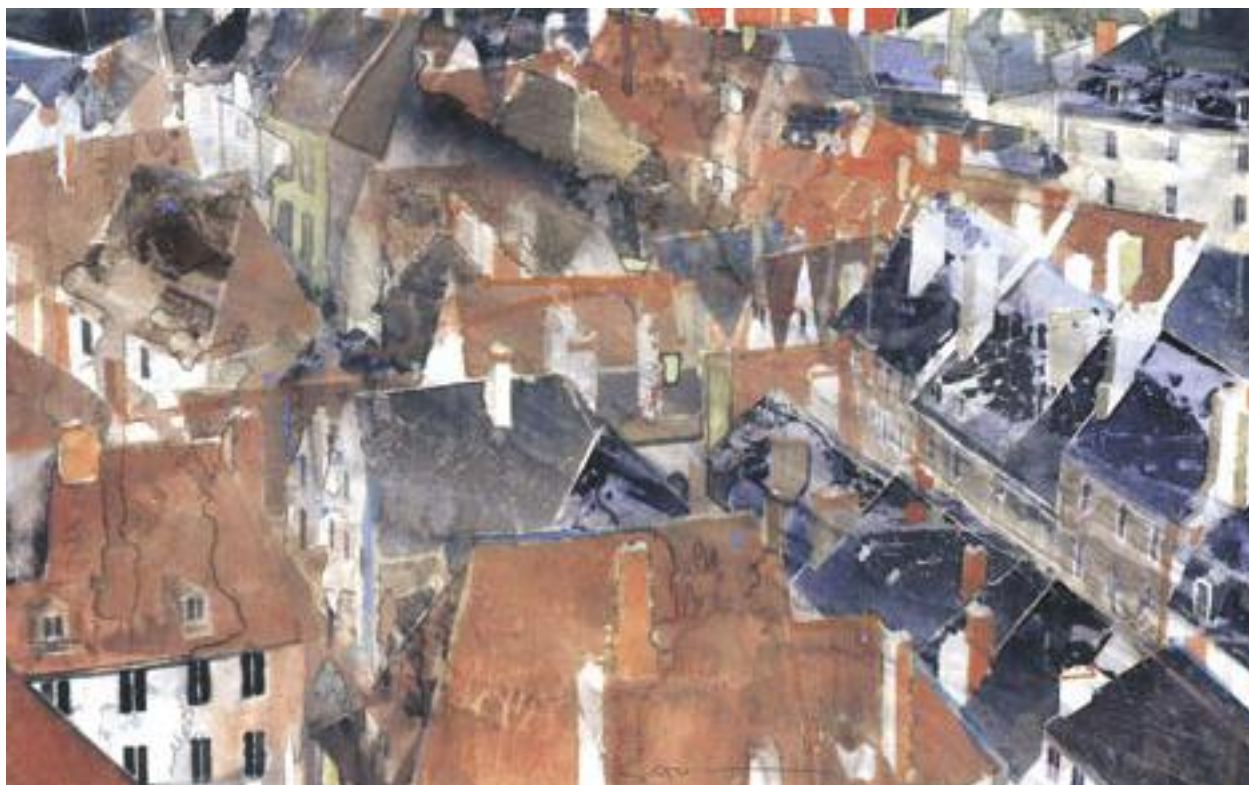
«Bourges II» - Aquarelle - 30 x 47,6 cm - 2006