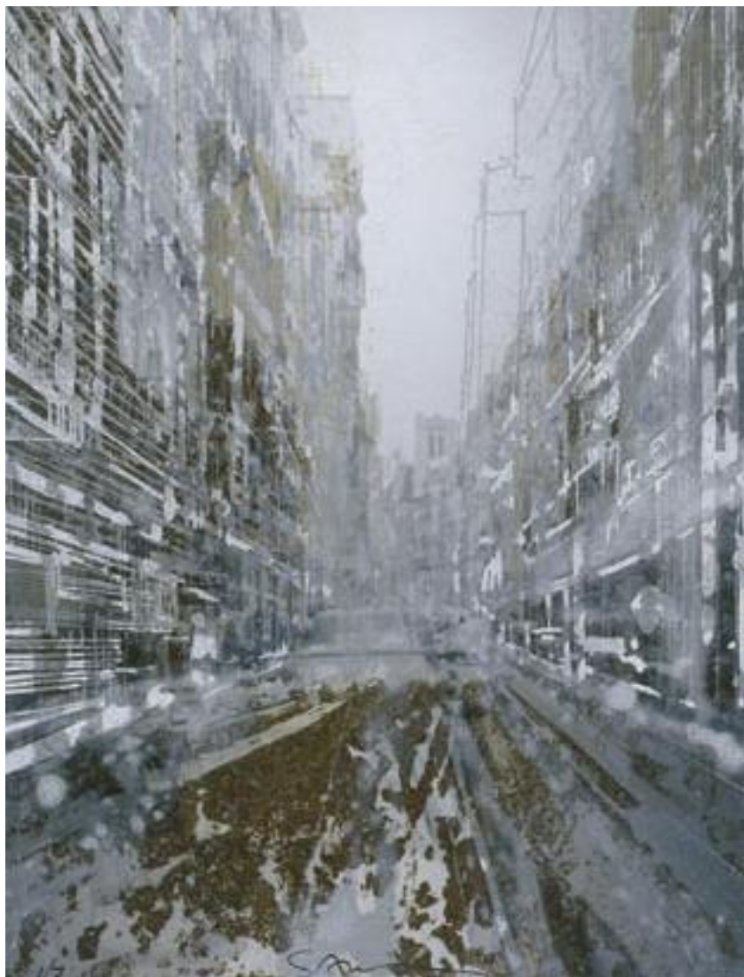
«Saint Nicolas des Champs» - Photeauforte - 28 x 21 cm - 2006