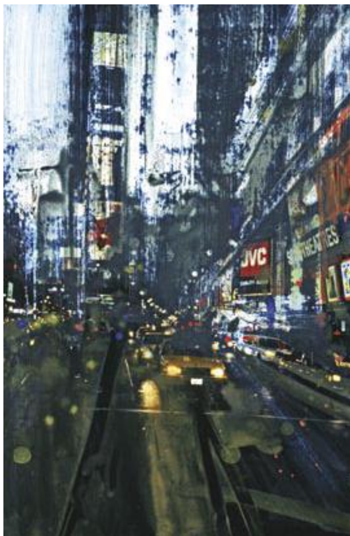
«NY Soho theatres» - Technique mixte sur photo - 45,7 x 30,4 cm - 2006