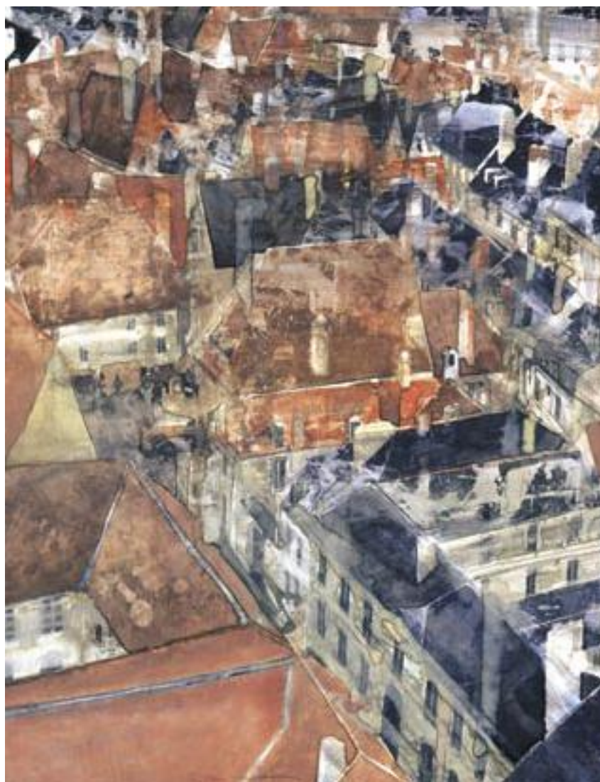
«Bourges I» - Aquarelle - 61 x 46,8 cm - 2006