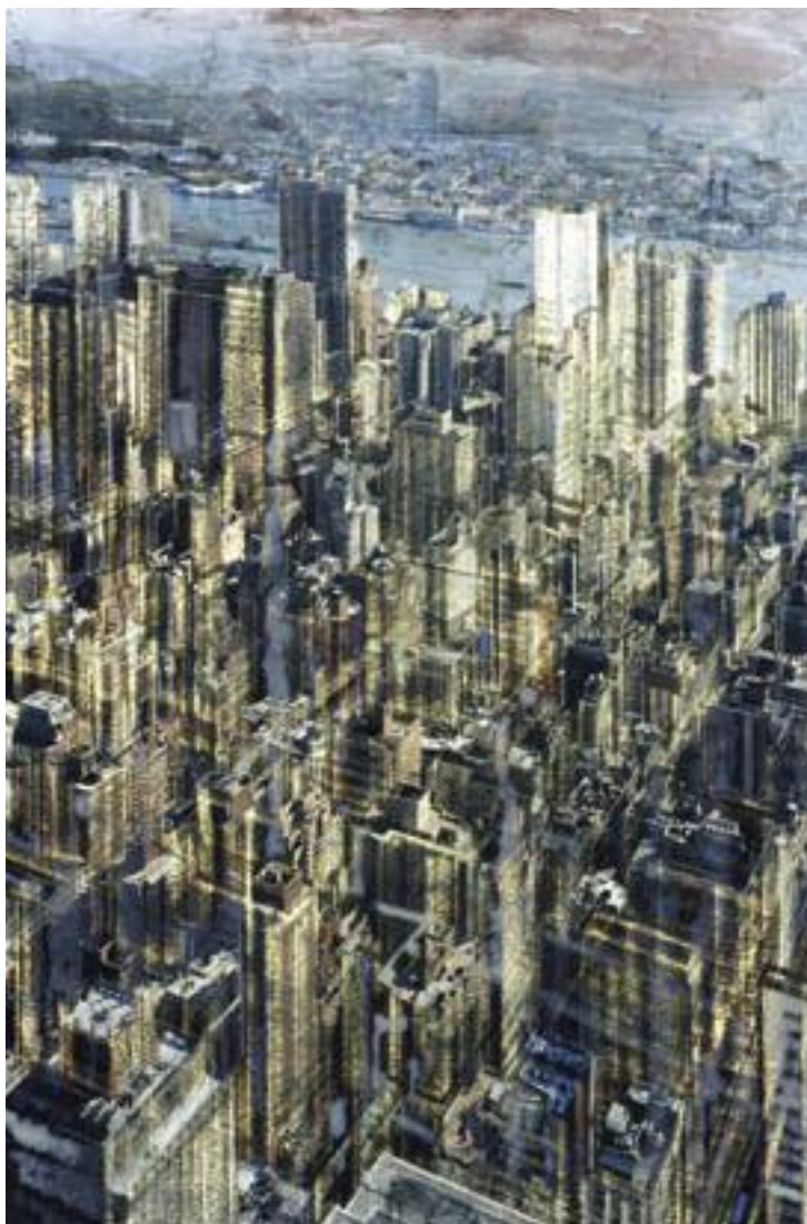
«NY East River» - Technique mixte sur photo - 75,9 x 50,7 cm - 2006