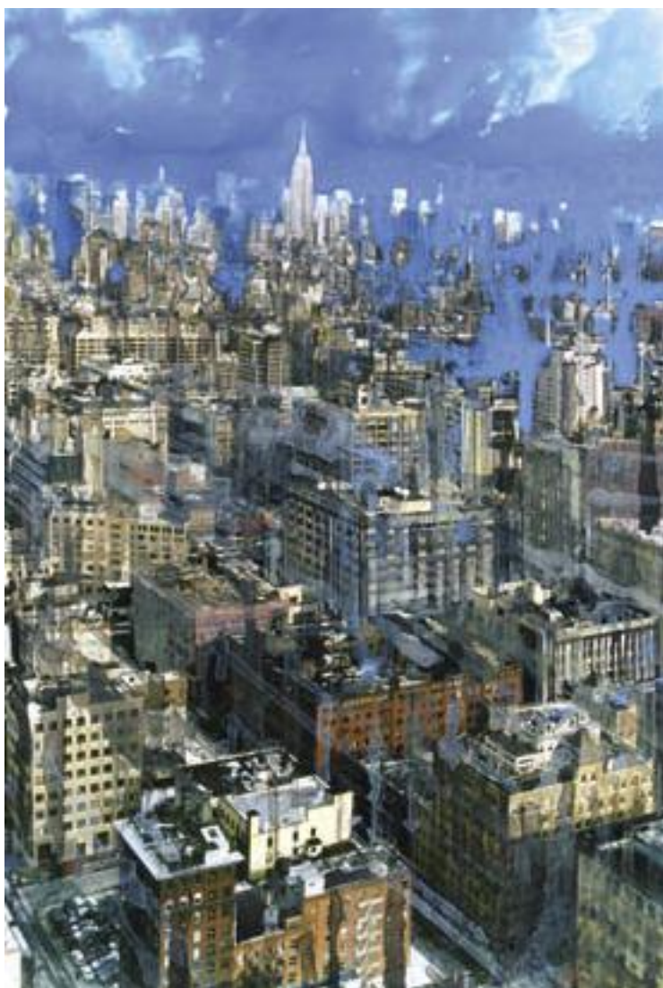
«NY liquide sky» - Technique mixte sur photo - 75,3 x 50,7 cm - 2006