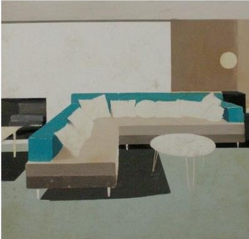
Regina GIMENEZ, Sans titre, Mixte sur toile, 100 x 100 cm