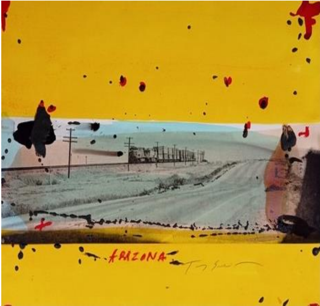
Tony SOULIE, Arizona, 2021, Technique mixte sur photo, 60 x 80 cm