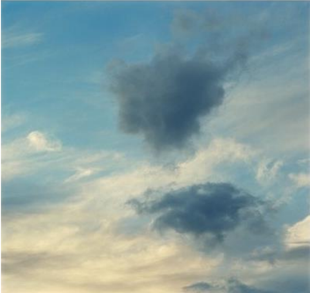
Tim HALL, Sky III, Impression pigmentaire sur papier gravure, 100 x 100 cm