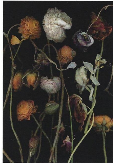
Stockage 182, 2019, 177 x 122 cm © Luzia Simons Ci-dessous : Stockage 183, 2019, 177 x 122 cm © Luzia Simons

Le végétal est au cœur du travail photographique de Luzia Simons, artiste présentée plusieurs fois au Domaine de Chaumont sur-Loire et invitée en 2016 à créer une installation in situ dans la cour d'honneur de l'Hôtel de Soubise (Archives nationales de Paris). Elle a développé une technique personnelle très spécifique de scanogramme qui consiste à scanner chaque fleur dans les moindres détails avant de réaliser une photographie réaliste sur fond noir. Une façon de fixer de façon presque paroxystique la beauté du monde, dans une intemporalité envoûtante. Un magnifique travail ! < V.N