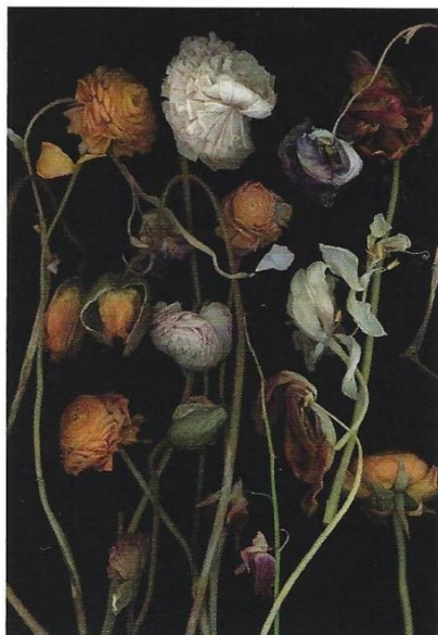
Stockage 182, 2019, 177 x 122 cm © Luzia Simons