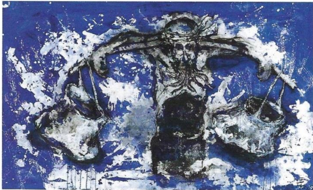
La fuite, technique mixte sur toile 133 x 210cm, 2005 Ci-dessous : Monbay Victoria terminus, huile sur toile et collage, 200 x 200 cm, 2004.

Retour sur les années « indiennes » pour le peintre Fred Kleinberg. De 2000 à 2010, l'Inde est au cœur de son travail pictural. Une Inde vue de l'intérieur, transcrite sur la toile avec sincérité et passion. En 2004, alors qu'il séjourne sur place, en résidence d'artiste près de Pondichéry, il est confronté à l'une des pires catastrophes naturelles de l'histoire des hommes. Le 26 décembre 2004, un tremblement de terre d'une magnitude de 9,1 se produit au large de l'île de Sumatra. En résulte un terrible tsunami qui frappe notamment le sud de l'Inde. Fred Kleinberg, en réchappe de peu et témoignera dès lors, avec son écriture caractéristique, du traumatisme engendré par le cataclysme, notamment à travers une fresque in situ, à la craie noire, au format hors norme (plus de 18 mètres de long) réalisée à partir d'un rouleau de papier miraculeusement préservé. < B.L