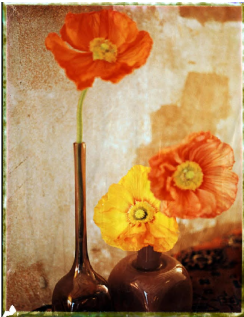
Impression numérique sur papier Fine Art - 40 x 50 cm ou 100 x 130 cm