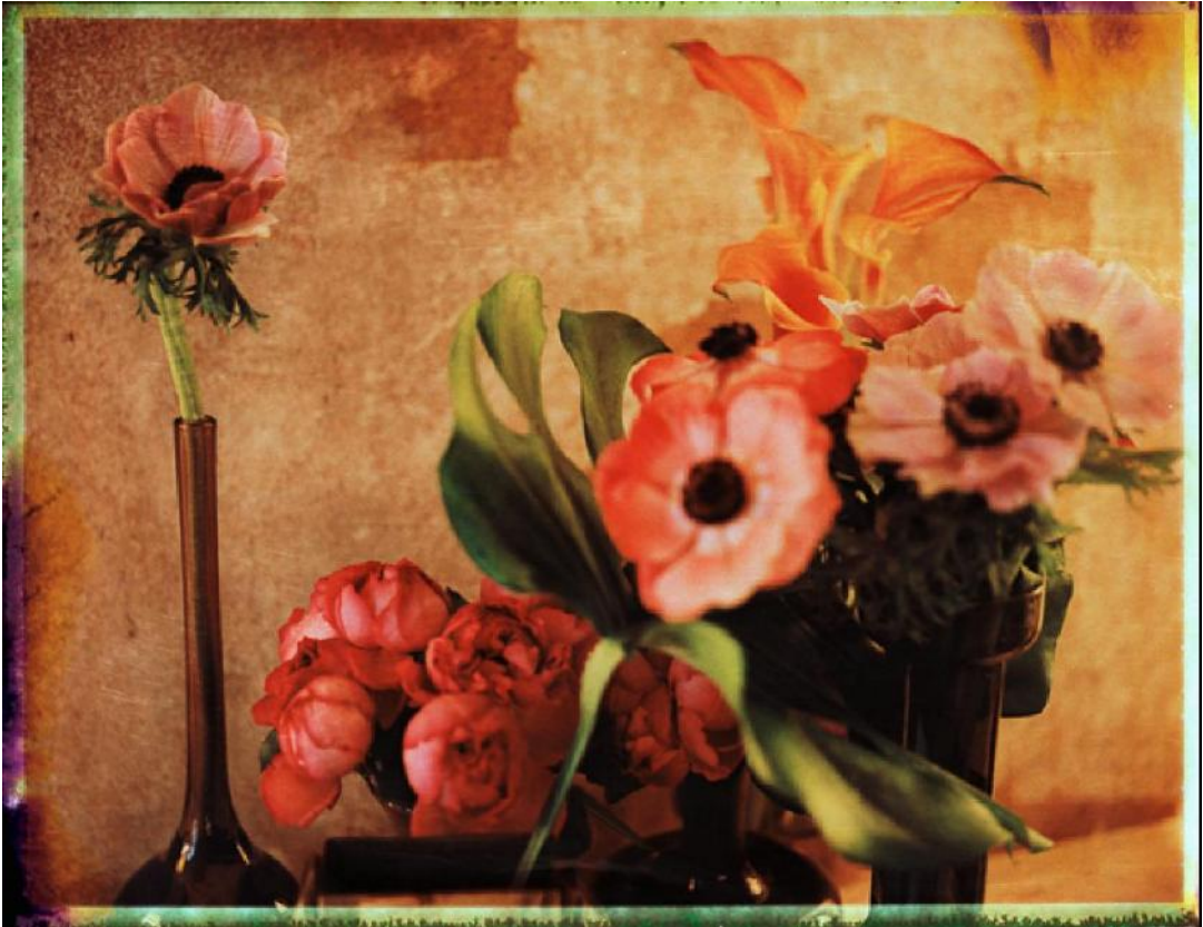
Impression numérique sur papier Fine Art - 40 x 50 cm ou 100 x 130 cm