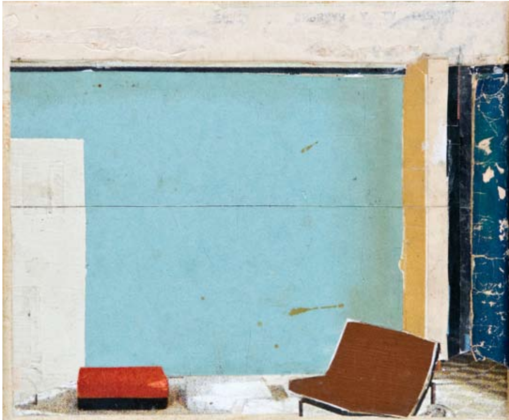
«Sans titre» - Mixte sur toile - 15 x 18 cm