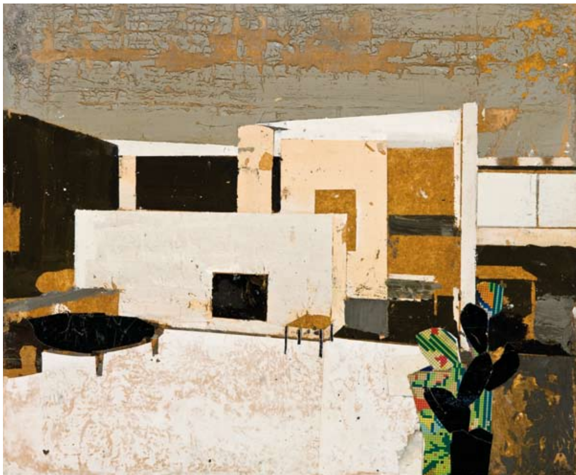
«Color y forma» - Mixte sur toile - 39 x 46 cm