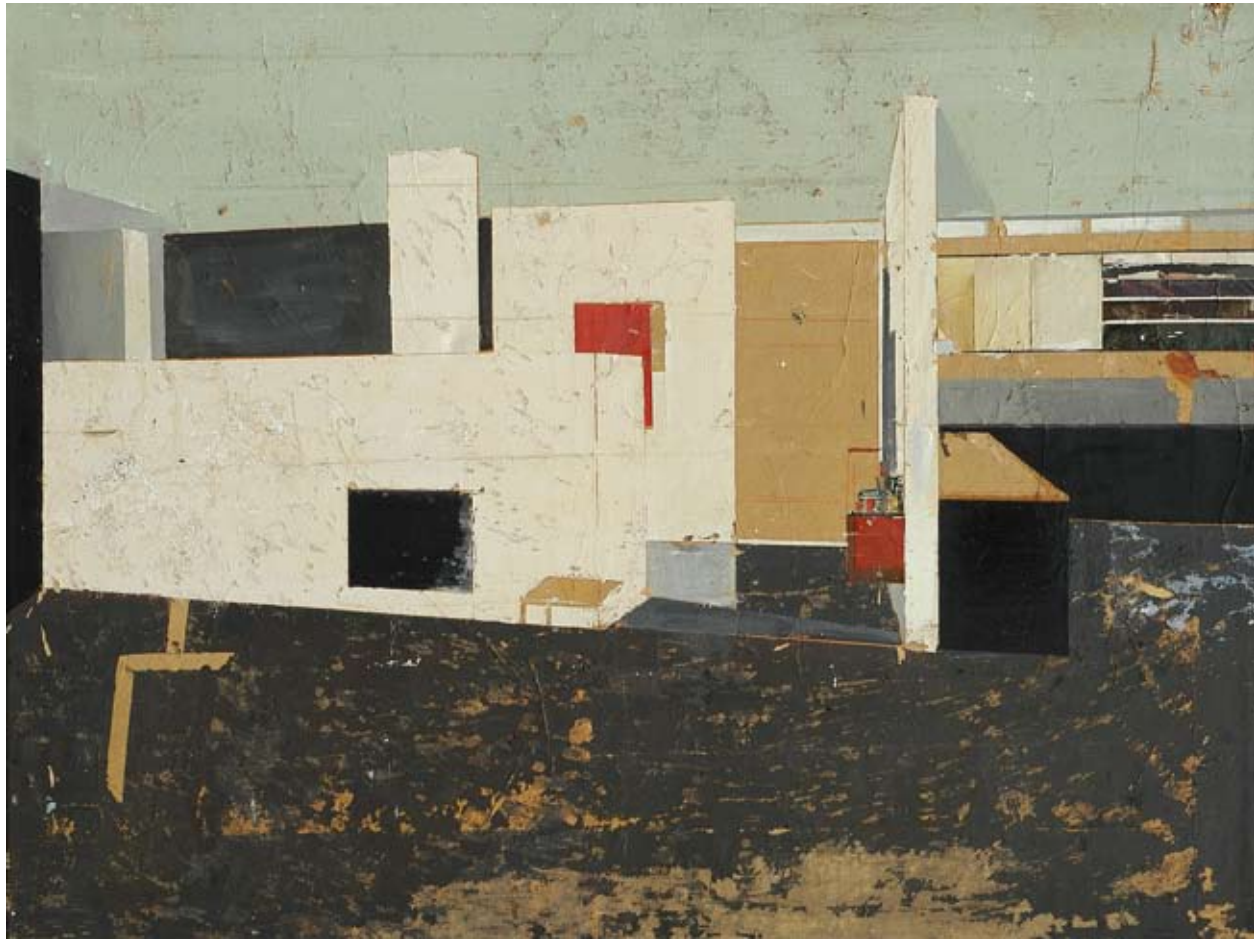
«Conventionales» - Mixte sur toile - 97 x 130 cm