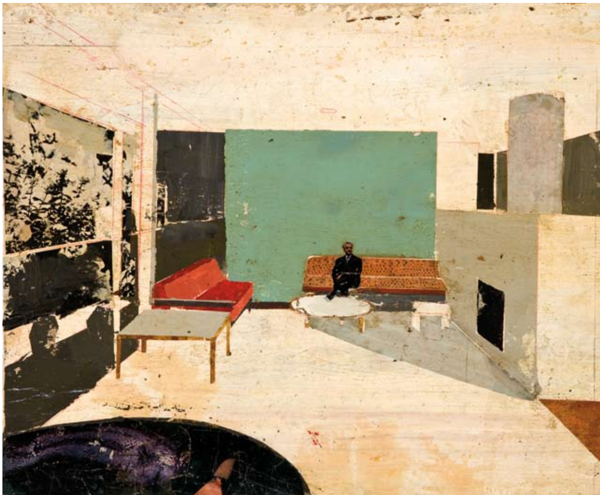
«Color y forma» - Mixte sur toile - 39 x 46 cm