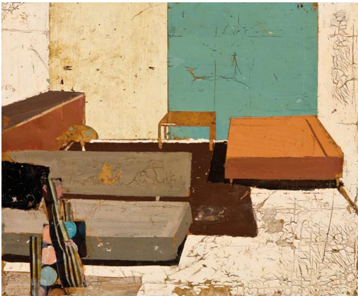
«Color y forma» - Mixte sur toile - 39 x 46 cm