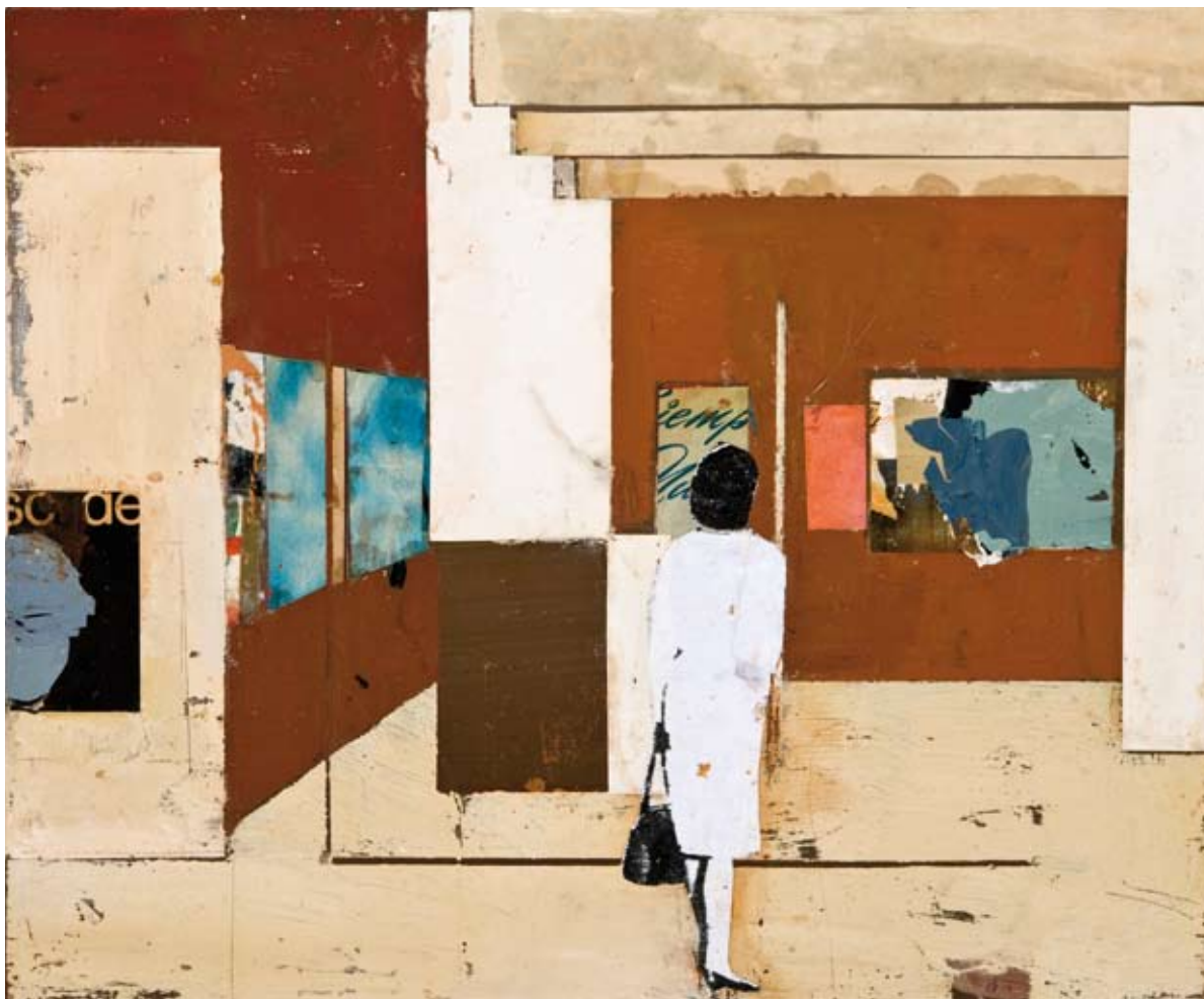
«Color y forma» - Mixte sur toile - 39 x 46 cm