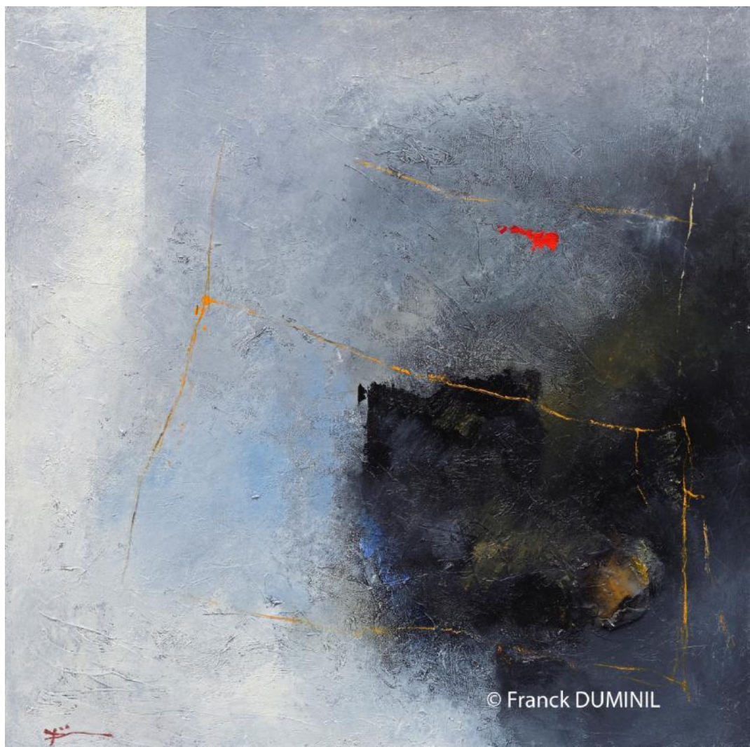
Océanides III, huile sur toile, 80 x 80 cm