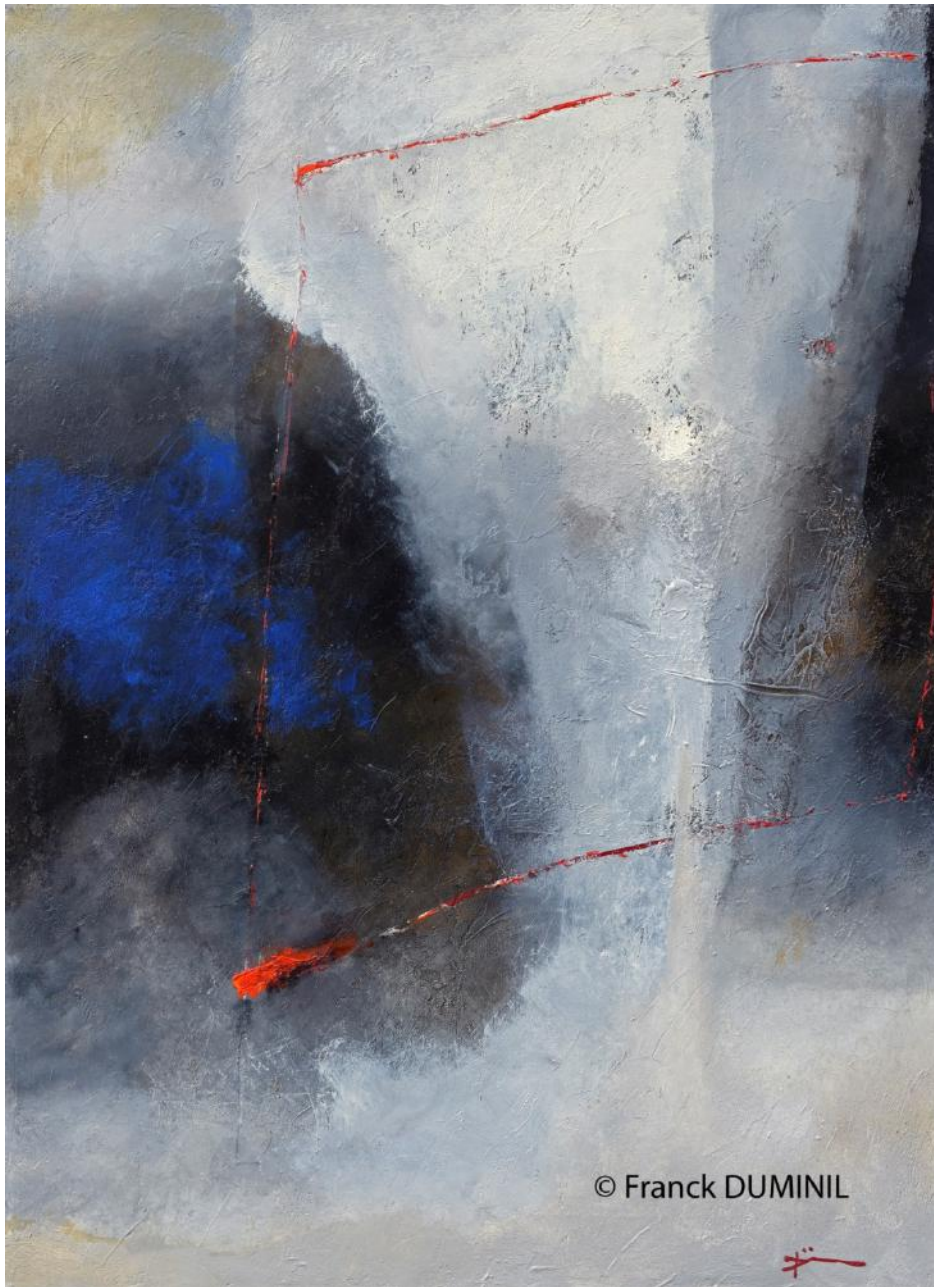
Déplacement d'aube VIII, huile sur toile, 100 x 73 cm