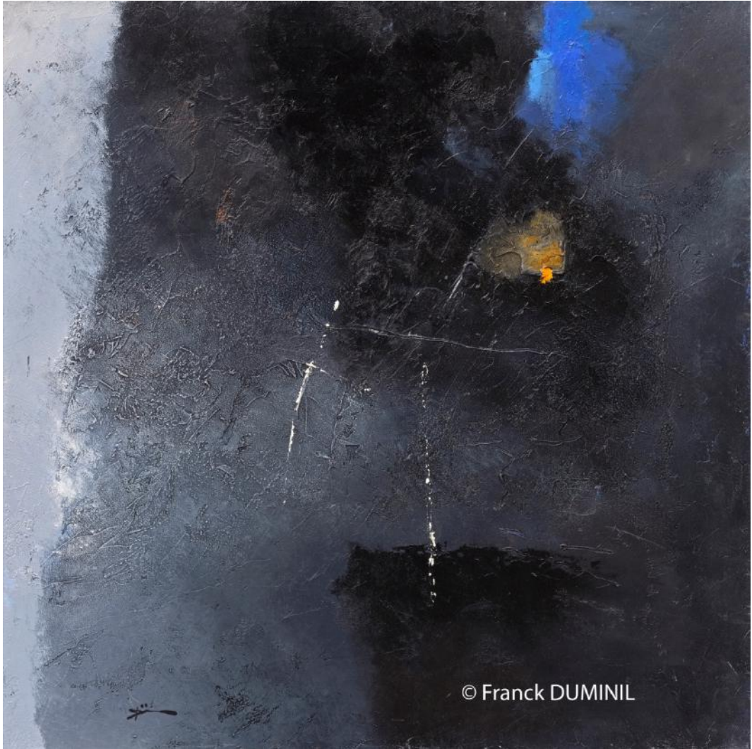
Sente marine X, huile sur toile, 80 x 80cm