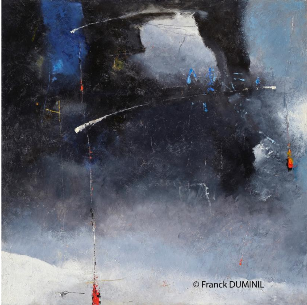
L'ombre qui tourne I, huile sur toile, 120 x 120 cm