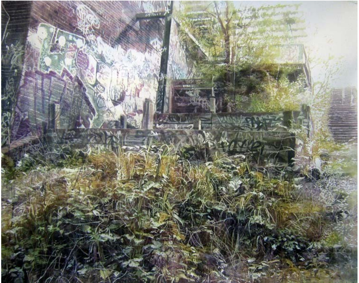
Oraculum, 123 x 153 cm