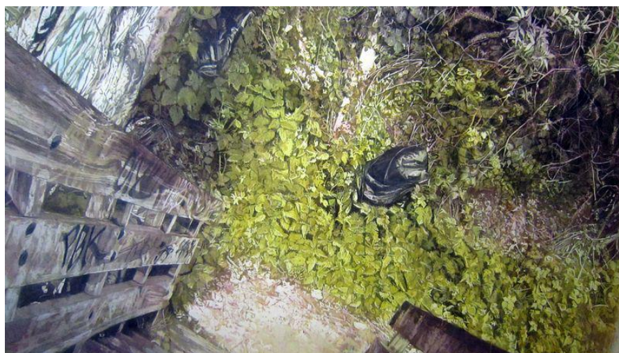
Vinculum (détail), 280 x 200 cm