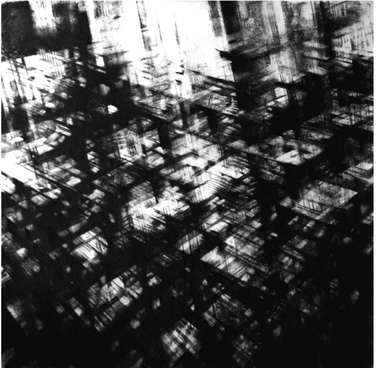
Héliopolis, 100 x 100 cm