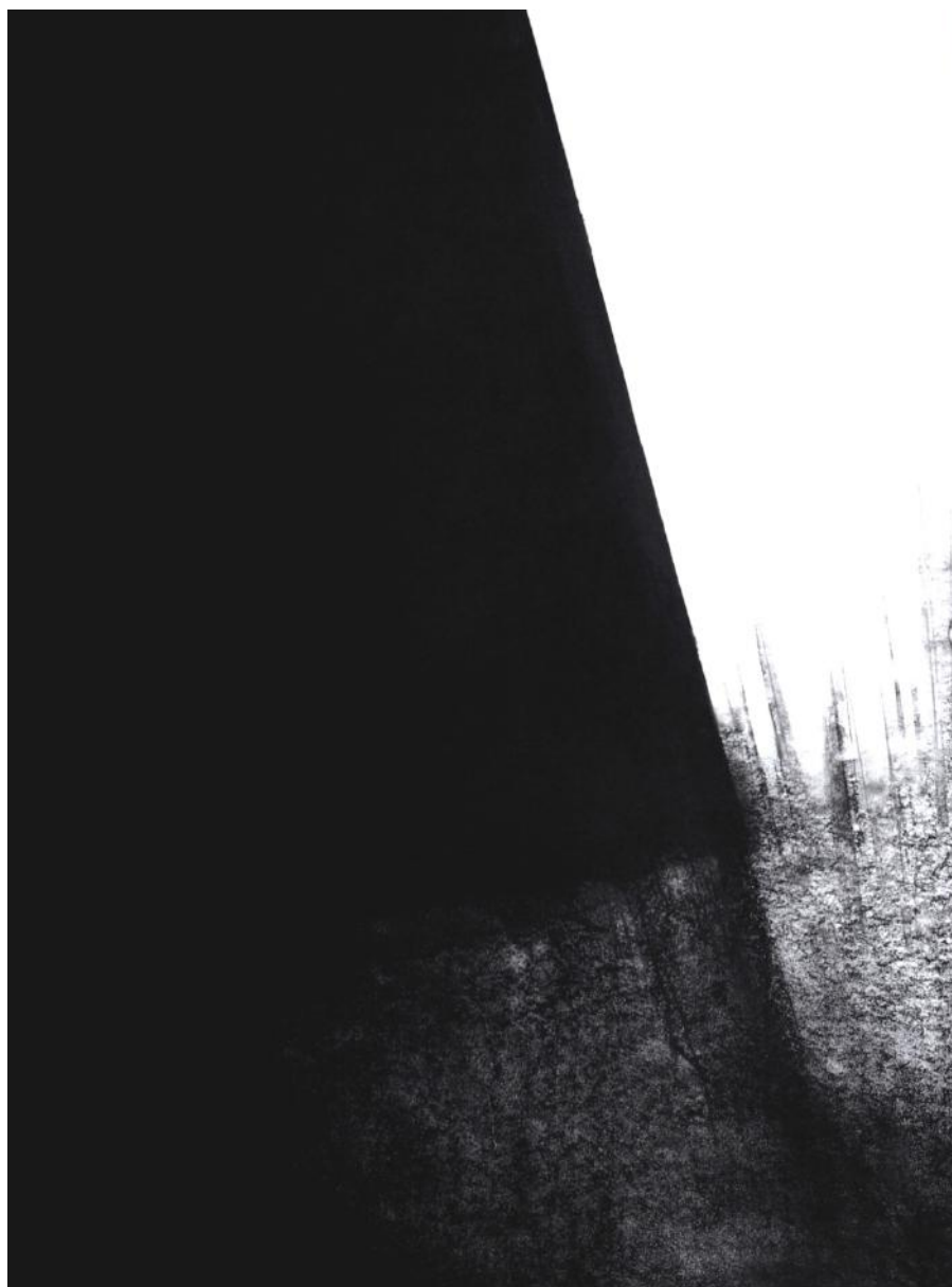
Gravure IV, 110 x 75 cm