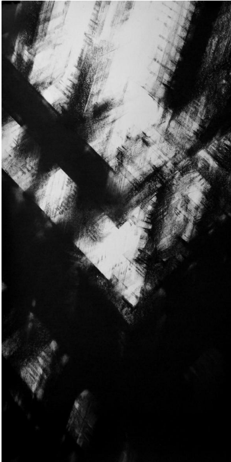
Submersion III, 100 x 50cm