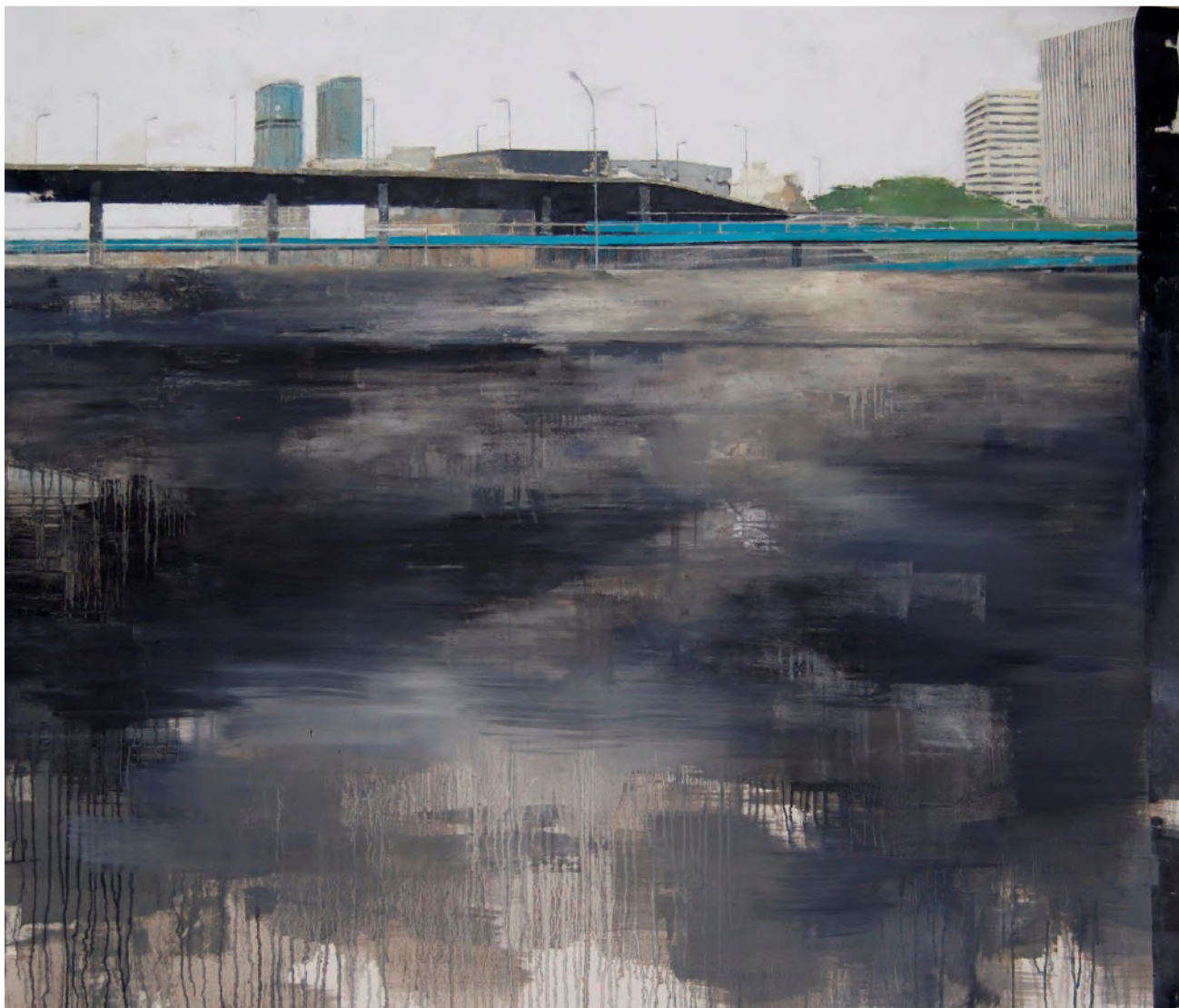
Nieves SALZMANN « Périphérie », huile sur toile, 112 x 145, 2013