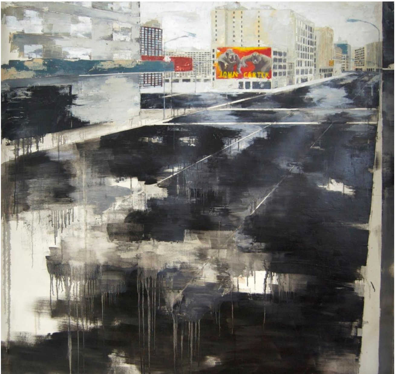
Nieves SALZMANN « John C », huile sur toile, 144 x 140, 2013