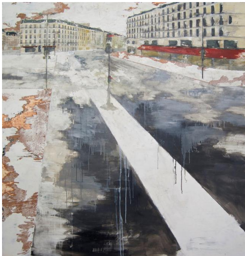
Nieves SALZMANN « P-Fev 13", Mixte sur bois, 153 x 146 cm