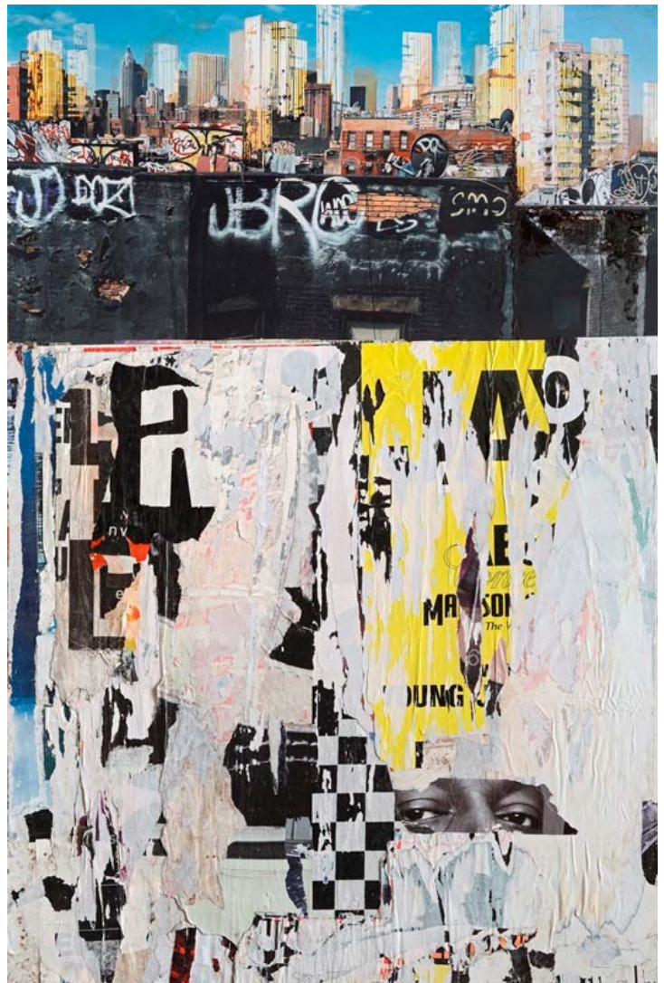
« Young-you are observed », Mixte sur photo et collages, 146 x 97 cm