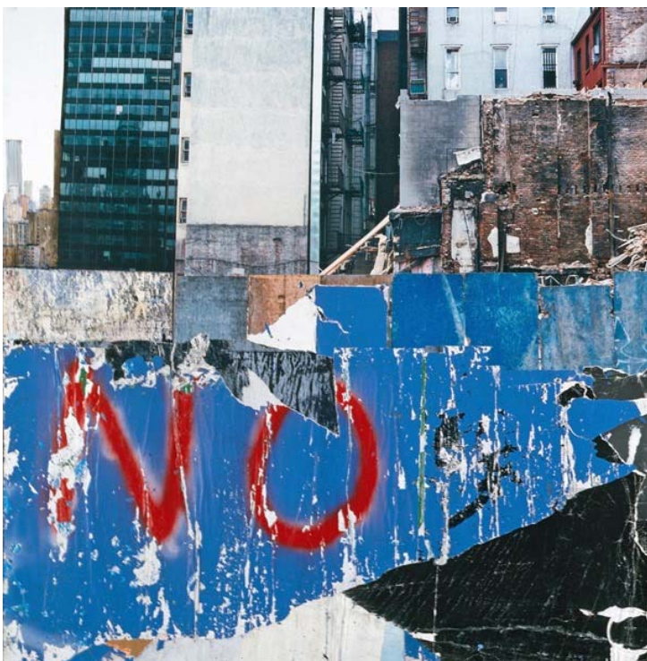
« No », Mixte sur photo et collages, 90 x 90 cm