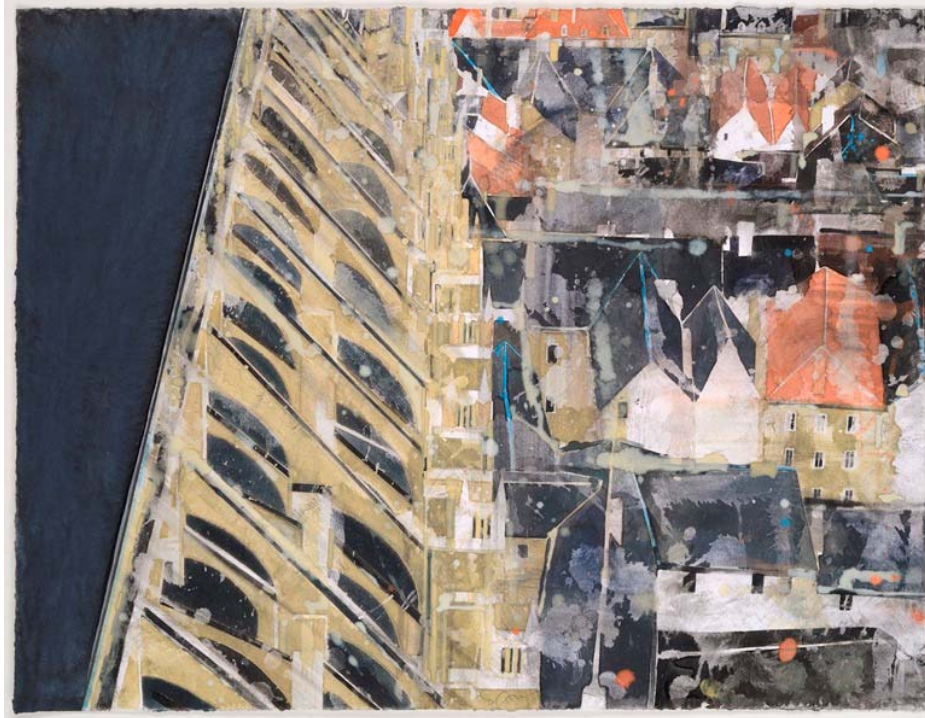
« Le toit de la Cathédrale de Bourges », aquarelle sur papier, 46,7 x 60, 3 cm