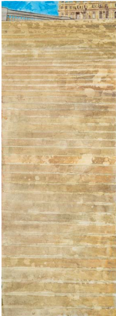
« Escalier de Versailles », aquarelle sur papier, 73 x 26,5 cm