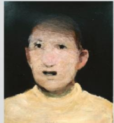
Miguel MACAYA, huile sur papier, 40 x 35 cm, 2013

Miguel MACAYA, peintures récentes 3 octobre > 2 novembre