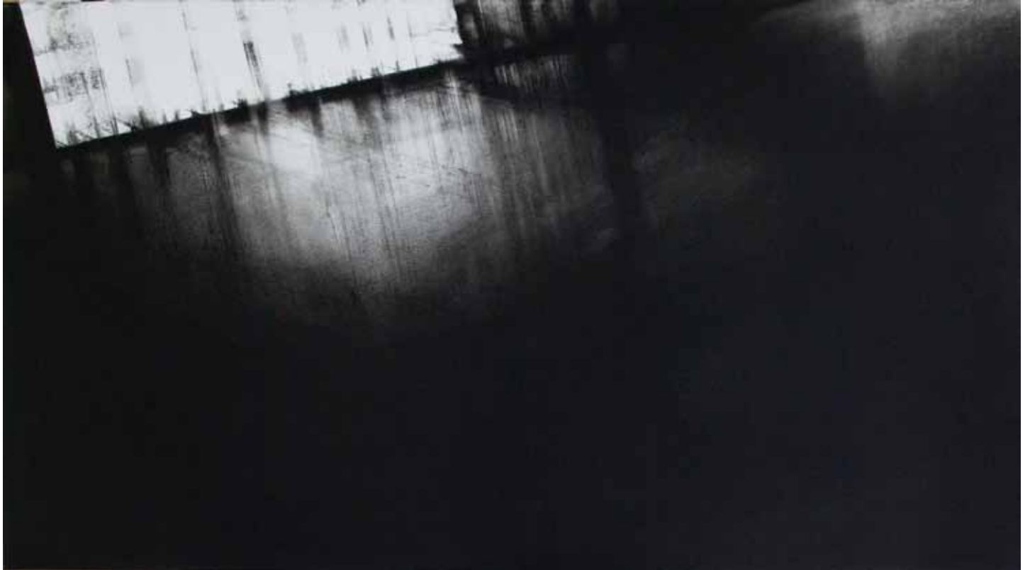
"Déflecteur", pastel sec noir sur papier, 56 x 102 cm, 2010