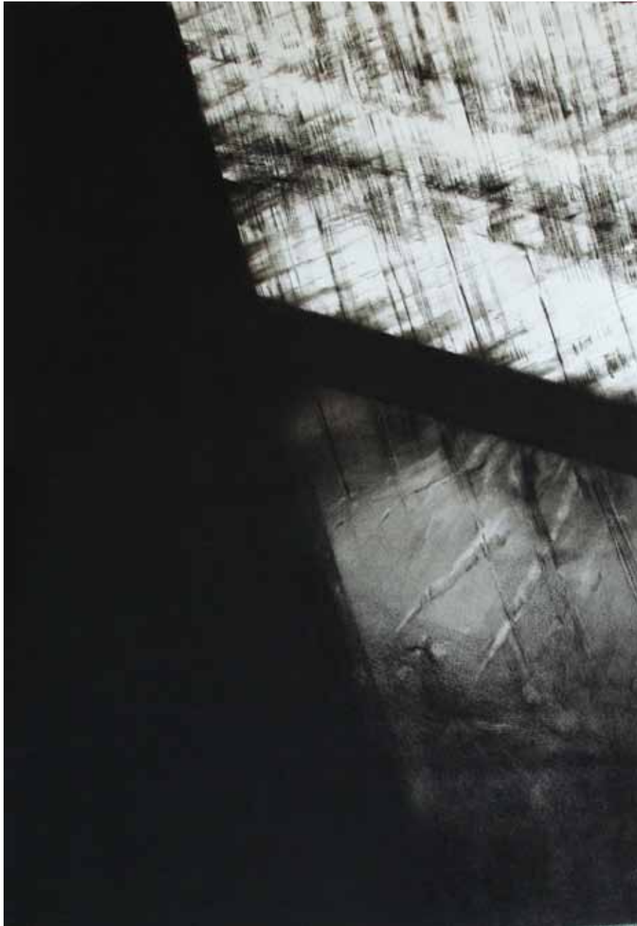
"Organisme", pastel sec noir sur papier, 100 x 70 cm, 2010