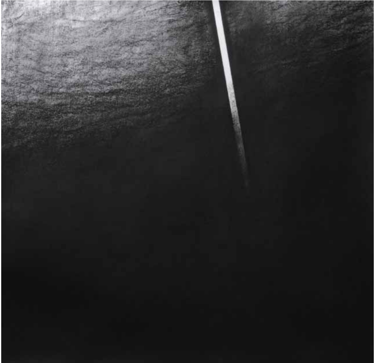
"Artefact", pastel sec noir sur papier, 100 x 100 cm, 2011