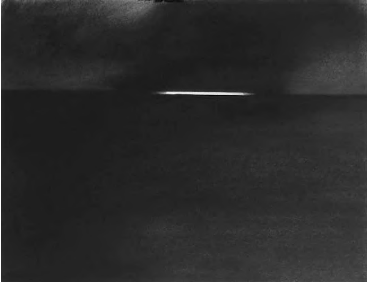
"Rivage", pastel sec noir sur papier, 55 x 65 cm, 2006