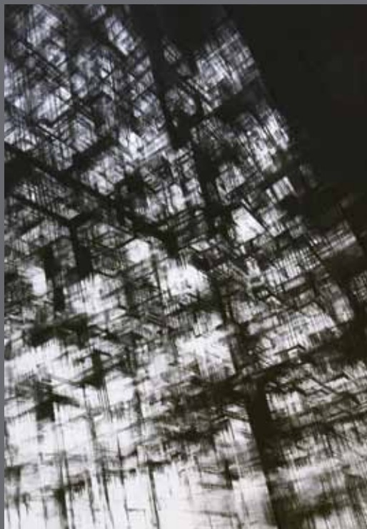
"NY-Avenue", pastel sec noir sur papier, 70 x 100 cm, 2010