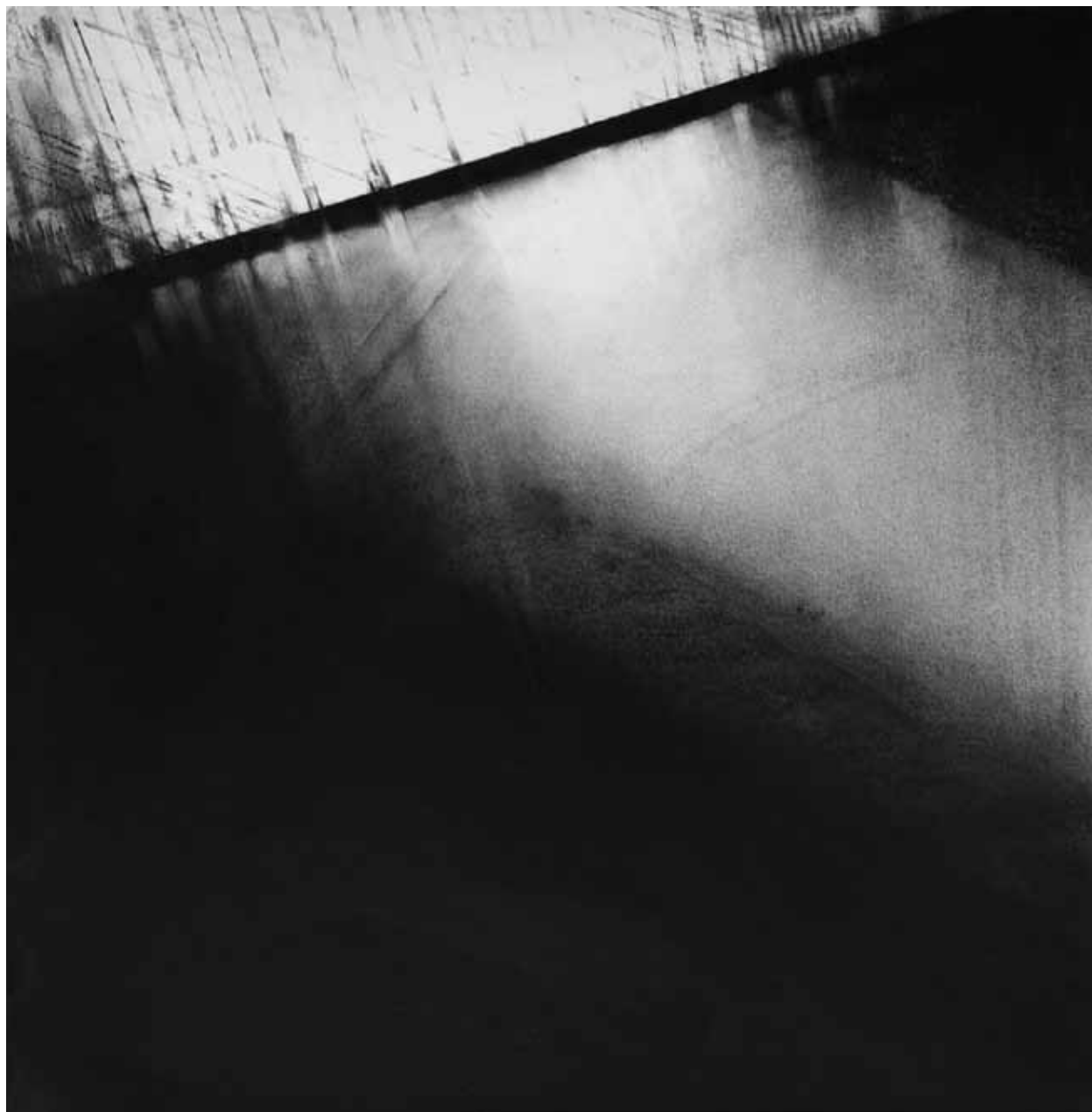
"Miroir", pastel sec noir sur papier, 70 x 70 cm, 2010