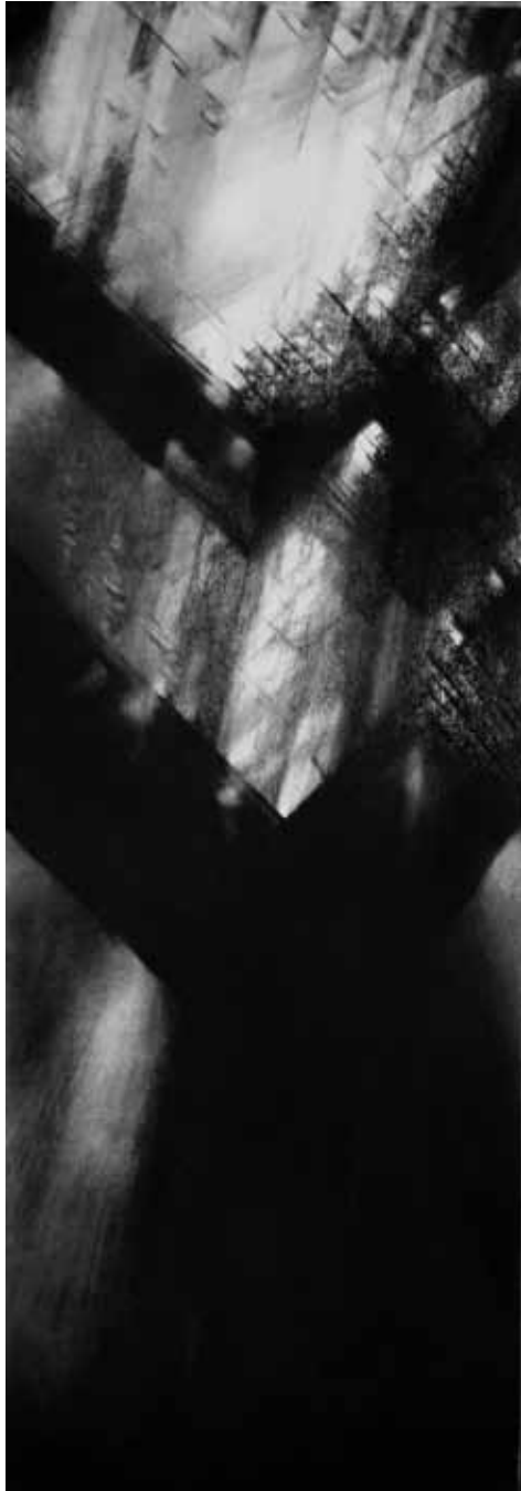
"Submersion", pastel sec noir sur papier, 95 x 33 cm, 2008