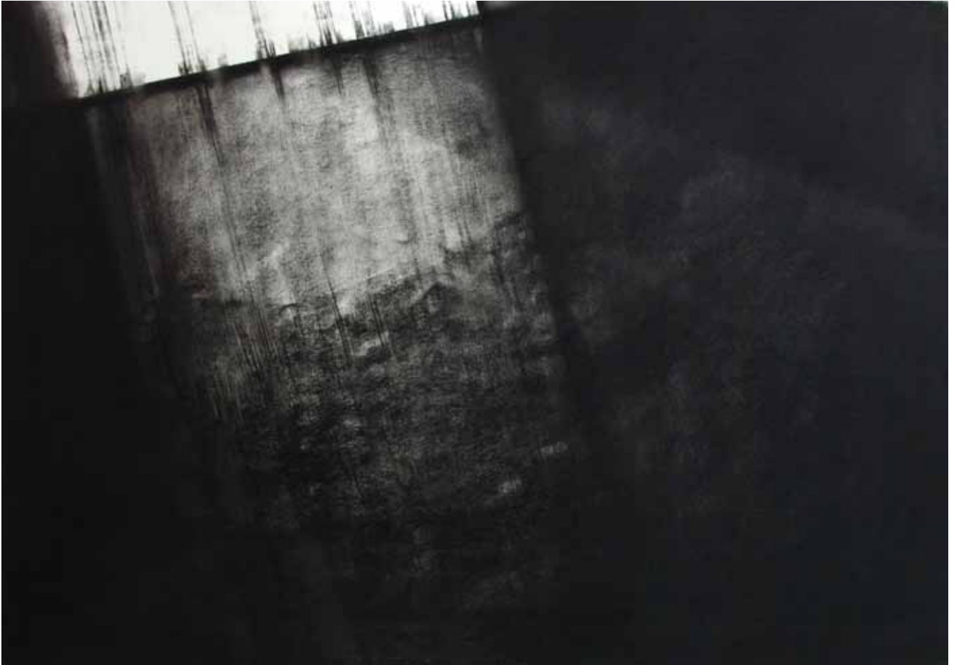
"Cascade", pastel sec noir sur papier, 70 x 100 cm, 2010