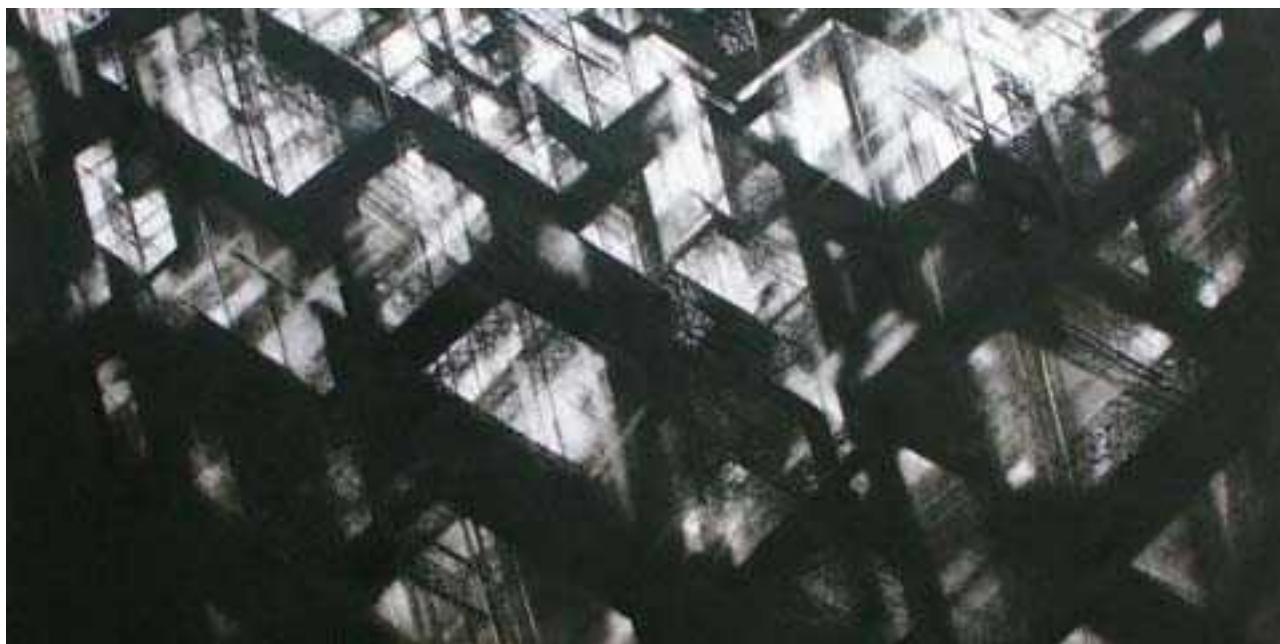
Surplomb (détail), pastel sec, 100 x 100 cm, 2009