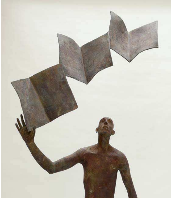
« Levedad » - Bronze - 230 x 120 x 50 cm