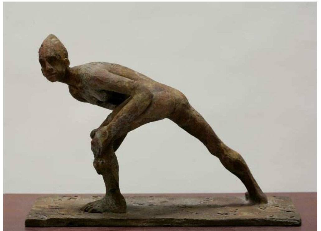
« Ninfa » - Bronze - 19 x 29 x 12 cm