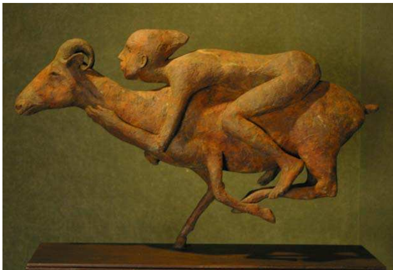
« Nina sobre cabra » - Bronze - 35 x 56 x 16 cm