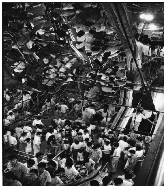
Marc RIBOUD, Demain Shanghai, Tirage argentique

Marc RIBOUD , quant à lui, est l'auteur de quelques-unes des photos les plus célèbres du XXème siècle comme celle d'une « Jeune femme tenant une fleur face aux baïonnettes des soldats », lors de la marche pour la paix au Vietnam en 1967. Ses clichés sont les réactions spontanées de ses rencontres. C'est un homme libre et passionné, voyageur magnifique que le monde continue d'étonner. Marc Riboud célèbre plus le processus visuel qu'intellectuel de la photographie. Il en résulte une grande diversité des sujets abordés célébrant l'humanité sous les angles qui la composent et la décomposent. A l'observateur de trouver son degré de lecture, qu'il soit politique, social ou historique. Dans tous les cas, Marc Riboud offre une libre interprétation de son travail, sa principale ligne de conduite étant une rigueur esthétique à travers ses compositions où « l'œil fait seul son chemin ».