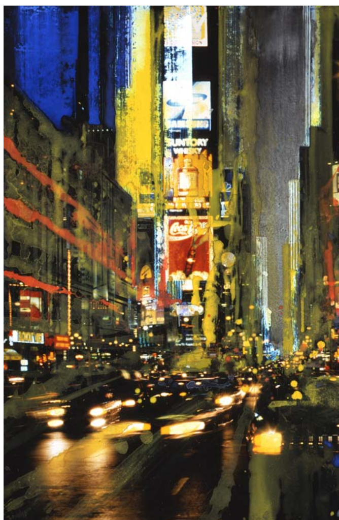
Gottfried SALZMANN, New York Suntory, Mixte sur photo, 75 x 50 cm

Gottfried SALZMANN , passionné de la lumière, et de ses vibrations, a très tôt choisi comme mode d'expression, à la fois l'aquarelle et la photographie, attiré fortement par les paysages urbains de nos capitales européennes. La parenté intime entre la luminosité de ses aquarelles et l'utilisation de la lumière dans ses photos est particulièrement évidente, l'immatériel travail de la lumière sur un support sensible le fascine. A sa manière il utilise cette relation pour intégrer la photo dans la peinture tout en désintégrant la peinture sur la photo Son univers d'exception est d'ailleurs représenté dans de nombreuses collections muséales.