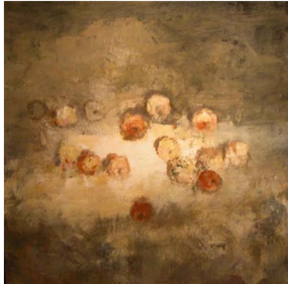
Miguel MACAYA, Huile sur bois

La peinture de Miguel MACAYA est très contemporaine, tout en puisant ses sources chez certains maîtres anciens. Ses tableaux - portraits de personnes et animaux, et natures mortes - présentent des échos du ténébrisme de Ribera et de Zurbaran, du meilleur de Goya et d'autres peintres plus modernes comme Cézanne ou Francis Bacon, ou même peut-être de certains peintres à matière tourmentée tels que Fautrier ou Soutine. Matière quelque peu brutale et angoissée, solitude des êtres dans leur environnement, de toutes les figures dans l'obscurité de leur espace, qui est leur propre fond, et violence du contraste entre la lumière et l'ombre, entre la vie et la vie et la mort.