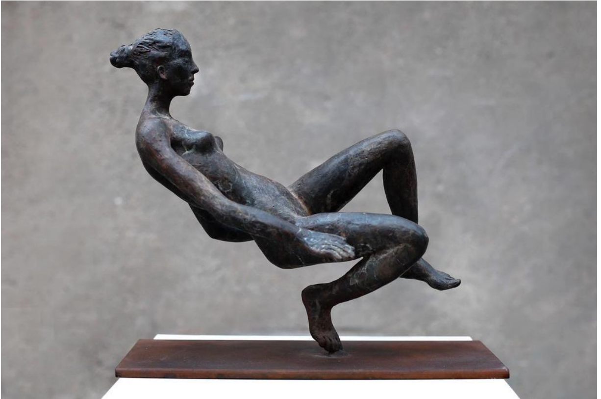
Marta MOREU - « Mujer tumbada VII » - bronce original - 29 x 31 x 15 cm