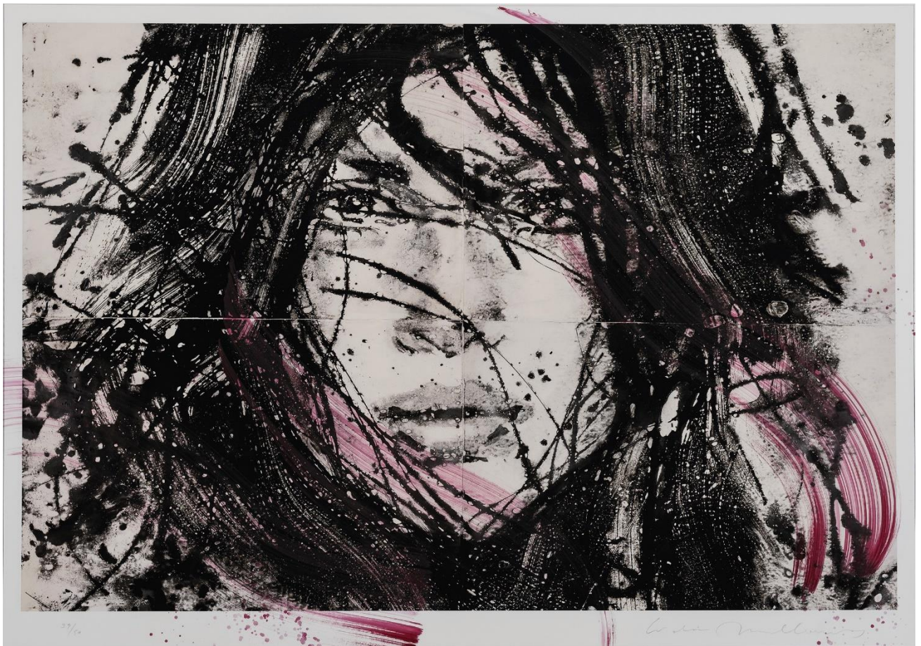
Lidia MASLLORENS - « Lithographie 22 , 39/50 » Edition numérique avec rehaut original acrylique - 110 x 152 cm