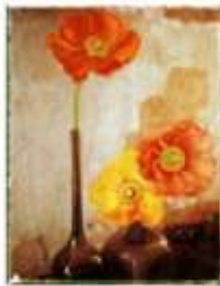
Julien Drach, impression numérique sur papier Fine Art - 40 x 50 cm ou 100 x 130 cm

Dans cette série « Still Life Polaroid », le point de départ de chaque prise de vue est une mise en scène inspirée par un bel ensemble de vases italiens chers par l'artiste, sur fond de ses propres photographies de murs marqués par l'érosion du temps et bien sûr par l'Italie, qui reste une source d'inspiration profonde pour l'artiste, renforcée par sa résidence à la Villa Medici en automne 2018.