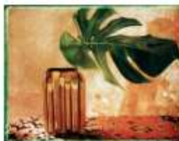
Julien DRACH Still life Polaroid - 2, 2018 Galerie Arcturus