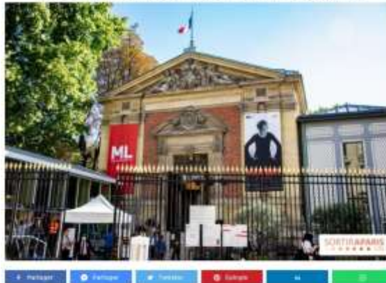
PHOTO DAYS : L'ÉVÉNEMENT QUI ANIME LA VIE CULTURELLE PARISIENNE - NOUVELLES DATES

Nat. Culture.fr - Photo Days | Publié le 9 décembre 2020 à 11h01 - Mis à jour le 9 décembre 2020 à 17h42