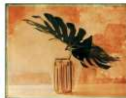
Julien DRACH Still life Polaroid - 9, 2018 Galerie Arcturus