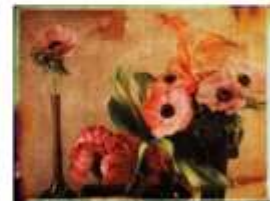
Julien DRACH Still life Polaroid - 7, 2018 Galerie Arcturus