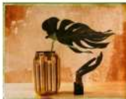
Julien DRACH Still life Polaroid - 5, 2018 Galerie Arcturus