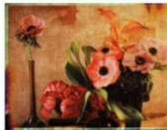
Julien Drach, impression numérique sur papier Fine Art - 40 x 50 cm ou 100 x 130 cm © Galerie Arcturus

comme comédien, avant de choisir la photographie comme mode d'expression. Passionné par l'image et la lumière, ce passeur d'émotions, éclaire à travers ses prises de vue délicates, la partie cachée et parfois même invisible, des choses, des êtres, du réel, pour en fixer une certaine nostalgie.