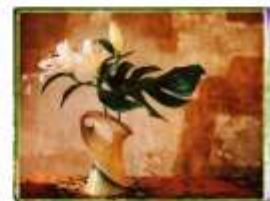
Julien DRACH Still life Polaroid - 6, 2018 Galerie Arcturus