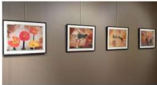
Julien DRACH en Galerie ARCTURUS

Exposition / Photographie Galerie Arcturus • Paris 06 8 décembre 2020 → 23 janvier 2021