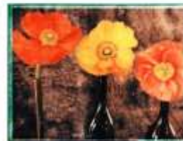
Julien DRACH Still life Polaroid - 11, 2018 Galerie Arcturus