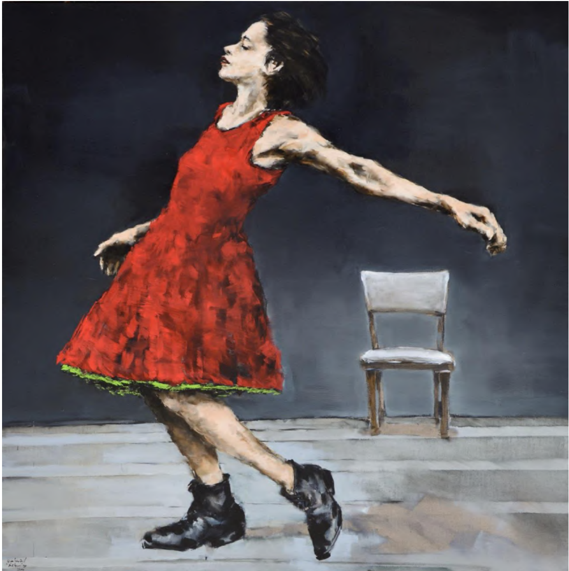
“Walking and falling”, huile sur toile, 120 x 120 cm

Dans son atelier, prennent corps et âme des personnages qui sont à la fois exotiques par leur physique, mais proches et contemporains par l'expressivité des sentiments qui leur donnent chair. Ses visages silencieux nous parlent subtilement d'une recherche de la vérité de l'être. Il expose très régulièrement en Europe depuis 1991