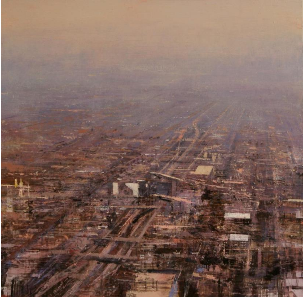
“Luz violeta y rosa en Chicago”, Huile sur bois, 100 x 100 cm

Les paysages urbains, villes, usines, autoroutes qu’il fixe sur la toile, soustraient un instant de la réalité quotidienne à l’incessant flux du temps. La superposition de couches fermes et d’effets de matière mettent en lumière des vibrations subtiles. C’est une œuvre mature, forte, qui joue sur la tension entre l’abstraction et la peinture référentielle. Il a reçu de multiples prix et ses œuvres sont dans de nombreuses collections.