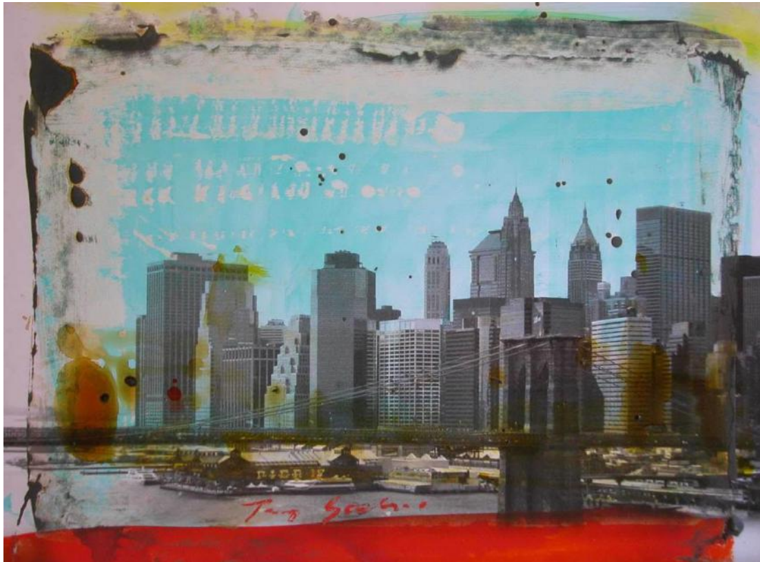
“New York”, mixte sur photo, 60 x 80 cm

Photographe, peintre, sculpteur, graveur Français, Tony Soulié est un artiste contemporain important. Depuis 1976 , il sillonne le monde entier: Etats Unis, Chili, Ghana, Corée du sud, Australie... Il réalise des photographies, puis leur donne cette patine inimitable, qui est sa marque de fabrique, en leur ajoutant des couleurs vives, leur procurant ainsi une double résonance, une profondeur poétique doublée d'une esthétique singulière, à la frontière entre la photographie et la peinture.