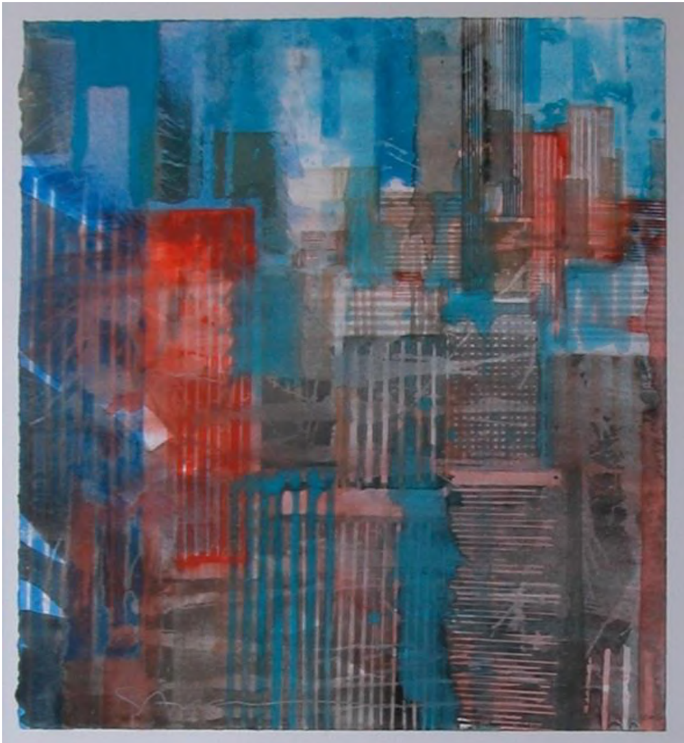
“New York”, Aquarelle sur papier, 30 x 24 cm

Aquarelliste exceptionnel, il fait jaillir toute la poésie des villes qu’il peint et transforme. Il recherche également des interactions avec le dessin, la gravure, la photographie, l’acrylique et la peinture à l’huile. Il expose depuis 1968 dans les principales galeries internationales en Europe, Japon, Etats-Unis etc... De nombreuses publications lui ont été consacrées en français, allemand, anglais.