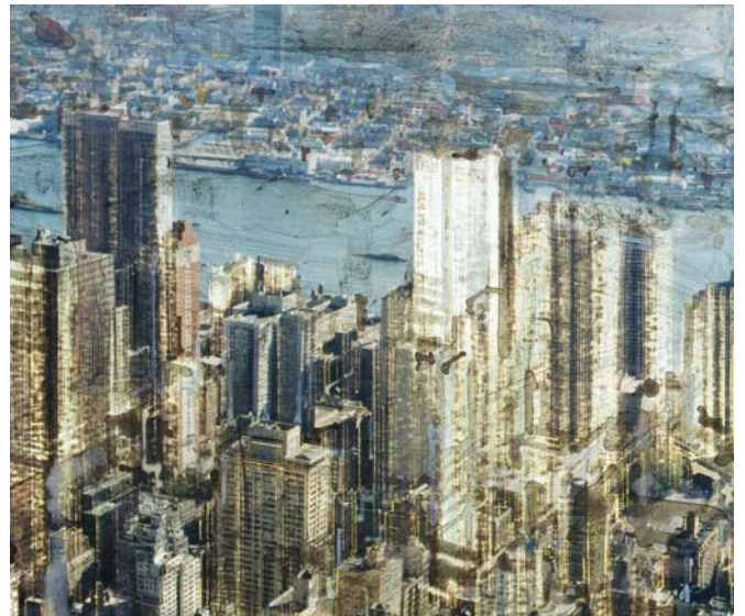
« NY East River » (détail)