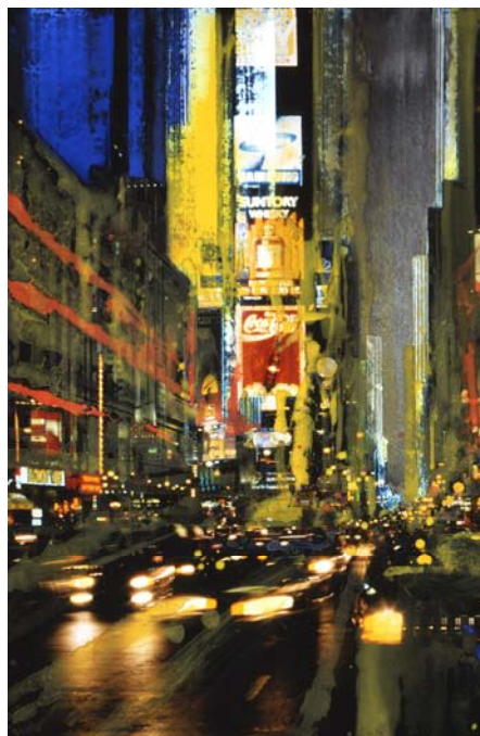
« NY Suntory » - Technique mixte sur photo – 75,9 x 50,7 cm - 2006