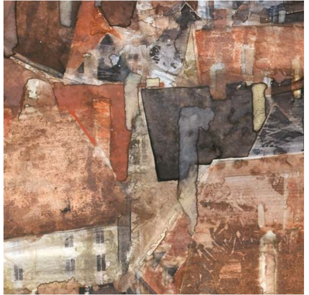
« Bourges I (détail) » - Aquarelle - 61 x 46,8 cm - 2006