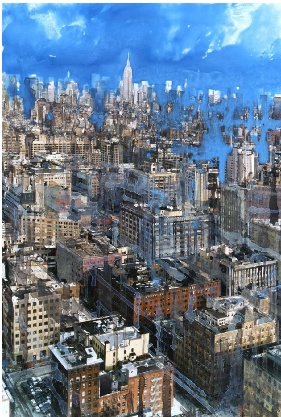
« NT liquide sky » - Technique mixte sur photo – 75,3 x 50,7 cm - 2006