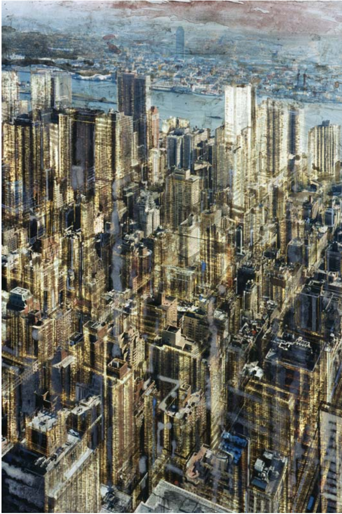
« NY East River » - Technique mixte sur photo - 75,9 x 50,7 cm - 2006