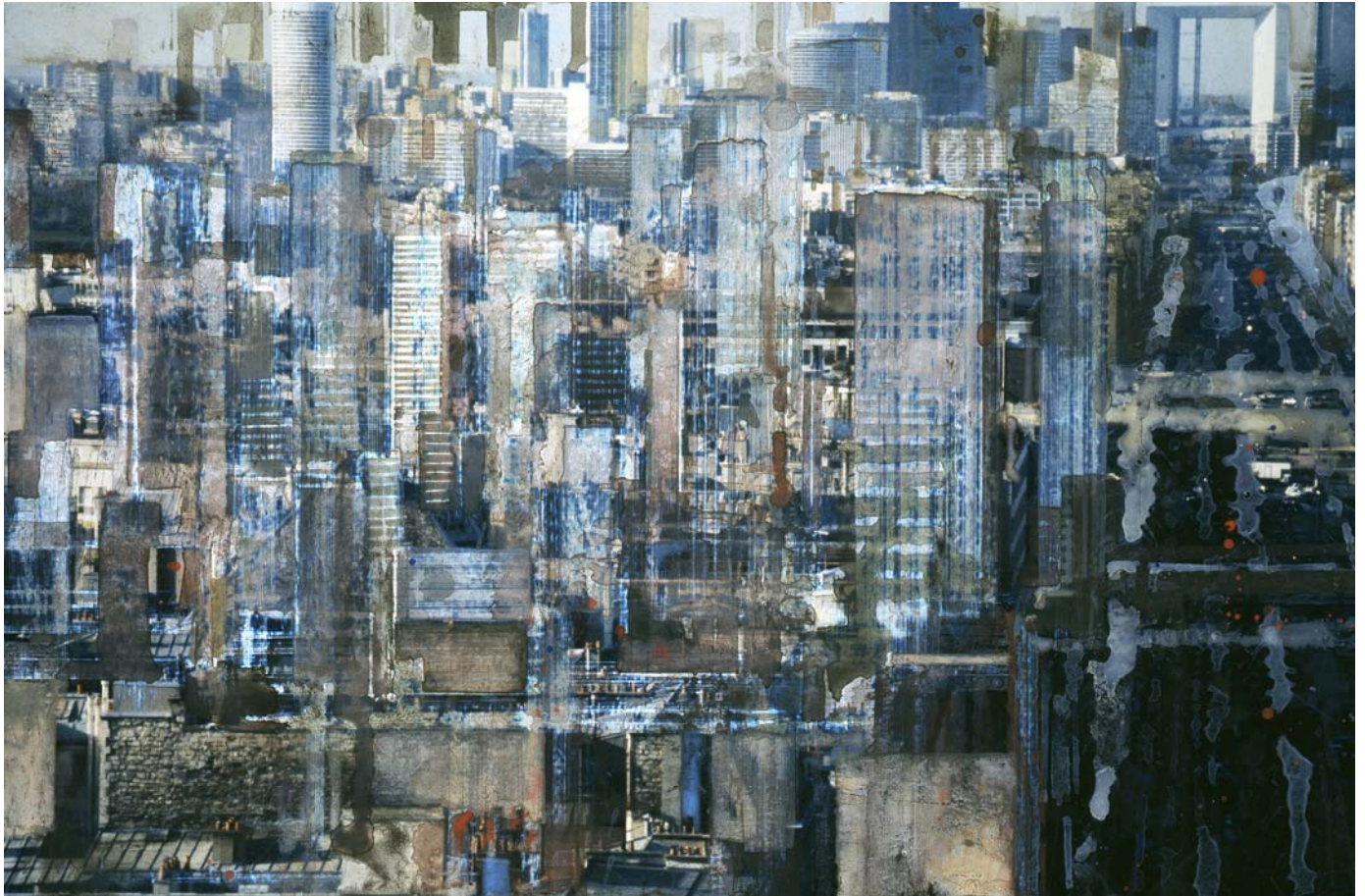
« Paris, l'Arche » - Technique mixte sur photo – 50,8 x 76,2 cm - 2006