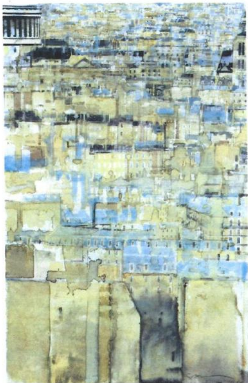
Paris, le Panthéon, 2004 - Aquarelle, 47,6 x 30,1 cm.

Nous lui avons consacré quelques pages dans Miroir de l'Art n°4, voici aujourd'hui une nouvelle occasion de découvrir ou re-découvrir son œuvre, cette œuvre si caractéristique qui s'appuie sur l'aquarelle et la photographie. En effet, il expose jusqu'au 28 octobre à la galerie Arcturus, au 65 rue de Seine, à Paris, de nouveaux tableaux où vous pourrez voir, non seulement Paris et New-York, thèmes récurrents dans son travail, mais aussi Le Tréport ou Bourges. On ne se lasse pas de la « manière » Salzmann !